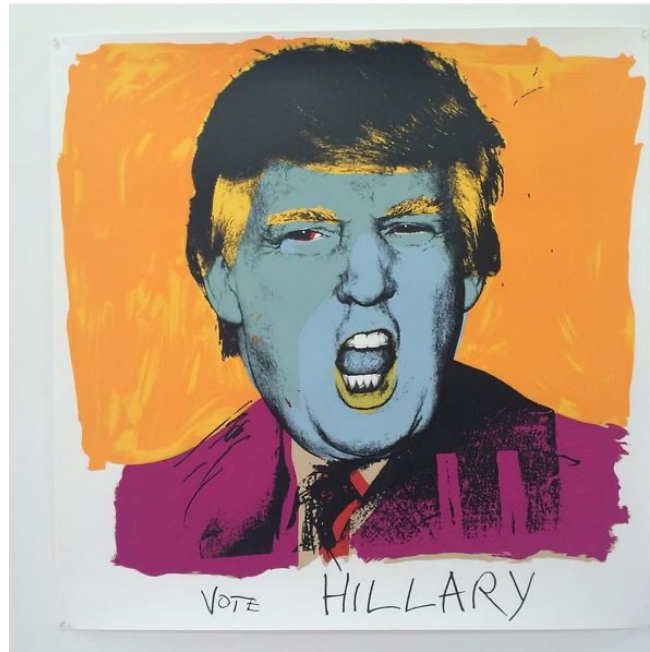
Görsel 6. Deborah Kass. Vote Hillary . 2016.

Deborah Kass ise Warhol'dan ilham alarak meydana getirdiği çalışmasında ABD seçimlerinde Cumhuriyetçi kanadın adayı olan Donald Trump'ı ele almıştır (Görsel 6). Warhol'un Nixon'ı betimlediği portre eserine gönderme niteliğinde olan Kass'ın çalışması da 2016 yılındaki başkanlık seçimleri ile -metinde daha önce bahsedildiği üzere Warhol'un bu temadaki sergisi seçim zamanında gerçekleşmişti- aynı zamanda oluşturulmuştur. Agresif bir yüz ifadesi çalışmanın merkezinde yer alan Trump, Kass'ın tercih ettiği renkler aracılığıyla pejoratif perspektifle izleyiciye aktarılmaktadır.