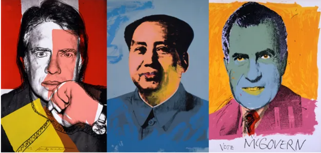
Görsel 5. Andy Warhol, Pop Politics: Andy Warhol , 1972, The Andy Warhol Museum, Pittsburg.

Deborah Kass ise Warhol'dan ilham alarak meydana getirdiği çalışmasında ABD seçimlerinde Cumhuriyetçi kanadın adayı olan Donald Trump'ı ele almıştır (Görsel 6). Warhol'un Nixon'ı betimlediği portre eserine gönderme niteliğinde olan Kass'ın çalışması da 2016 yılındaki başkanlık seçimleri ile -metinde daha önce bahsedildiği üzere Warhol'un bu temadaki sergisi seçim zamanında gerçekleşmişti- aynı zamanda oluşturulmuştur. Agresif bir yüz ifadesi çalışmanın merkezinde yer alan Trump, Kass'ın tercih ettiği renkler aracılığıyla pejoratif perspektifle izleyiciye aktarılmaktadır.