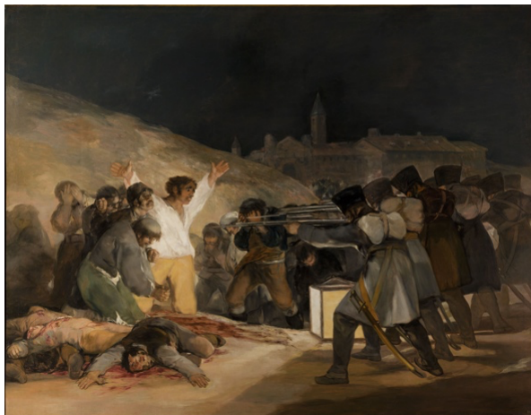
Görsel 1. Francisco Goya. 3 Mayıs 1808 . 286x 347 cm, yağlıboya. Prado Müzesi, Madrid.

Ancak sanat ve siyaset kavramları ve bu olguların etkileşimi Modernizm ile tartışılmaya başlanmış ve dönemin düşün otoriteleri tarafından kati şekilde ayrı ve bağımsız alanlar olarak kabul edildiği görülmektedir.