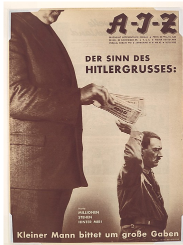
Görsel 3. John Heratfield. Para. 1932, fotomontaj.

Postmodernizm öncesi dönemde özellikle modernizm periyodu içerisinde sanatçıların eserleriyle, politik hamleleri veya sonuçlarını net bir şekilde eleştirdikleri görülür (Görsel 2). Bu eleştirilerin politik figürler üzerinden örnekleri ise görece azdır. II. Dünya Savaşı'na giden sürecin önemli aktörü olan Adolf Hitler'de savaşın ve insanlığın o zamana kadar gördüğü en acı tecrübelerin mimarı olarak sanatçıların çalışmalarına konu olmuştur. Dadaist John Heartfield'in AIZ dergisi için oluşturduğu çalışmasında (Görsel 4); marksist ideolojinin güdümüyle Hitler'i kapitalist anlayışın bir tecessümü olarak sunar. Erwin Blumenfeld, diktatör (Görsel 3) adlı fotomontaj çalışmasında ise Führer üzerinden ölüm ile analogi ilişkisi kurar (Stone, 2022).