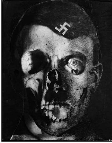
Görsel 4. Erwin Blumenfeld. Diktatör. 1933, fotomontaj, Amsterdam.