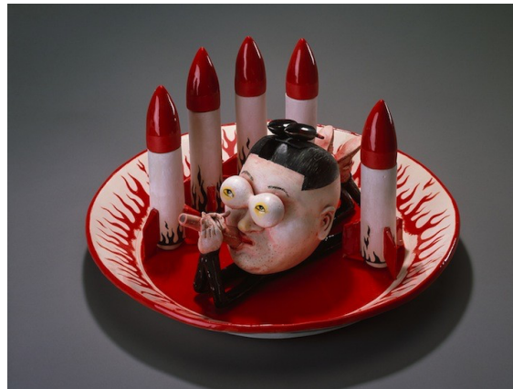
Görsel 8. Patti Warashina, Kimchee Chaos , 2013, Porselen.

Çalışmalarında mizahi unsurları ön plana çıkaran Patti Warashina, çağdaş dünyanın apokaliptik gerçekliğini fantazmagorik seramik figürler aracılığıyla yorumlamaktadır. Sanatçının Kimchee Chaos (Görsel 8) adlı eserinde, dünya siyasetinin sıra dışı figürlerinden biri olan ve otoriter yönetim tarzıyla dikkat çeken Kuzey Kore lideri Kim Jong-un, nükleer gücüne duyduğu övünçle sıkça dile getirdiği füzeler eşliğinde, kanla ilişkilendirilen bir sofraya eşyası üzerinde puro içerken betimlenmiştir. Porselen tabağı çevreleyen alev motifleri ise, Kuzey Kore'nin küresel düzeyde yarattığı tehdit ve kaos atmosferini simgesel bir dille aktarmakta; bu yolla Warashina, politik şiddet ve küresel gerilimleri ironik ve eleştirel bir perspektiften yeniden üretmektedir.