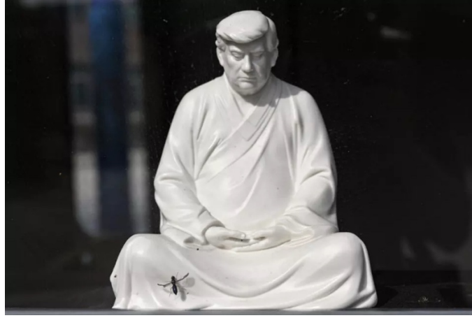
Görsel 11. Hong Jinshi, Buddha like Trump , 2021.

Donald Trump'ı çalışmasının odağına alan diğer bir sanatçı ise Hong Jinshi'dir. Sıra dışı söylemleriyle öne çıkan Başkan Trump, Hong'un eserinde -paradoksal biçimde- sakin, gözleri kapalı ve tefekkür eden Buda analogisiyle betimlenmektedir (Görsel 11). Hong; heykellerinin izleyicide tebessüme neden olduğunu ve bunun Trump'ın kişiliği ile heykelin formunun iki zıt uç olmasından kaynaklandığı belirtmektedir. Ayrıca Hong'un porselen heykellerinin bulunduğu kutuların üzerinde; bir zamanlar Trump'a seçimi kazandıran "Amerika'yı yeniden harika yapın" (Make Amerika great again) sloganından esinle Çince "şirketinizi yeniden harika yapın" cümlesi yer almaktadır (Xiamen, 2025).