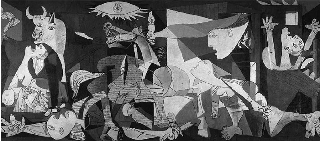
Görsel 2. Pablo Picasso. Guernica . 1937, 349x776 cm, yağlıboya. Reina Sofia Müzesi, Madrid.

sanatçı; sanat emekçisi, ortaya koyduğu yapıt ise toplumsal farkındalığı sağlayan bir araç konumundadır (Değerli ve Demir, 2022, s. 191). Toplumsalın bir ögesi olarak kabul edilmesini savunan Marksizm, sanat ve siyaset ayrışıklığının hamiliğini yapan modernist yaklaşımları eleştirir ve iki bağımsız olgu şeklinde alımlanan bu kavramların birbirlerinden bağımsız düşünülmemeyeceğini ileri sürer. 20. Yüzyılın öne çıkan toplum bilimci ve düşünürleri Theodor W. Adorno ve Max Horkheimer'in düşün dinamiklerinde ise siyaset ve sanat alanlarının arasında sınırların olamayacağını ve bu iki disiplinin kesin biçimde birbiriyle etkileşim halinde olduklarını görürüz. Adorno'nu felsefesinde sanat, kapitalist sistem içerisinde bağımsız bir konumda yer alarak sorgulayıcı ve dönüştürücü potansiyele sahiptir (Korkmaz ve Arıkan, 2018, s. 26, 28). Ranciere'de benzer şekilde sanat ve politikanın işlevselliğinin, duyumsanabilenin yeniden şekillendirilmesine, görünmez olanın görünür kılınmasına dayandığına ve bu özelliklerinden dolayı birbirinden ayrı değil benzer şekilde her iki kavramın da ontolojik olarak algılanabilirliğe bağlı koşullu gerçeklikler olduğuna vurgu yapar (Ranciere, 2014, s. 209, 210).