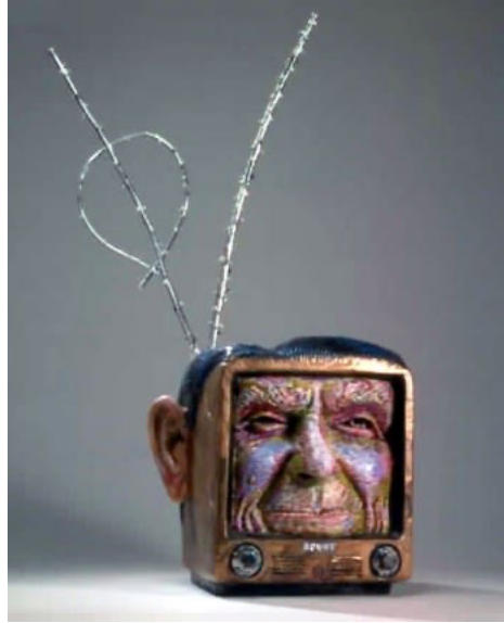
Görsel 7. Robert Arneson, Ronny Portable , 1986

Toplumsal ve politik konuları eleştirel bir biçimde ele alan ve funk sanatın en önemli temsilcisi olan seramik sanatçısı Robert Arneson yapıtlarında, yoğun ironiyi alaycı bir mizah ile izleyiciye sunmaktadır. Dönemin Amerikan Başkanı olan Ronald Reagan'ın hedef aldığı Ronny Portable (Görsel 7) adlı çalışması, Regan'ın nükleer bombaların ön planda olduğu soğuk savaş dönemine göndermeler taşımakta ve Başkan Reagan'ı bir televizyonun içerisine hapsolmuş şekilde tasvir etmektedir.