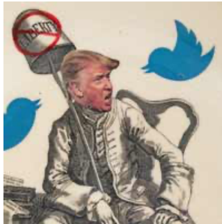
Görsel 10. Michelle Erickson, Trumped Up China , 2018.

Michelle Erickson ise bir dönemin ABD Başkanı Donald Trump'ı ve söylemlerini sofraya eşyaları üzerine yerleştirdiği imajlarla eleştirmektedir (Görsel 10). Erickson, 1763 yılında William Hogarth'ın gravür baskısını Trump portresi eklemeyerek yorumlamıştır. Sanatçı; John Wilkes'in İngiliz sömürgesinin devamlılığı için The North Briton gazetesini propaganda için kullanmasını, Trump'ın medyayı kullanma biçimiyle benzeştirmektedir (Yüksel, 2018, s. 1170, 1171). Hogarth'ın Wilkes'inin gülümseyen betimlemesi, Erickson'un Trump'ında agresif bir biçimde aktarılmakta ve elinde tuttuğu özgürlük (liberty) yazısının üzerine konumlandırılan işaretle de ironik biçimde ayrışmaktadır.