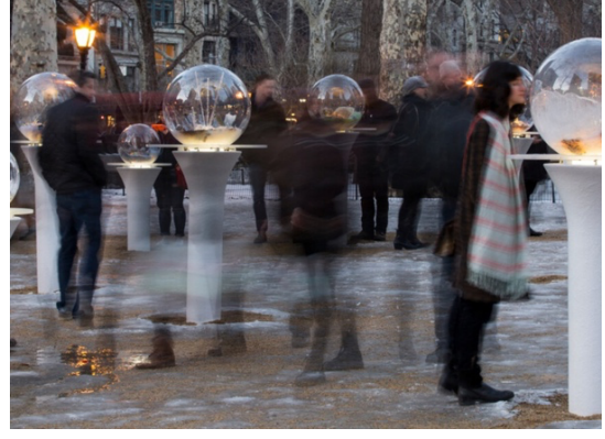
Teraryumlar Madison Squaer Park, 2014