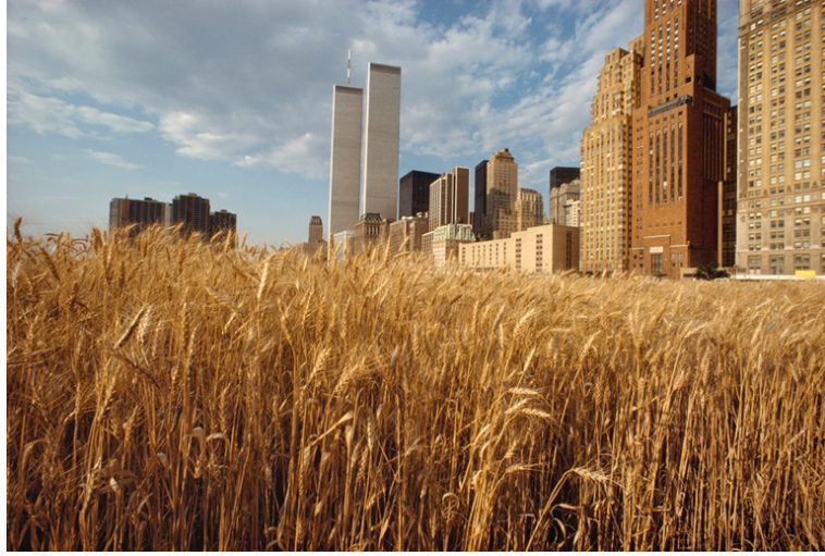
Görsel.2. Agnes Denes, 1982, Wheatfield- A Confrontation (Buğday Tarlası-Bir Yüzleşme)

Agnes Denes 1982 yılında Wheatfield- A Confrontation (Buğday Tarlası-Bir Yüzleşme) projesi, sanatçının Manhattan'da Wall Street ve Dünya Ticaret Merkezi yakınlarında moloz yığınlarıyla dolu bir araziye buğday ekmesiyle gerçekleşmiştir. Sanatçı bölge için oldukça önemli en pahalı binalarla insanın en temel besinini karşı karşıya getirerek gıda, açlık, ekonomi, ticaret, atıklar, ekolojik kaygılar gibi sorunlara ve tartışmalara dikkat çekmek istemiştir. Bu bağlamda sanatçı izleyicilerinin eseri sadece görmesini değil içine girip gezinmesini talep etmiştir. İzleyiciler esere dahil olup katıldığında sanatçının gözler önüne serdiği bu keskin sert zıtlığı kendi içinde içselleştirip daha da anlamlandırabilirler. Bir fotoğraf, yazılı bir metin basit bir iki boyutlu görselden ziyade bu geniş alandaki bu ekoloji odaklı çalışmada izleyici, işle ilişkisel bir hal alır, eseri özümser ve kendi içinde sanatçının düşüncesini daha fazla anlamlandırma şansına sahip olur. Dolayısıyla hayatın içinden gerçek bir kesitten üretilen bu çalışma izleyicisiyle doğrudan etkileşime girer, sanatın katılımcı, ilişkisel yönünü açığa çıkarır.