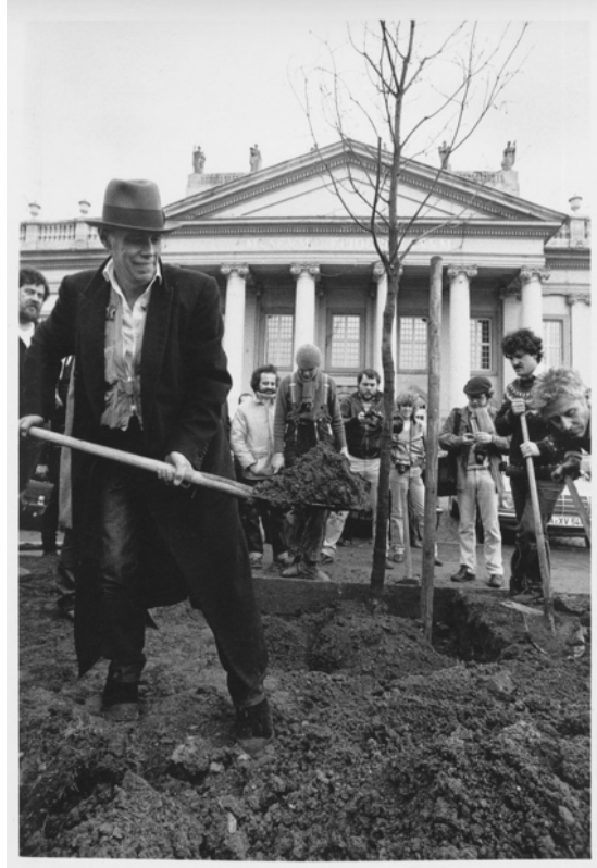
Görsel 1. Joseph Beuys, 1982, 7000 Meşe projesi

Joseph Beuys'ta Kassel'de ekolojik kaygıyla 7000 Meşe projesini gerçekleştirmiştir. Joseph Beuys, öğrencileri ile kent sokaklarını süpürerek topladığı çöpleri cam bir sandık içinde sergilediği çevreci eylemi "Sosyal Heykel" olarak tanımlamıştır (Erzen, 2014). Sosyal Heykel eylemi ve düşüncesinde, izleyici, sanatçı ve yapıt arasında geleneksel bir ilişki söz konusu değildir. Geleneksel heykel ve Beuys Heykeli (sosyal heykel) arasındaki önemli fark özgünlükle ilgilidir. Geleneksel bir heykel formu olan özgün yapıt hala müzede sergilenmektedir. Ama Beuys'un bizzat parçası olduğu sosyal heykel olan özgün yapıt, eylem bittikten sonra yok olmuş fakat geriye birtakım belgeler, yerleştirmeler, izleyicilerinin eylemlerinden anılar kalmıştır. Beuys'un sanatında, yaşanan bu süreci ve bu süreçten arda kalanları okumak ve yapıta çöreklenmiş düşüncüyü anlamak ve anlamlandırmak önem taşır. Ayrıca Beuys için seyirci seyircilikten kurtulup sanatçılığa eğilmeli ve dünya sahnesine inmeli. Ona göresanatın yapay kurgu mekanlarından uzak, dünya gerçek bir sahne ve her insan da sanatçıdır (Yılmaz, 2011: 292). Sanatçının, eylemsellik, katılımcılık ve ilişkisellik odaklı 1960'larda ortaya attığı, sanat ve politikanın bir sentezi gibi görünen bu sosyal heykel kavramı, bugüne kadar toplumsal bilinçlenmelerin ve oluşumların öncüsüdür (Erzen, 2014).