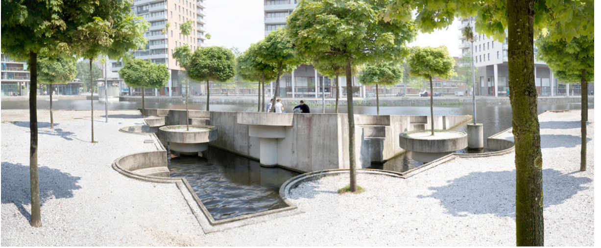
Görsel 4. Vito Acconci, Suda Park, 1993, Hollanda

Sanatçı Vito Acconci, 1960'lı yıllardan itibaren performans, video, film, enstalasyon gibi birçok farklı alanda işler üreterek doğayı vurgulayan kamusal mekân düzenlemeleri yapar. Sanatçı kamu mekanlarındaki düzenlemelerinde alanın fonksiyonunu yeniden kullanmaya odaklı işler üretir. Sanatçı, Hollanda'da Laakhaven/Holland Spoor bölgesinde Suda Park adında bir proje gerçekleştirmiştir. Sanatçı projesini denizin üzerinde yüzen buz parçaları olarak tasarlamıştır. Projeyi gerçekleştirdiği bölge karmaşık bir alana sahiptir. Bölgede üniversite, ev, iş, alışveriş merkezleri, sanayi yerleşimleri birlikte yer alır. Suda Park, karaya bağlı üçgen bir parçayla birlikte düzenli olarak ayrılmış başka bir üçgenden, U biçimindeki su kanalının çevresinde dolanan ağaçların dışarıya doğru uzamasından, büyük saksıların içinde dikilen ağaçlardan, sokak lambalarından oluşmaktadır. Yapboz gibi tasarlanan bu mekânda oluşan negatif formlar farklı bölümlere adım atmak ve oturmak için kullanılır. Sanatçı, Hollanda'nın toprak doldurarak elde ettiği arazilerle birlikte suyun ve karanın doğal olmayan ilişkisini sorgulamıştır. Doğa ve insan arasındaki diyalogu ve devam etmekte olan savaşı anlatmaya çalışmıştır (Dempsey, 2011: 163). Ayrıca sanatçı, insanların rahatça yürüyebildiği tek yer parkların olduğu düşüncesinden hareketle insanların katılım sağlayacağı ve diyalog kuracağı bir alan yaratmak istemiştir. (Castro, 2004).