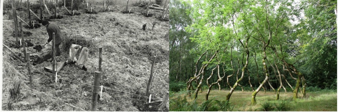
Görsel 6-7: David Nash, Dişbudak Projesi, 1977-devam ediyor, Galler civarı

Doğadan esinlenen bir diğer sanatçı da David Nash' tır. Sanatçı, Kuzey Galler'deki Festioniog Vadisindeki yürüyüşleri sırasında topladığı kurumuş ağaç dal/parçalarını yontarak, şekil vererek ve yakarak yaptığı çalışmalarla bilinir. Ayrıca sanatçı ağaçların büyümesini de sanata dönüştürür. 1977 yılında 22 dişbudak fidanını dikerek başladığı Dişbudak Kubbe yapıtı fidanların büyüdüleri zaman kubbe oluşturması için şekillendirilerek sanatçının uzun süreçteki bakımı ve ilgisiyle gerçekleşir.