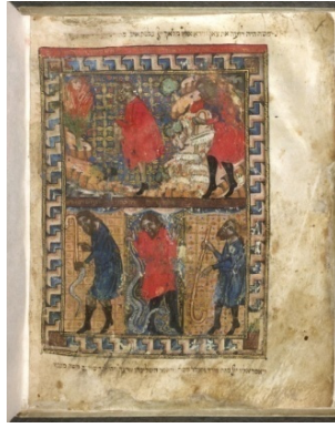
Görsel 10: Yılan Olan Değnek Mucizesi”, Altın Haggadah, 1320-1330, Britanya Kütüphanesi, MS Or. 1404.