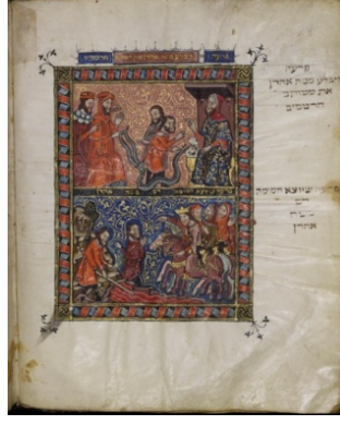
Görsel 9: Yılan Olan Değnek Mucizesi”, Rylands Sephardi Haggadah , 14. yüzyıl, Manchester Üniversitesi Kütüphanesi MS 6.