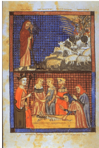
Görsel 8: "Yılan Olan Değnek Mucizesi", Saraybosna Agadası, 1350, Bosna-Hersek Ulusal Müzesi.