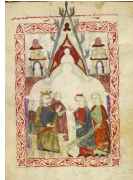
Görsel 4-5: "Yılan Olan Değnek Mucizesi", Hispano-Moresque Haggadah, 1300 civ., Britanya Kütüphanesi, Or. 2737 fol. 063 v.