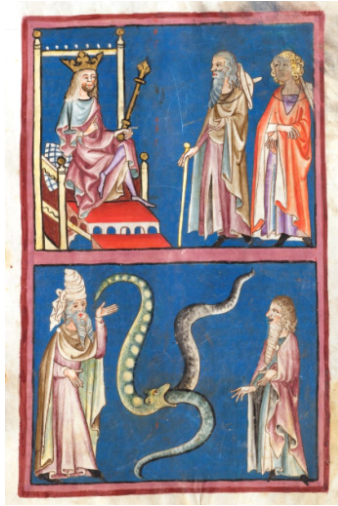
Görsel 11: Yılan Olan Değnek Mucizesi”, Weltchronik , 1340 civ., Zentralbibliothek Zürich Ms. Rh. 15.