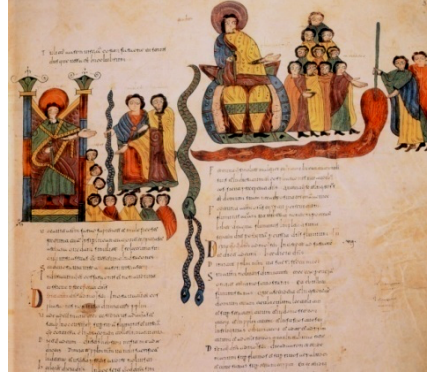
Görsel 1: "Yılan Olan Değnek Mucizesi" ve "Nil'in Sularının Kana Dönüştürülmesi", 960, León Kraliyet Anglikan Kilisesi Müzesi, fol.36.