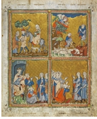
Görsel 6: "Yılan Olan Değnek Mucizesi", Altın Haggadah, 1320-1330, Britanya Kütüphanesi, Add MS 27210 fol. 10 v.