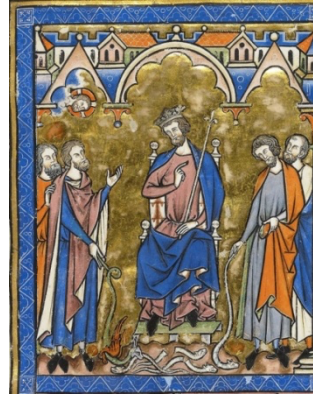
Görsel 2-3: "Yılan Olan Değnek Mucizesi", Morgan İncili, 13. yüzyıl, Morgan Kütüphanesi ve Müzesi, MS M. 638 fol. 8r.