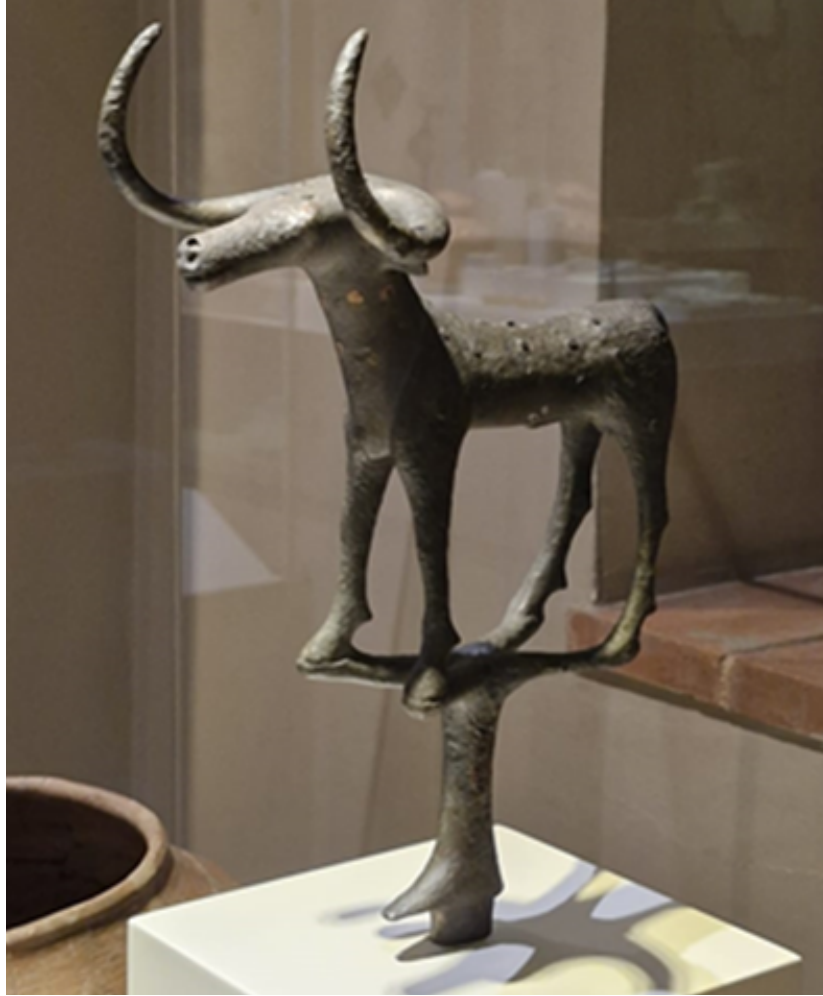
Resim 1 : Boğa Figürü 2

Hitit Uygarlığının önemli sembollerinden biri olan boğa, Tanrı'yı simgelemektedir. Hitit bayram merasiminde kral ve kraliçenin, başrahip ve rahibenin boğa karşısında kutlama tasviri günümüze ulaşmıştır (Kadı, 2023: 155). Boğa, güçlü bir hayvan oluşundan dolayı Tanrı'yı temsil eden bir semboldür. Anadolu Uygarlıkları müzesinde boğa figürlü içki kapları sergilenmektedir. Bu boğalar fırtına tanrısının iki boğasıdır (Ergener, 2022: 53, 54). Hitit Kral ve kraliçelerin dini törenlerde geyik ya da boğa şekilli kadehler kullanması Tanrı'yla birleşme sağladıkları inancından kaynaklanmaktaydı (Gerçek, 2020: 192). Heykel olarak madenden yapılmış boğa figürleri ise törenlerde sancak olarak taşınarak kullanılmıştır (Turani, 2010: 108).