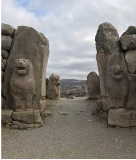
Resim 6: Aslanlı kapı 7

I.Ö. 1400 civarı inşa edilen Hattuşaş kalesinin üç adet kapısı vardır. Bu girişlere yapılmış aslan, savaş tanrısı ve sfenks anıtları, Hititlerin abidevi heykelleri olarak bilinen önemli yapıtlardır (Turani, 2010: 122). Hattuşaş'ın güneybatısında bulunan bu abidevi kapı, iki tarafında aslanlı heykellerle inşa edilmiş olup, aslanların vurgulanan büyük gözleri ve ağızlarıyla şehri korur nitelikte olduğu inancı açıkça görülmektedir (Arkeogezgin, 2019). Boğazköy sfenkslerinin aksine, aslanların heybetli gövdeleri ve kısa bacakları sadece cepheden işlenmiştir (Eczacıbaşı vd., 1997: 793). Aslanlı kapıdaki bu heykellerin görkemli görüntüleri ile başka sanat alanlarını da etkileyerek ilham vermesi anlaşılır görünmektedir.