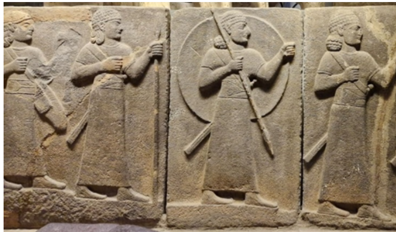
Resim 7: Hitit Kabartma Heykelleri (rölyefleri) 8

Hitit kent duvarları ve tapınaklarında insan figürlü, tanrıları simgeleyen rölyefler ve bezemeler bulunmaktadır. Özellikle Geç Hitit çağı kabartma heykelleri ile ünlenmiştir (Kuban, 2023: 26, 27). Orthostat adındaki bu taş süslemeler, anlatımcı görüntüde işlenmiştir (Eczacıbaşı vd, 1997: 794).