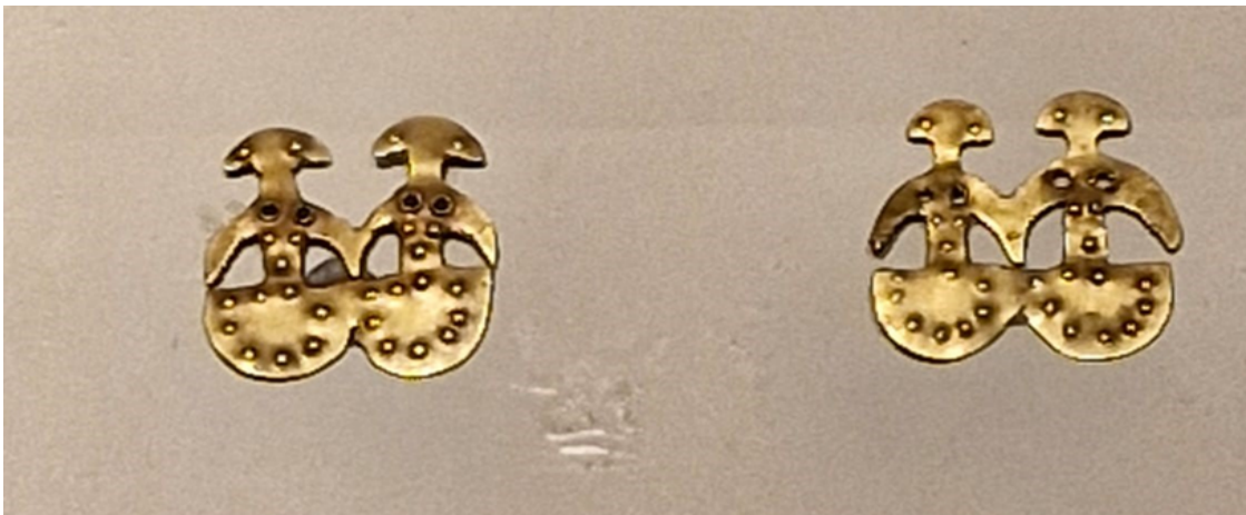
Resim 3: İkiz İdoller 4

Bazıları değerli metallere yapılmış olan bu küçük heykelticikler genel olarak ipe geçirilebilen Amulet (muska) niteliğinde yapıtlardır. Bu tarz yapıtlar genel olarak tanrıları simgelemektedir (Eczacıbaşı vd, 1997: 793). Üzerlerinde delikler olan bu idoller genellikle hükümdarların gerdanlıklarını ve asalarını süslemiştir (Turani, 2010: 108).