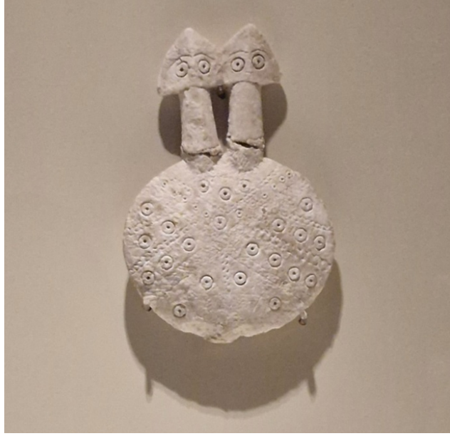
Resim 4: İkiz idoller 5