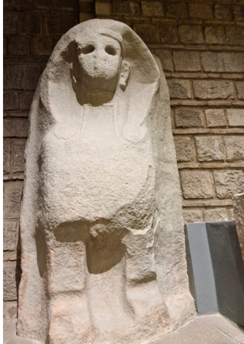
Resim 5: Alacahöyük sfenksi 6

Hitit imparatorluğu görkemli kent surları ve tapınak yapıları ile ileri bir mimariye sahiptir. Büyük simetrik kapı yapıları, kuleler arası kemerli girişleri ve duvar kabartmaları Boğazköy ve Alacahöyük'teki Sfenksli şehir kapıları muazzam niteliktedir (Kuban, 2023: 26). En eski anıtsal kabartmalardan olan Sfenksler, surların kapılarını koruduğuna, kente kötülüğün girmesini engellediğine inanılarak inşa edilmiştir (Eczacıbaşı vd, 1997: 793). Bu yapıtlarda dönemin rölyef ve heykel sanatı, sanat ve zanaatın birbirinden ayrılma çabaları ve soyut etkiler de izlenmektedir (Eroğlu, 2019: 16, 17).