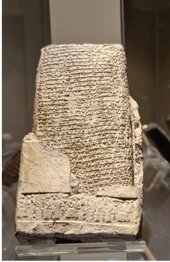
Resim 8: Hitit tableti 9

Atatürk'ün desteğiyle 1931 yılında başlanan bu kazılarda, Boğazköy'ün çeşitli yerlerinde bulunan 10000 tablete ek olarak İnandık, Ortaköy, Maşat höyük ve Kuşaklı yapılan kazılarda da ilk kazılara ek olarak bir o kadar daha arşiv elde edildi. Bu tabletler bizi Hitit Uygarlığının siyasi tarihi ve toplumsal yaşamı hakkında birçok bilgiye ulaştırmıştır (Çığ, 2022: 121,122).