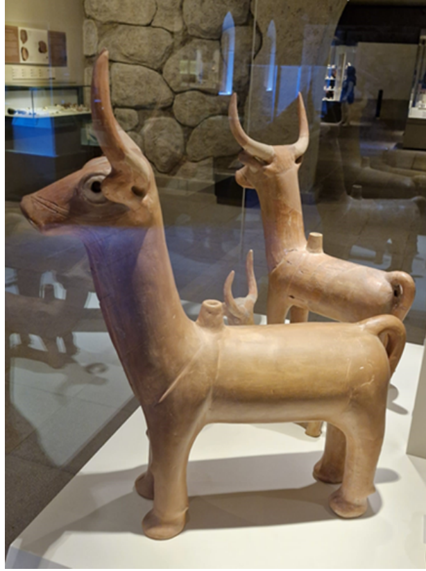
Resim 2: Boğa figürlü kap 3