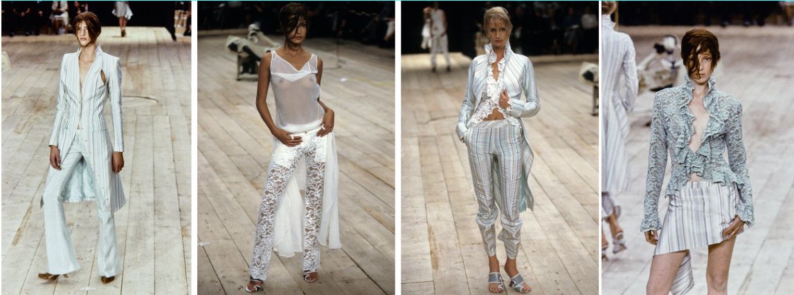
Görsel 6. McQueen. A., 1999 Spring/Summer, No.13 defilesi. Gatliff Warehouse; Londra, (URL 1).