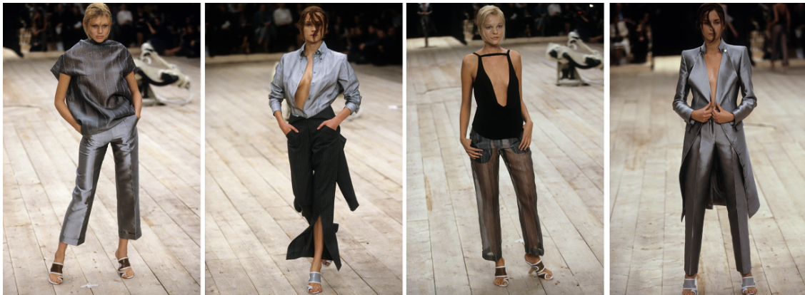
Görsel 4. McQueen. A., 1999 Spring/Summer, No.13 defilesi. Gatliff Warehouse; Londra, (URL 1).