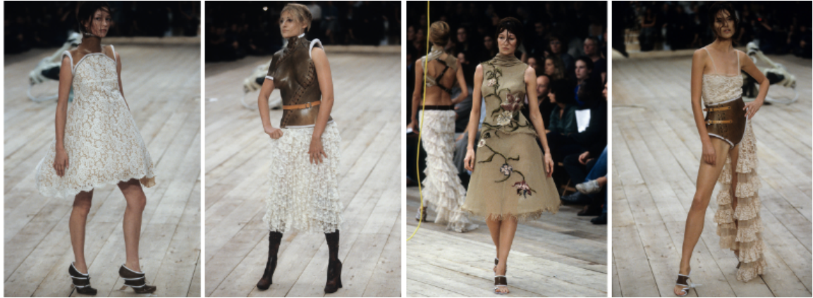
Görsel 9. McQueen. A., 1999 Spring/Summer, No.13 defilesi. Gatliff Warehouse; Londra, (URL 1).

Renk paleti, çoğunlukla nötr tonlardan oluşmakta ve beyazın farklı dokulardaki kullanımıyla dingin bir zemin oluşturmaktadır. Sunum bağlamında, defiledeki ahşap podyum ve modellere verilen özgün stil, doğal ve teknolojik unsurları bir araya getirerek McQueen'in estetik vizyonunu güçlendirmektedir. Modellerin duruşları ve yürüyüşleri, kıyafetlerin dinamiklerini izleyiciye yansıtırken, aynı zamanda tasarımların sanatsal yönünü ön plana çıkarmaktadır (Görsel 8, 9, 10, 11).