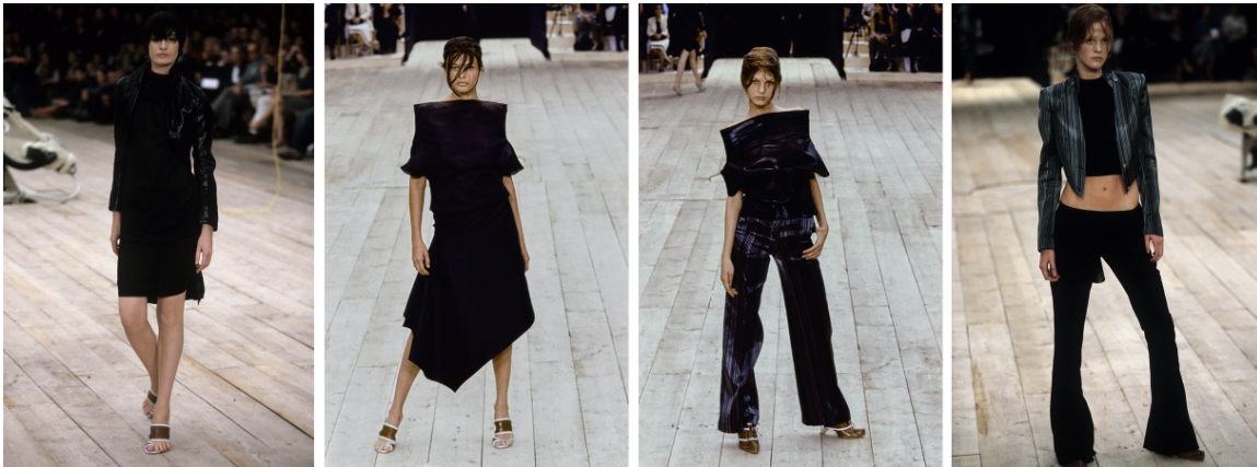
Görsel 1. McQueen. A., 1999 Spring/Summer, No.13 defilesi. Gatliff Warehouse; Londra, (URL 1).

McQueen'in No. 13 defilesi, sanat ve moda ilişkisini vurgularken, aynı zamanda günümüz dijital tasarım süreçleriyle de bağ kurulabilecek bir dönüşümü öngörmektedir. McQueen'in mekanik ve sanatsal bileşenleri bir araya getirme anlayışı, günümüz yapay zekâ destekli moda tasarımlarıyla paralellik göstermektedir. Özellikle son yıllarda dijital moda platformlarında (örneğin, The Fabricant veya DressX gibi sanal moda markaları) yapay zekâ algoritmaları ve 3D modelleme teknikleri kullanılarak oluşturulan giysiler, McQueen'in defilelerinde öne çıkan deneysel tasarım anlayışıyla örtüşmektedir (Brunet, 2021: 112).