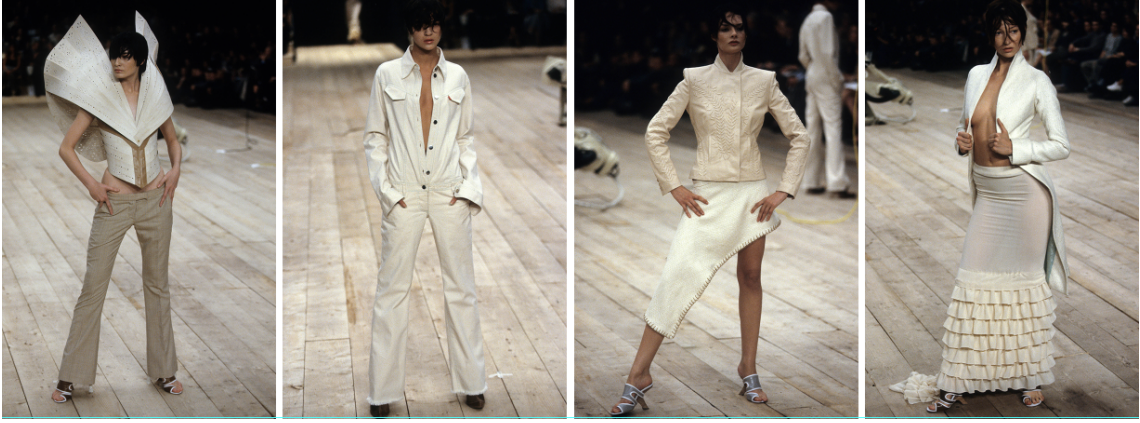
Görsel 10. McQueen. A., 1999 Spring/Summer, No.13 defilesi. Gatliff Warehouse; Londra, (URL 1).