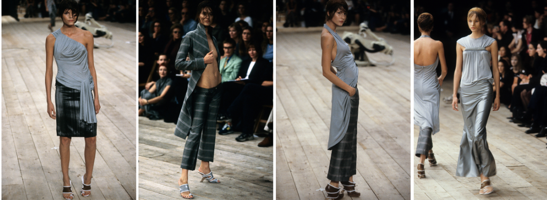
Görsel 3. McQueen. A., 1999 Spring/Summer, No.13 defilesi. Gatliff Warehouse; Londra, (URL 1).

Siyah detayların koleksiyona eklenmesi, dramatik bir kontrast yaratarak McQueen'in teatral anlatımını desteklemektedir. Nötr tonlar ve siyahın kombinasyonu, tasarımların incelikli dokusunu ve kesim detaylarını ön plana çıkarırken, izleyicilere minimalist bir estetik ile karmaşıklık arasında bir denge sunmaktadır.