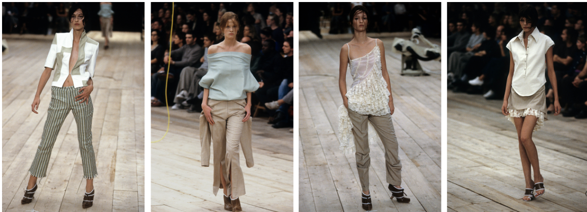
Görsel 7. McQueen. A., 1999 Spring/Summer, No.13 defilesi. Gatliff Warehouse; Londra (URL 1).