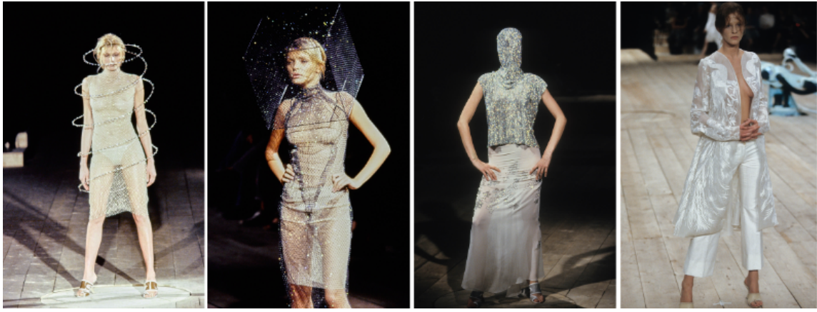
Görsel 11. McQueen. A., 1999 Spring/Summer, No.13 defilesi. Gatliff Warehouse; Londra, (URL 1).