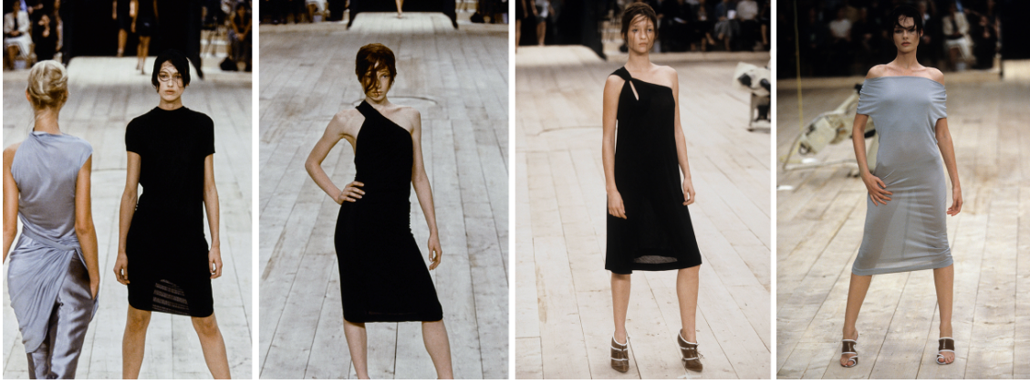
Görsel 2 McQueen. A., 1999 Spring/Summer, No.13 defilesi. Gatliff Warehouse; Londra, (URL 1).

Koleksiyondaki kıyafetler, farklı dönemlerin ve stillerin etkilerini bir araya getirirken, McQueen'in özgün tasarım anlayışını yansıtmaktadır. Özellikle kalıp ve yapı açısından incelendiğinde, tasarımlar güçlü bir deneysellik sergilemektedir. Bazı parçalar, geleneksel terzilik anlayışına meydan okuyarak asimetrik ve katmanlı detaylarla zenginleştirilmiş, diğerleri ise keskin hatlara ve heykelsi formlara sahiptir (Görsel 2). Bu, McQueen'in zanaatkârlığa olan saygısını ve aynı zamanda geleneksel kalıpları yeniden yorumlama becerisini ortaya koymaktadır.