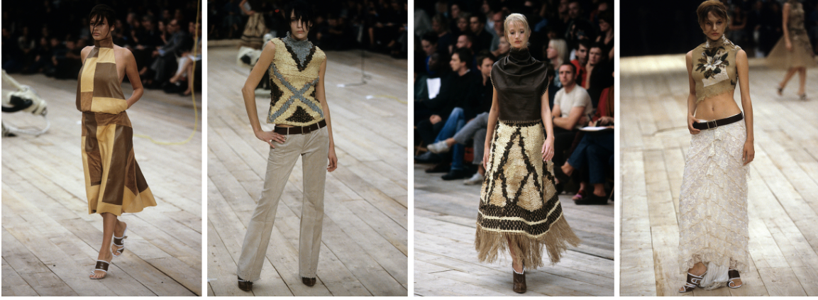
Görsel 8. McQueen. A., 1999 Spring/Summer, No.13 defilesi. Gatliff Warehouse; Londra. URL 1.

Koleksiyonun renk paleti, ağırlıklı olarak nötr tonlardan oluşmakta ve yer yer metalik yansımalarla güçlenmektedir. Bu renk seçimi, koleksiyonun avangart anlatısını destekleyen incelikli ancak güçlü bir unsurdur. Nötr tonlar, dokuların ve yenilikçi kesimlerin ön plana çıkmasına olanak tanırken, metalik dokunuşlar ise koleksiyona futuristik bir hava katmaktadır. Bu tercih, McQueen'in tarihi ve geleceği ustalıkla birleştiren tarzını yansıtarak tasarımlarını zamansız ve ilerici bir düzeye taşımaktadır (Görsel 5,6,7).