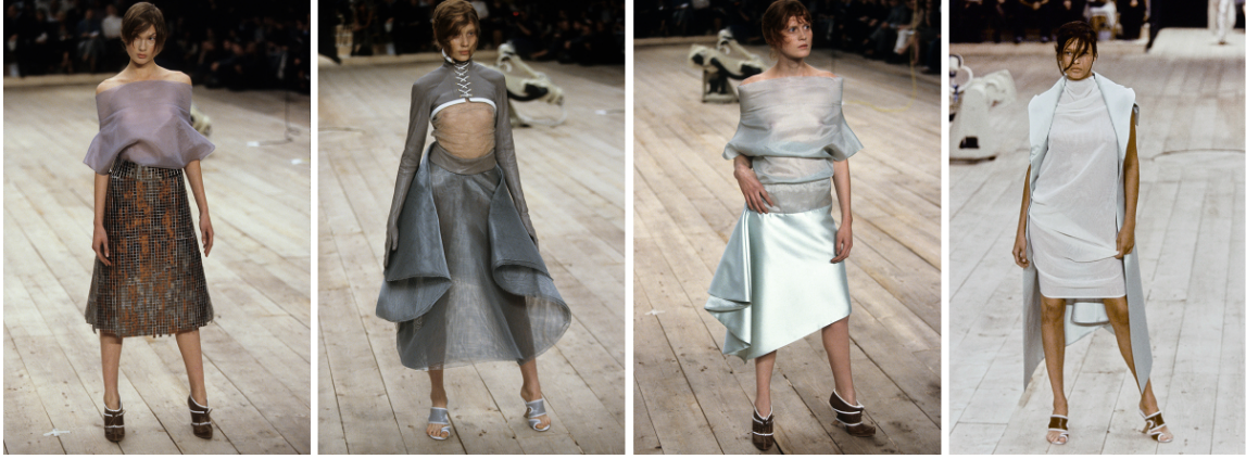
Görsel 5. McQueen. A., 1999 Spring/Summer, No.13 defilesi. Gatliff Warehouse; Londra, (URL 1).

Alexander McQueen No. 13 koleksiyonundaki tasarımlarında; sanat ve zanaatkarlık arasındaki dengeyi ustalıklarla kurarak moda dünyasında bir başyapıt olarak öne çıkmaktadır. Tasarımların eklektik yapısı, asimetrik elbiselerden yapılandırılmış takımlara uzanan çeşitli silüetlerde açıkça görülmektedir. McQueen, farklı tarzları ve referansları bir araya getirerek sınırların ötesine geçen bir yaratıcılık sergilemiştir. Kesimler, keskin çizgiler ve yumuşak drapeler arasındaki oyun ile dikkat çekerken, tasarımları geleneksel sınırların ötesine taşıyan titiz bir işçilikle ortaya konmuştur (Görsel 3). Bu karşıtlık, McQueen'in çalışmalarında sıkça görülen kaos ve kontrol arasındaki gerilime olan ilgisini vurgulamaktadır (Görsel 4).