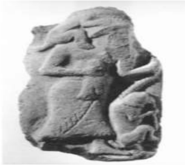
Görsel 1: Ayakta duran bir figürün önünde oturur vaziyette flüt çalan bir maymun tasviri (Akt. Spycet, 1998:6).

Sümerlerde üflelemeli çalgıların dikey ve yatay olarak birçok çeşidi bulunmaktadır. Sümer üflelemeli çalgılarının aralarında uzunlukları, perde sayıları, dilli olup olmamaları ve yapıldıkları malzeme gibi konularda birbirinden ayrıldıkları ve çalgılara verilen isimlerin de farklılaştığı anlaşılmaktadır. Sümerler döneminde kazılar sonucunda Ur kral mezarlarında kemikten, kamıştan, ağaçtan (ahşaptan), pişmiş topraktan, metalden yapılan flütler bulunmuştur. Bu flütler Dinçol (2003)'un belirttiği gibi Sümerler dönemine ait tarihi kanıtlar yoluyla günümüze gelmiştir. Konuya yönelik aşağıdaki görsel 1'de Ur kral mezarlarından çıkarılan pişmiş topraktan yapılan bir kil levha üzerinde flüt çalan maymun figürü örnek olarak verilmiştir.