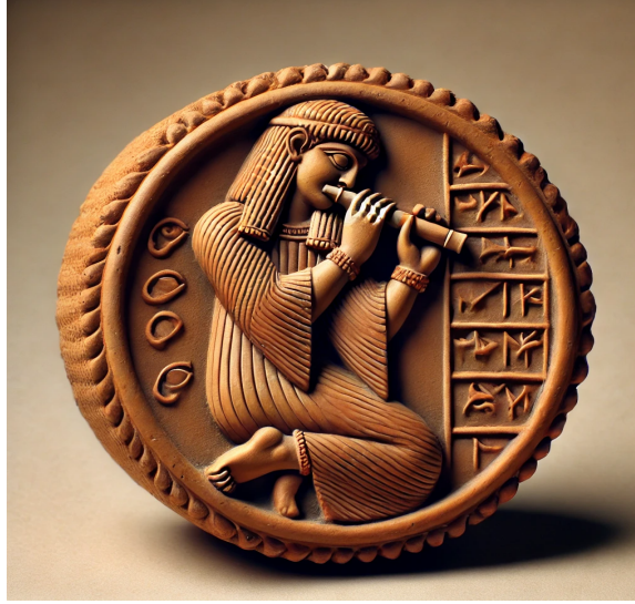
Görsel 5: Akad dönemine ait flüt çalan figürün pişmiş topraktan yapılan bir mühür çizimi görünümü