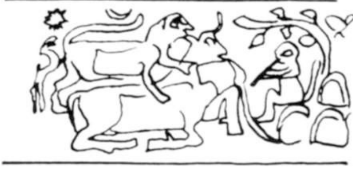
Görsel 2: Na isimli çalgının silindir mühür üzerindeki görünümü (Akt. Sünbül, 2020:284).