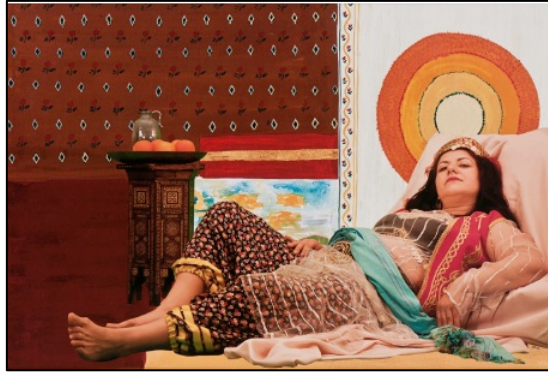
Görsel 7. Canan, Türk Lokumu Serisi V, 2011 (Şenol, 2024)

Sanatçı Canan, beden politikaları üzerine feminist yaklaşımlarıyla, mahremiyetin öne sürülmesine, eleştirel bir şekilde yaklaşmıştır. Galeri x-ist'te açmış olduğu "Türk Lokumu" adlı kişisel sergisinde, oryantalist bakış açısına cevap niteliğinde şarkı sözü yazmış ve videosunu sergide sunmuştur. Oryantalist sanatın bir eleştirisi olan videoda sanatçı aynı zamanda oryantalist tabloları eleştirel bir amaçla yeniden canlandırmıştır.