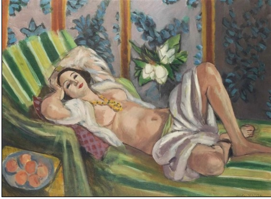
Görsel 1. Henri Matisse, Manolyalar içinde odalık, 1923

Osmanlı kadını ve harem yaşamı, Batılıların fazlasıyla ilgisini çeken konular arasında yer almaktadır. Bu nedenle doğulu yaşam tarzının da bir simgesi olarak tanımlanabilir. Bu mekânlara dışarıdan girişin olmaması ve eldeki imkanların da sınırlı olması, haremi daha da dikkat çekici hale getirirken, yabancı seyyahların, elçilerin ve orada çalışmış esirlerin yaptıkları hayali betimler Batı dünyasında, "gerçek" yerine konarak algılanmıştır. Osmanlı Devleti'nin, birçok bakımdan üstün olduğu yükselme devri ve sonrasında, Osmanlı hükümdarının ikametgâhı ve özel hayatı da mercek altına alınmıştır. Bu konuda, özellikle yabancı seyyahlar tarafından ellerinde belgeleyici bir kanıt olmamasına rağmen rivayete dayalı tasvirler ortaya konmuştur (Göncü, 2015: 21).