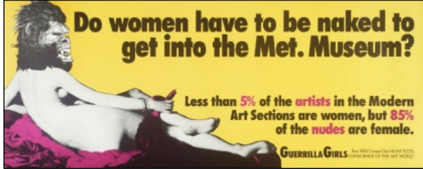
Görsel 4. Guerrilla Girls, Kadınlar Metropolitan Müzesi'ne Girmek İçin İllaki Çıplak mı Olmalı? 1989 (Collections, 2024)

İstanbul'un Doğu'su ile olan "yönlenme" ilişkisi kurulmamıştır. Batı-dışı'nın yine Batı tarafından tescil edilmiş olanla gösterilmesinin artık kimsenin yaşamak istemediği bir paradoks olduğunu Block'un anlamasını isterdik. Bunun dışında, bir yenilik olarak ileri sürüldüğü gibi, batılı ünlü sanatçılarla Batı-dışı ünsüzleri yan yana sergilemiş olmak bir yenilik değil, 3-5 yıldır Batı merkezlerinde uygulanan post-oryantalist bir gerekliliktir (Madra, 2013: 86-87).