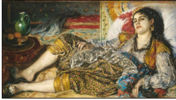
Görsel 6. Pierre Auguste Renoir, Odalık, 1870 (Wikiart, 2024)

İnci Eviner Harem adlı videosunda III. Selim'in saray mimarı Melling'in, Paris'te baskısı yapılmış "Voyage Pittoresque De Constantinople Et Des Rives Du Bosphore" albümünde yer almış Harem gravürünü ele almıştır. Gravürde yer alan figürlerin oryantalist bir şekilde konumlandırılması, Eviner'in bu figürleri hareket ettirme isteğini sağlamıştır. Buradaki figürleri hareket ettirerek bir çeşit isyanı temsil etmektedir. Ötekinin mekânı olan harem, tam da oryantalizmin yarattığı ve içinde barındırdığı mistik, egzotik havasında oluşan merakın dışavurumudur.