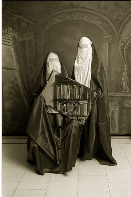
Görsel 2. Shadi Ghadirian, "Qajar" serisinden, 2001, siyah beyaz fotoğraf (Oneart, 2024)

Erengöz Kafkas (2008: 27) yeni oryantalist olarak çalışan üç grup tanımlamaktadır. İlk grup, genellikle ticari amaçlı çalışmalar yapan ve ortamın üzeri bir gelire sahip, sanat alıcısı konumundaki kişilere yönelik iş üretebilen bir grup ressamı kapsar. Bu ressamlar Doğu'ya özgü biçimsel, egzotik öğeleri resimlerinde kullanmaktadırlar. İkinci grup ise, genelde ailesi Doğu kökenli olup fakat Batı'da yaşamakta olan ya da memleketlerinden belirli bir yaşta ayrılmış olan kişilerdir. İçe seltirmedikleri yabancı oldukları coğrafyayı anlamaya çalışmazlar. Üçüncü grup yeni oryantalistler ise doğdukları ülkede yaşamaya devam eden fakat yaşadıkları coğrafyadan kendilerini soyutlamış kişilerdir.