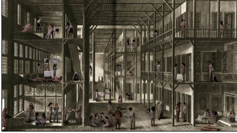
Görsel 5. İnci Eviner, Harem, Video, 2009 (Eviner, 2024)

İnci Eviner Harem adlı videosunda III. Selim'in saray mimarı Melling'in, Paris'te baskısı yapılmış "Voyage Pittoresque De Constantinople Et Des Rives Du Bosphore" albümünde yer almış Harem gravürünü ele almıştır. Gravürde yer alan figürlerin oryantalist bir şekilde konumlandırılması, Eviner'in bu figürleri hareket ettirme isteğini sağlamıştır. Buradaki figürleri hareket ettirerek bir çeşit isyanı temsil etmektedir. Ötekinin mekânı olan harem, tam da oryantalizmin yarattığı ve içinde barındırdığı mistik, egzotik havasında oluşan merakın dışavurumudur.