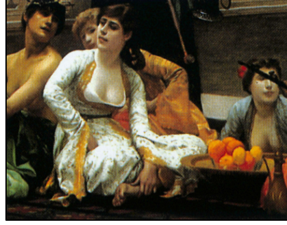
Görsel 3. Gülsün Karamustafa, Dışarıdan, 1999 (Salt Araştırma, 2024a)

Yardımcı (2014: 77) İstanbul festivallerinde kurulan Doğu-Batı ayrımının da oryantalist ikiliği tekrar etmekte olduğunu belirtir. Festivaller kadar İstanbul bienalleri de Doğu-Batı ikiliğini çeşitli biçimlerde yeniden üretir. İstanbul Çağdaş Sanat Sergileri adıyla düzenlenen ilk Bienal, Tarihsel Mekânda Çağdaş Sanat temasıyla kentten Doğulu tarihinden devraldığı miras ile filizlenmeye başlanmış olan Batılı bir sanat ortamı arasında köprü oluşturduğu mesajını vermektedir. İkinci bienal için de benzer şekilde, Geleneksel Çevrede Çağdaş Sanat teması kullanılmıştır. Madra ise, 4. Uluslararası İstanbul Bienali küratörü Rene Block'un, Batı'dışı ülkelerde araştırma yapmış olmasına rağmen yeni sanatçıları bulmamış ve Batı'da hazır olanı getirmiş olmasını eleştirmektedir. Bu bağlamda;