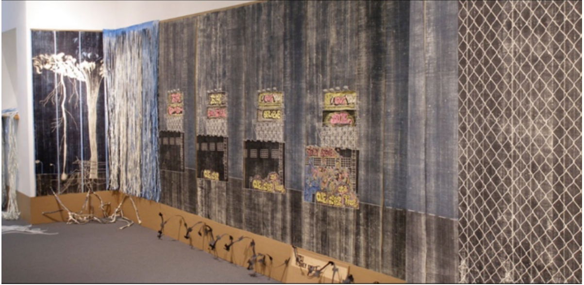
Görsel 3. Libby Hague, "Her Seferinde Bir Adım", 2009 ( http://www.libbyhague.com/step.html )

İzleyicilerin, enstalasyonun içinde, etrafında dolaşırken değişik perspektif ve açılardan farklı görüntülerle karşılaşması algı ve deneyimlerinin zenginleşmesine katkı sağlamaktadır. Sanatçının karakteristik sanatını ortaya çıkartan, tüketim kültürüne ve doğaya karşı sorumsuzluklara tepkisinin yanısıra, umut aşıl原因 toplumsal birliktelik ve ortak ideallere tutunma mesajları içeren çok katmanlı baskiresimleridir. Enstalasyonun orta alanında yer alan, tüm duvarları kaplayan büyük, siyah beyaz tahta baskılar kontrast yaratmaktadır. Hague kontrast yaratan büyük zemin baskılarına eklediği jiletli teller, tel örgüler, buruşturulmuş gri kağıt bulutlarla betimlenmiş yağmur fırtınaları ile güvencesizliğin gerilimini artırarak izleyiciyi distopik kent ortamına dahil etmektedir.