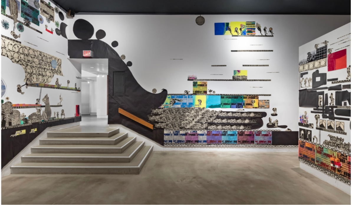
Görsel 7. Libby Hague, "Her Kalp Biraz Daha Büyüyebilir", 2019 ( http://www.libbyhague.com/step.html )

Farklı parçalarla oluşturduğu çok katmanlı baskı enstalasyonları her parçada bütünü çağrıştıran ve destekleyen görsel bir yapı inşa eder. İzleyici de ortak veya bireysel yaşam deneyimlerinden gelen algı farklılıklarıyla bu bütünün bir parçasıdır.