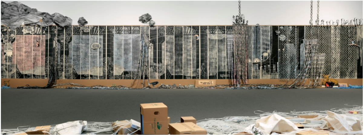
Görsel 4. Libby Hague, "Her Seferinde Bir Adım", 2009 ( http://www.libbyhague.com/step.html )

İzleyicilerin, enstalasyonun içinde, etrafında dolaşırken değişik perspektif ve açılardan farklı görüntülerle karşılaşması algı ve deneyimlerinin zenginleşmesine katkı sağlamaktadır. Sanatçının karakteristik sanatını ortaya çıkartan, tüketim kültürüne ve doğaya karşı sorumsuzluklara tepkisinin yanısıra, umut aşıl原因 toplumsal birliktelik ve ortak ideallere tutunma mesajları içeren çok katmanlı baskiresimleridir. Enstalasyonun orta alanında yer alan, tüm duvarları kaplayan büyük, siyah beyaz tahta baskılar kontrast yaratmaktadır. Hague kontrast yaratan büyük zemin baskılarına eklediği jiletli teller, tel örgüler, buruşturulmuş gri kağıt bulutlarla betimlenmiş yağmur fırtınaları ile güvencesizliğin gerilimini artırarak izleyiciyi distopik kent ortamına dahil etmektedir.