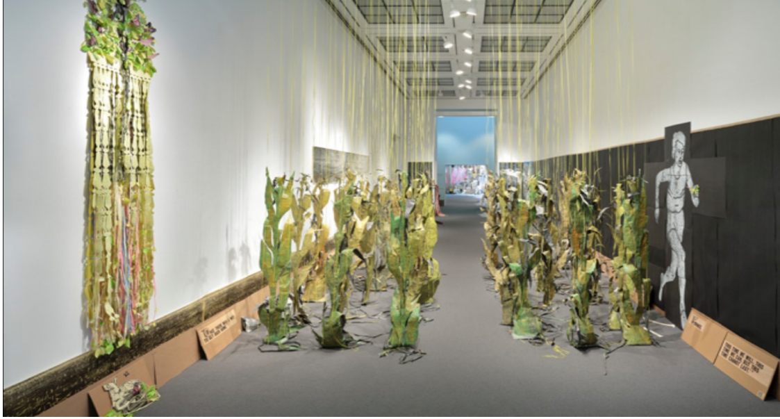
Görsel 2. Libby Hague, “Her Seferinde Bir Adım”, 2009 ( http://www.libbyhague.com/step.html )

Görsel 2’de, yani galerinin ilk salonunda tavandan sarı kurdelalar ile sarkıtılmış tahta baskı mısırlarla oluşturulan bir koridor ve mısırların arkasında yer alan siyah renkle kaplanan duvarda koşan bir kadın figürü yer alıyor. Kadın elinde, kurtardığı küçük bir fare tutuyor, bu küçük eylemin tüm farkı yarattığı, dengeyi insanlığın lehine çevirdiği ve insanlığa bir şans daha verildiği fikrini taşıyor. Mısırların ayakta durmasını sağlayan sarı renk kurdelalar, güneş ışığını temsil etmesi yanında, günlük hayatta kadınların kullandığı bir malzeme olduğu için, Hague’ın feminist yaklaşımları bağlamında, doğayı korumada kadınların emekleri, besin sağlama çabaları ve üretkenlikleri ile de ilişkilendirmek mümkündür.