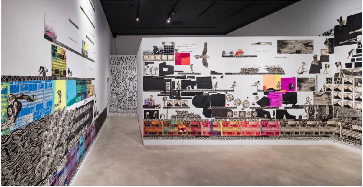
Görsel 6. Libby Hague, "Her Kalp Biraz Daha Büyüyebilir", 2019 ( http://www.libbyhague.com/step.html )

Aynı kalıpları, duvar düzenlemeleri ve diğer disiplinlerle ilişkilendirerek tekrar tekrar kullanan başka bir sanatçı Libby Hague'dır. Hague'de, kalıp tekrar vurgusunu geometrik bantlar ile belirgin bir şekilde görünür kılmırken kendine özgü bir anlatı önceliğini önemseydiğini görürüz. Özellikle çizim, baskı, heykel yerleştirme ve video gibi anlayış, üslup ve dil olarak da melez bir karakterden hareket etmesi, ele aldığı gündelik yaşamın kaotik yapısını hem görünür kılar, hem onu aşmaya yönelik metaforik anlam katmanları oluşturmada katkı sağlar. Dünyada nasıl iyi olabiliriz diye sordurarak, izleyiciyi özeleştiriyeye ve hayatımız üzerinde düşünmeye davet eder. (Esmer, 2020: 430,431)