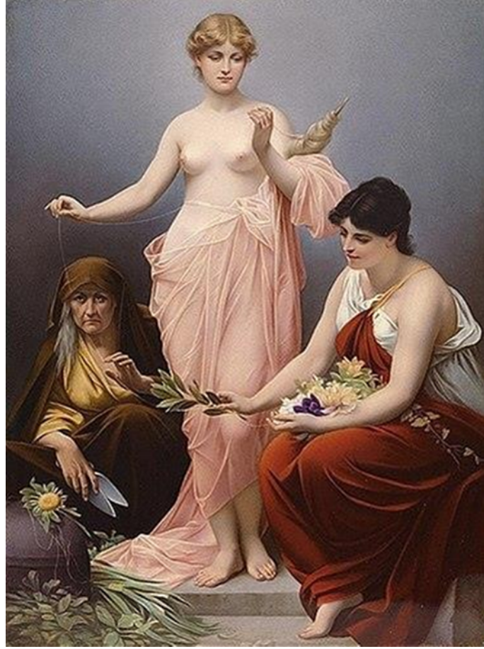
Resim 6: Paul Thumann, Üç Kader, 1880