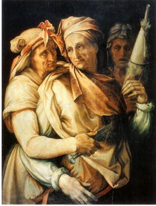
Resim 3: Les Fates (Kaderler), Francesco de' Rossi (Francesco Salviati), 1550, Florence.