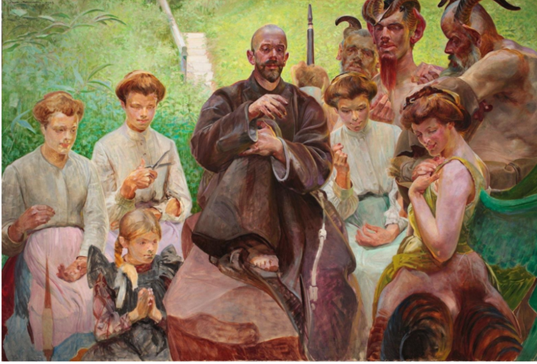
Resim 7: Jacek Malczewski, Assisi'li Aziz Francis, 1908, Varşova'daki Ulusal Müze, Polonya

ikisinden biraz daha koyu bir ten tonunda, kafasında ve ellerinde birçok kırışıkla tasvir edildiğini görebilmekteyiz. Saçları dağınık ve gri ve yüzünde acı bir ifade vardır. Aynı zamanda Atropos'un ayaklarının dibinde ölmekte olan yapraklarla makas taşırken tasvir edilmesi yaşamın sonu anlatımını iki kat kuvvetlendirmektedir. Yüz ifadesine bakıldığında ise bu duruma kendisine zarar veren ve kendini sunma şeklini etkileyen görevin neden olduğunu anlayabilmek zor değildir. Bu, onun görevinin getirdiği yükün ve bu yükün onun kişiliği üzerindeki etkisinin bir göstergesi olarak yorumlanabilir.