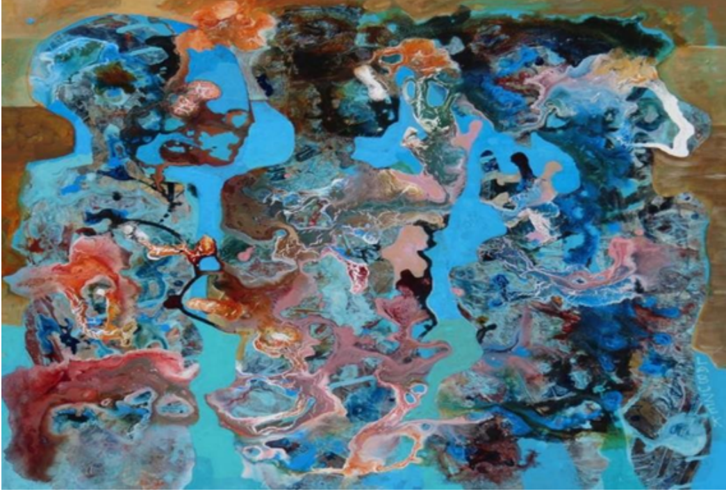
Resim 9: Dariusz Labuzek, Üç Moira Boyama, 2018, ABD.

gerçekliğin perdelemesiyle ifade eder. Bu esere odaklanıldığında izleyici tarafından fark edilen ilk durum Atropos'un makasının elinde olmayışıdır. Bu durum pek çok kaynakta sanatçı tarafından Kraliçe'nin (göreceli) ölümsüzlüğünü ima ettiğini vurgulamaya çalıştığı söylenmektedir. "Eserde Moiralar'ın yapmış oldukları görev ve sorumluluklar bu sefer Juno ve Jüpiter içindir. Juno, eser içerisinde Kraliçe'nin avatari ve Jüpiter ise Kral olarak görünmektedir. Jüpiter'in karışıklığı göz önüne alındığında, bu, kraliyet ilişkisine dair derin bir kavrayışa işaret etmiş olabilmektedir" (Sanal-3). Figürlerin yüz ifadeleri, jestleri ve duruşları, resmin duygusal etkisini güçlendirmektedir. Maria'nın ifadesi belki de hükümdarlığındaki zorlukları veya zaferleri yansıtırken diğer figürlerin ifadeleri ve duruşları da resmin atmosferini ve hikayesini derinleştirmektedir.