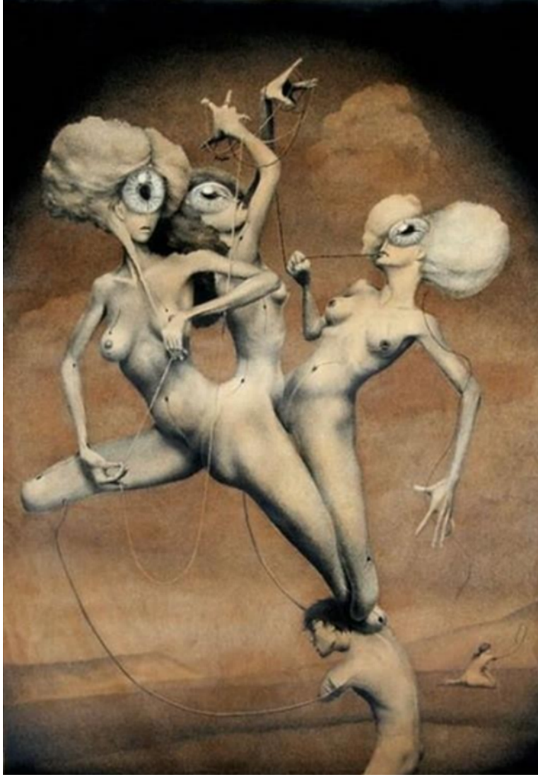
Resim 10: Dmitry Vorsin, Moirai, 2008, Rusya

Moirai isimli eser (Resim 10) 2008 yılında Sürrealist Rus sanatçı Dmitry Vorsin (1980) tarafından mürekkepli çay kartonu üzerine yapılmıştır. Moira'ların geleneksel yapıtlarının çok farklı versiyonu gibi görünen bu çalışma, figürlere ilk bakıldığında andan itibaren kader tanrıçalarının olduğu izlenimini vermektedir. Dmitry Vorsin, mistik erotik karakterlerini oluştururken yaşadığı gerçeküstü dünyalardan faydalanmaktadır. Salvador Dali'den ilham alan sanatçının bu çalışmasında da olduğu gibi figürler genellikle uzundur ve uzuvları kesiktir. "Vorsin'in resimlerinde, Batı sanatının tarihini yüzyıllardır meşgul eden konular ayırt edilebilir: idealize edilmiş bir biçim arayışı; bilim ve din arasındaki bağlantı, sanatçı, konu ve izleyici arasındaki zor oyun gibi görünmektedir" (Sanal -5). Resim incelendiğinde tanrıçalar bir figürün sırtından yukarı doğru hareketle uzanmaktadır. Figürlerin çarpık ve gerçek formun dışında oluşu, alınlıklarında bulunan büyük tek gözleri izleyiciyi fantastik bir kurgunun içerisine çekmektedir. Ancak Moira'ların yapmış olduğu görevlerin burada tam olarak resimlenmemiş olması "Üç Tanrıça"nın isimlerini belirlememize engel olmaktadır. Daha detaylı incelendiğinde ise soldaki figür Lachesis, hayatın akışını belirleyen ipliği ölçerken; ortada yer alan Clotho, sırtından yükselen erkek ve uzak mekânda duran kadın figürünün kaderini eğirmekte; Atropos ise, klasik tasvirlerinin dışında dişleriyle ipliği kesmek üzere resmedilmiştir.