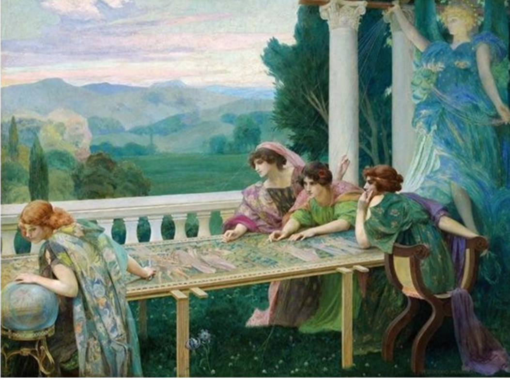
Resim 2: Henry Siddons Mowbray, Destiny (Kader) , 1896, Güzel Sanatlar Müzesi, Boston, MA