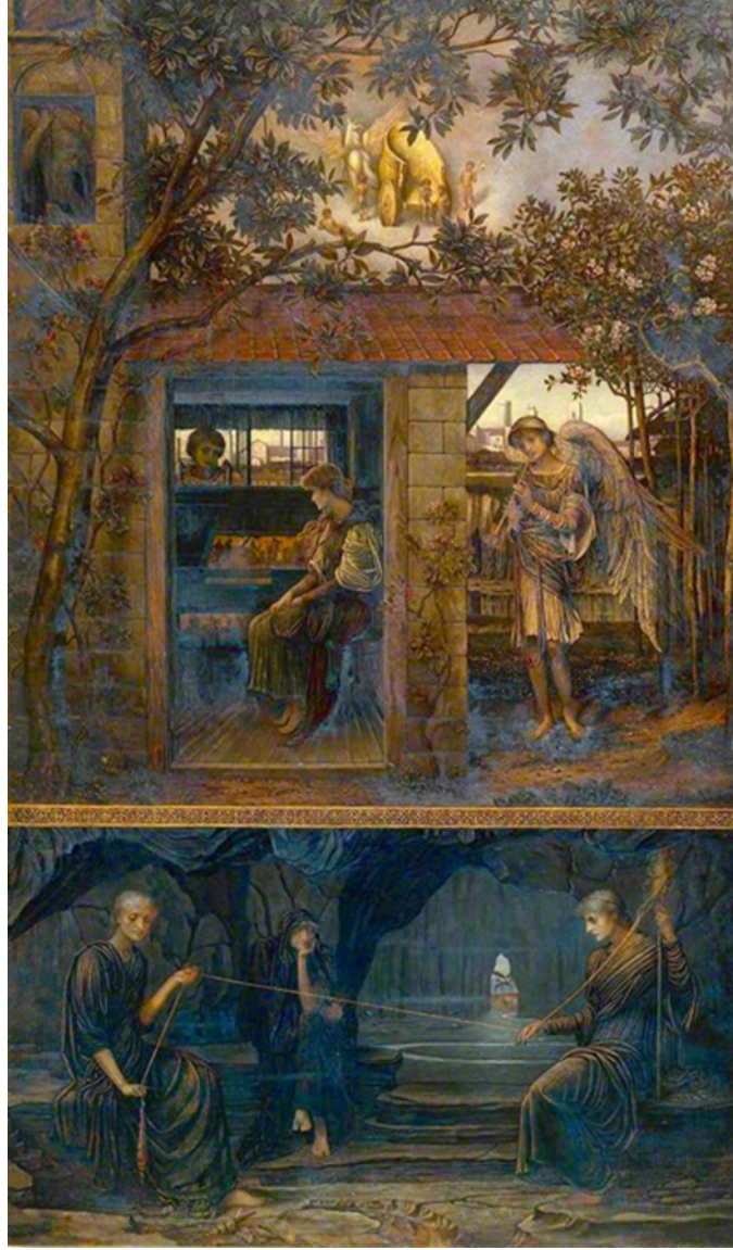
Resim 4: Les Moires (Altın İplik), John Melhuish Strudwick, 1885, Tate Gallery, Londra

özelliklerini yansıtan bir eserdir. Pre-Raphaelite kardeşliği, 1848'de Londra'da kurulan ve Raphael'in Rönesans dönemi sanatına karşı çıkan genç sanatçılar ve bir yazar tarafından oluşturulan gizli bir topluluktur. Bu grup, dönemin popüler tür resimlerinin yüzeyselliğine karşı çıkarak, doğaya dönüşü ve azami gerçekçilikle işlenen ciddi konuları savunmuştur.