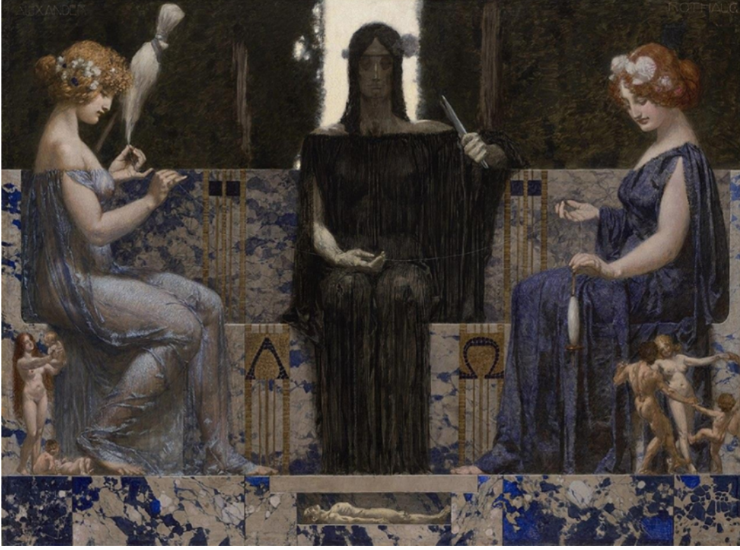
Resim 5: Alexander Rothaug, Die drei Parzen (Üç Kader), 1910

Bu tasvir, önceki dönemlerde yapılan çalışmalardan farklı olarak, ölüm kararının verilmesi ve ipin kesilmesi sahnesinden uzak bir anı yakalamaktadır. Mekânsal anlamda resim iki eşit parçaya bölünmüştür. Çiftin bulunduğu mekân çiftin haricinde pek çok figürlerle doludur ve mekânın derinliği bu figürler sayesinde oluşmaktadır. Alt kısımda ise Moira'lar görevlerini yaparken üst kısımda var olan mekânın aksine daha soğuk bir mekân bulunmaktadır. Mekâna derinlik veren ve yaşama açılan küçük bir alanın verdiği ışık ise altın renkli ipin belirginliğini daha da ön plana çıkarmaktadır.