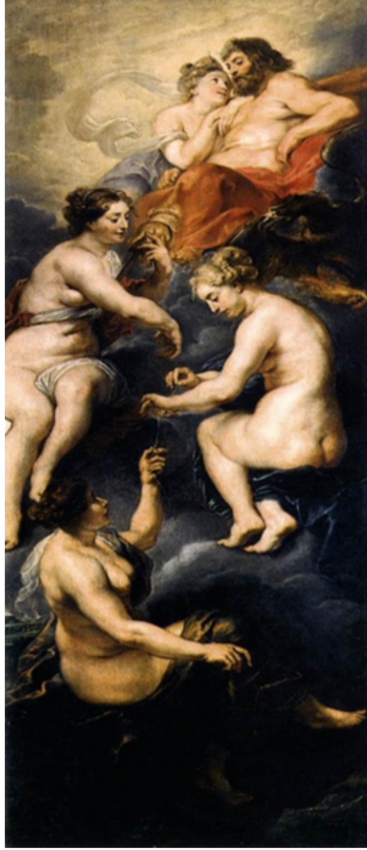
Resim 8: Peter Paul Rubens, Marie'nin Kaderini Döndüren Kaderler, 1622-1625, Louvre Müzesi, Paris, Fransa