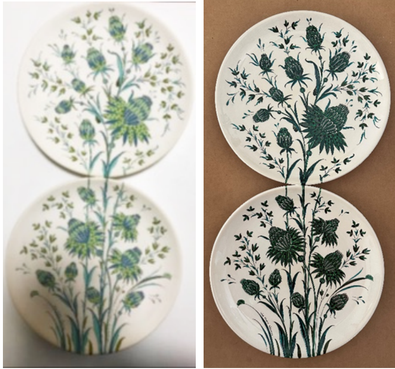
Şekil 4. Uygulama 1 (Çiçek)