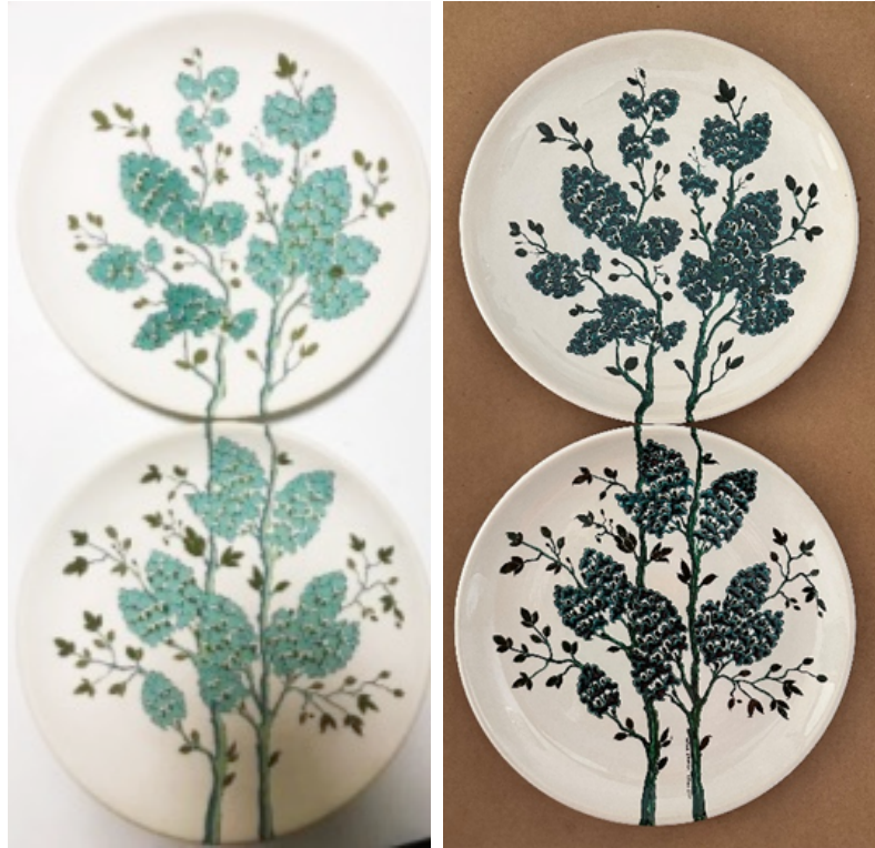
Şekil 6. Uygulama 2 (Leylak)