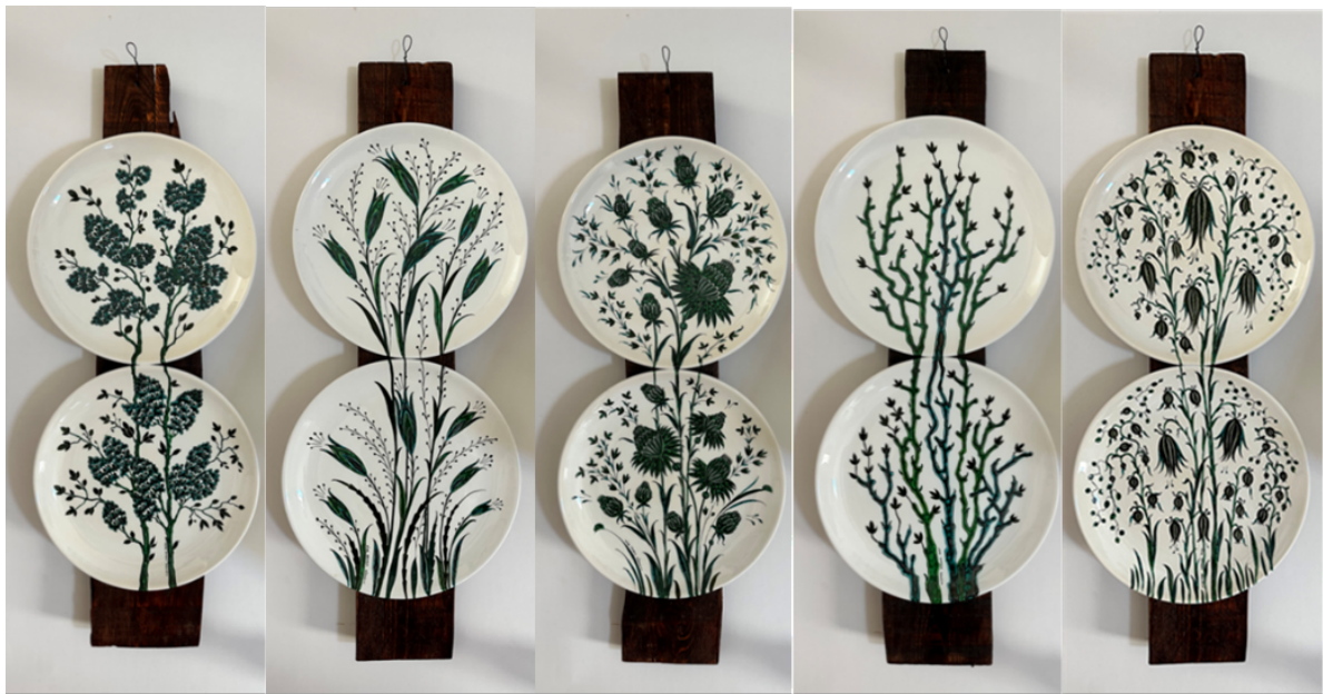
Şekil 16. Çini tabakların ahşaplar üzerine asılarak sergilenmeye hazır görüntüleri

Seçilen tasarıma göre on adet çini tabağın sergilenmesi; bulunan ahşapların üzerine, tabakların ikili olarak asılmasıyla gerçekleştirilmiştir. Çini tabakların ikili olarak sergilenmesi neticesinde yapılan eserin ebadı 30x60cm olmuştur. Farklı ebatlarda ve farklı renkte bulunan ahşapların (Şekil 15) istenilen ebat ve renge getirilmesi için ahşaplar üzerinde ayrıntılı çalışma yapılmıştır. Bulunan ahşaplar içinden, istenilen form ve kalınlıkta olan, beş adet ahşap belirlenmiştir. Belirlenen beş farklı ahşabın; eni, 10-15cm, boyu 80cm olacak şekilde ayarlanmış olup yüzeylerine istenilen ağaç renginde ahşap koruyucu verniği uygulanmıştır. Hazırlanan ahşaplar üzerine çini tabakların asılmasıyla eserler sergilenmeye hazır hale getirilmiştir (Şekil 16). Çini eserlerin ahşaplar üzerinde sergilenmesi yapılan çalışmaya özgünlük ve farklılık kazandırmıştır. Ahşap renginin koyu renk tercih edilmesiyle çini eserler ön plana çıkarılmıştır. Ayrıca kullanılan ahşaplar çini eserlere çerçeve niteliği kazandırarak sergilenmelerini kolaylaştırmaktadır. Çini ve ahşap malzemelerle hazırlanmış olan bu tasarım farklı malzemelerin uyum içinde kullanılabileceğini de gösteren örnek bir çalışma oluşturmaktadır.