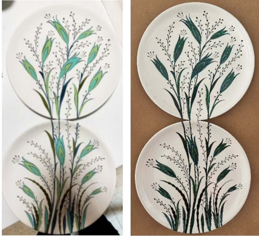
Şekil 8. Uygulama 3 (Lale)