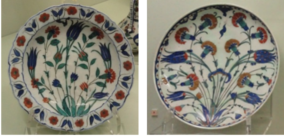
Şekil 1. 16.y.y, İznik çini, tabak, Çinili Köşk, İstanbul