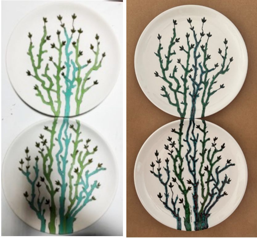
Şekil 12. Uygulama 5 (Kaktüs)