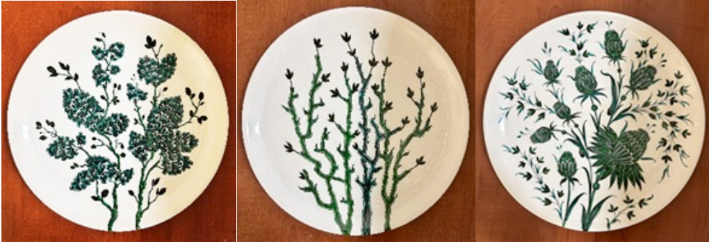
Şekil 3. Çini tabakların tekli olarak sergilenme görselleri

Yapılan tasarıma göre çini tabakların ikili olarak sergilenmeleri de (Şekil 4-13) görülmektedir. 30cmx30cm ebatlarında olan çini tabaklar, bitki ve çiçek motiflerinin stilize edilmesi ile uygulanmış çalışmalardır. Sır altı boyama tekniği ile tezyin edilmişlerdir. Desenleme işlemi tamamlanan tabakların yüzeyi şeffaf sırla kaplanarak 960 derecede fırınlanmışlardır. Tabakların altlı üstlü yerleştirilmesiyle tabaklar ve yüzeylerine yapılan tasarım bütünleşmekte, eser ebadı 30cmx60cm olmaktadır.