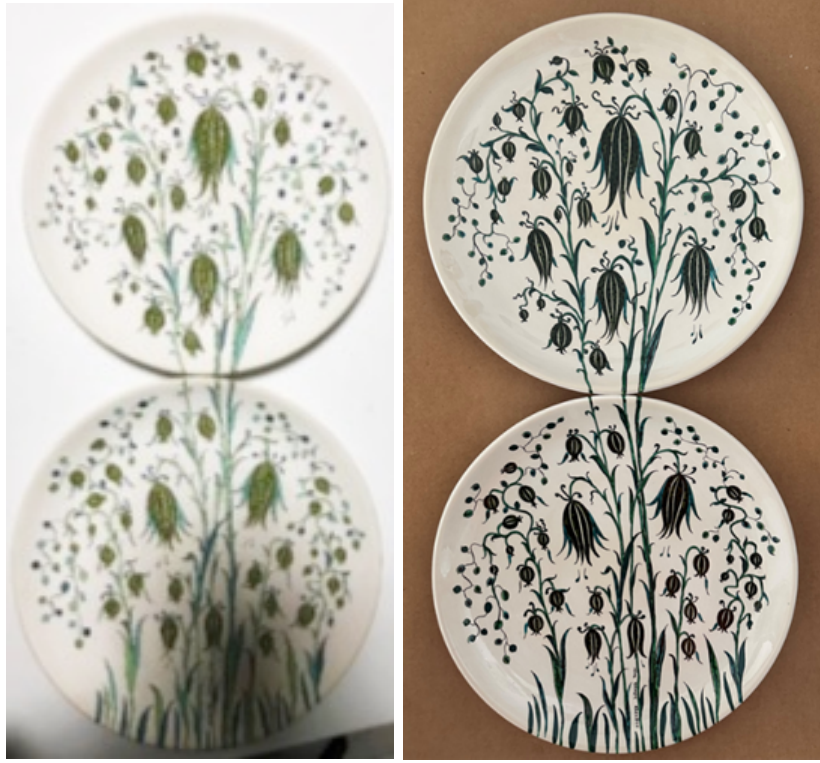
Şekil 10. Uygulama 4 (Ters lale)