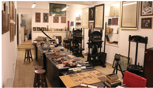
Görsel 7: Danarto dkk, 2022, Üretim Süreci ( www.artdogistanbul.com )

Hikâye Anlatımı: Bienaller, sanatçılar ve izleyiciler arasında doğrudan etkileşimi teşvik eden bir platform sunar. Yerleştirme sanatı, izleyicileri eserin bir parçası yaparak etkileşim kurmalarını sağlar. Sanatçılar, izleyicilere eserin oluşturulma sürecine ve mekânsal tasarımın arkasındaki düşüncelere dair iç görüler sunabilir. Mekânsal kurgu, bir mekânın bir tür hikâye anlatım aracı olarak kullanılmasını içerir. Özellikle sahne tasarımında veya sergi mekânlarında, mekânsal düzenlemeler izleyiciye belirli bir hikâyeyi anlatma veya bir duygu durumunu iletimi için kullanılabilir.