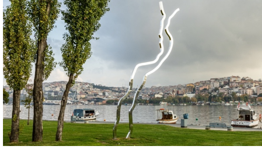
Görsel 2: Ayşe Erkmen, Haliç Haliç'te, 2022 (www.iksv.com).

Düzen ve Kompozisyon: Bienaller genellikle belirli bir tema veya konsept etrafında şekillenir. Yerleştirme sanatı, bu temaları ifade etmek ve belirli bir sosyal veya kültürel mesajı aktarmak için güçlü bir araç olarak kullanılabilir. Mekânsal düzenlemeler ve objelerin yerleştirilmesi, izleyicilere belirli bir düşünsel deneyim sunabilir. Mekânsal kurgu, bir mekânın düzenlenme biçimini ve öğelerin birbirleriyle olan ilişkilerini içerir. Estetik bir bütünlük ve kullanılabilirlik sağlamak için mekânsal öğelerin nasıl bir araya getirileceği düşünülür. Sanatçılar, seçtikleri mekânın özelliklerini dikkatlice değerlendirir ve eserlerini o mekâna özgü bir biçimde tasarlarlar. Mekânsal bilinç, sanat eserinin mekânla etkileşimini vurgular.