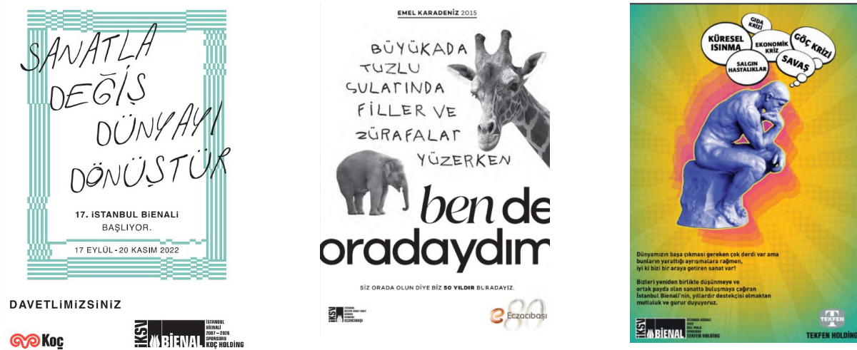
Görsel 1: https://bienal.iksv.org/

Bienal, sanat eserlerini sergilemek, sanatçıları bir araya getirmek ve kültürel alışverişi teşvik etmek amacıyla düzenlenen uluslararası bir etkinliktir. Bienal duyurularında ve destekçi kurumların posterlerinde ziyaretçilere alışıl gelmişin dışında bienal kurgusunu anlatmaktadır (Görsel 1). Afişlerin tipografik kurgusunda, iletişimde kullanılan yazılı ifadenin düzenlenmesini ve estetik unsurlarını görürken, karşımıza çok disiplinli ve çok kültürlü bir profil çıkmaktadır. Bienaller sanat dünyasındaki çeşitli disiplinlerden sanatçıları ve eserleri bir araya getirerek kültürel alışverişi teşvik eder. Hem bienal hem de tipografi kültür, estetik ve yaratıcılıkla ilgili önemli konulardır. Aşağıdaki örneklerde bienal konusuna dikkat çekmek için yapılmış afişlerden örnekler görülmektedir. Bienalin soru soran, merak eden ve yaşanan sorunları masaya yatıran bir organizasyon olduğu ve bu bağlamda pek çok alandan katılımıyı kucaklamaya çalıştığı görülmekte ve pek çok kuruluş organizasyonu desteklemektedir.