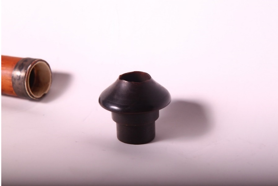
Şekil 3: Mevlâna Müzesinde bulunan 1174 numaralı neye ait başpâre.

Görselde, 1954 yılında Neyzen Şevki Sevgin tarafından Mevlâna Müzesine bağışlanmış, Neyzen Aziz Dede'ye 2 ait olan mansur ahenkli neyin (müze dokümanları içinde 1174 numara ile kayda alınmıştır) başpâresi görülmektedir (Tan, 2011: 94).