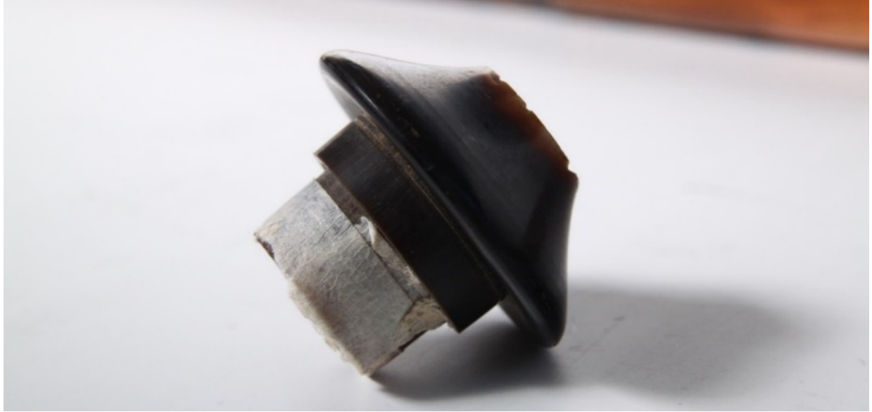
Şekil 9: Topkapı Sarayı Müzesinde bulunan 2/3376 numaralı neye ait başpâre.

Görselde, Topkapı Sarayında 8 bulunan bir mansur ahenkli neyin (müze dokümanları içinde 2/3376 numara ile kayda alınmıştır) başpâresi görülmektedir. Kime ait olduğu bilinmeyen bu neyin kamışının rengi müzedeki daha eski neyler kadar koyulaşmamıştır. Bu durum neticesinde neyin 1900 yılı başlarında açıldığı düşünülebilir (Tan, 2011: 31).