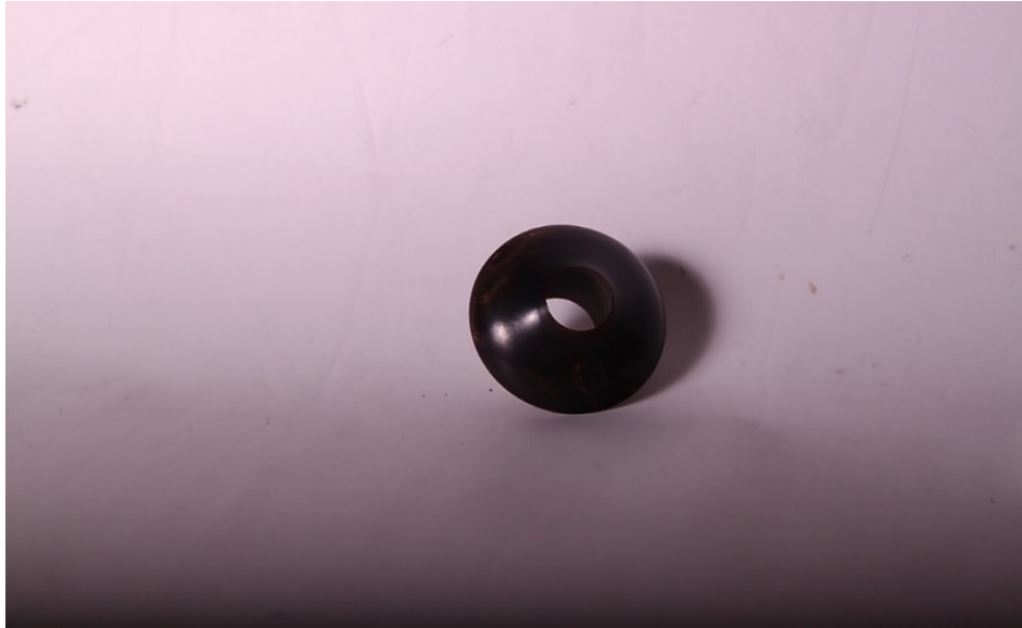
Şekil 5: Mevlâna Müzesinde bulunan 1331 numaralı neye ait başpâre.

Görselde, 1968 yılında Neyzen Şevki Sevgin tarafından Mevlâna Müzesine bağışlanmış, Neyzen Salim Bey'e 4 (1829-1894) ait olan mansur ahenkli neyin (müze dokümanları içinde 1331 numara ile kayda alınmıştır) başpâresi görülmektedir (Tan, 2011: 117).