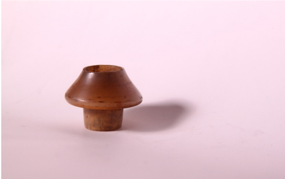
Şekil 6: Mevlâna Müzesinde bulunan 1332 numaralı neye ait başpâre.

Görselde, 1958 yılında Neyzen Şevki Sevgin tarafından Mevlâna Müzesine bağışlanmış, Neyzen İhsan Bey'e 5 (1884-1935) ait olan davut nısfıye ahenkli neyin (müze dokümanları içinde 1332 numara ile kayda alınmıştır) başpâresi görülmektedir (Tan, 2011: 118).