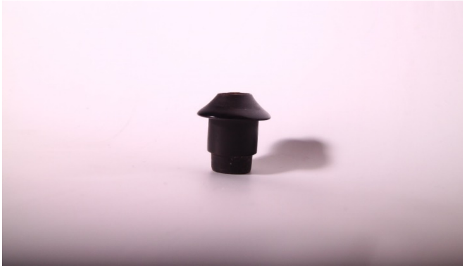
Şekil 2: Mevlâna Müzesinde bulunan 378 numaralı neye ait başpâre.

Görselde, 1949 yılında Neyzen Burhanettin Ökte tarafından Mevlâna Müzesine 1 bağışlanmış olan şah ahenkli neyin (müze dokümanları içinde 378 numara ile kayda alınmıştır) başpâresi görülmektedir (Tan, 2011: 80).