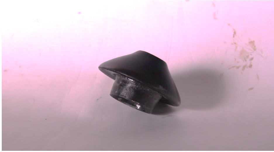
Şekil 7: Mevlâna Müzesinde bulunan 1431 numaralı neye ait başpâre.

Görselde, 1961 yılında Abdülmucib Parer tarafından Mevlâna Müzesine bağışlanmış, babası Yenikapı Mevlevihanesi muhiblerinden Raşid Efendi'ye 6 ait olan mansur ahenkli neyin (müze dokümanları içinde 1431 numara ile kayda alınmıştır) başpâresi görülmektedir (Tan, 2011: 123).