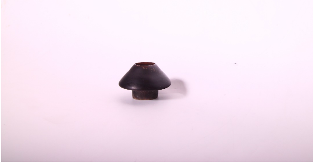
Şekil 8: Mevlâna Müzesinde bulunan 1539 numaralı neye ait başpâre.

Görselde, 1972 yılında Neyzen Selami Bertuğ tarafından Mevlâna Müzesine bağışlanmış, hocası Neyzen Şevki Sevgin'in 7 koleksiyonuna ait olan şah ahenkli neyin (müze dokümanları içinde 1539 numara ile kayda alınmıştır) başpâresi görülmektedir (Tan, 2011: 130).