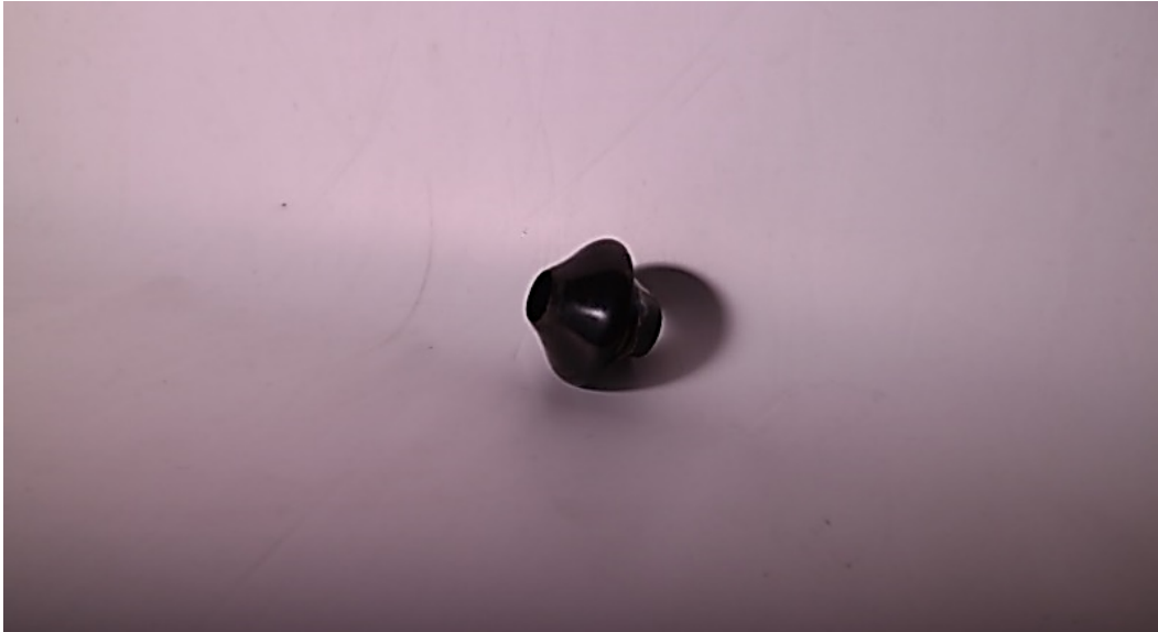
Şekil 41: Mevlâna Müzesinde bulunan 1258 numaralı neye ait başpâre.

Görselde, 1957 yılında Neyzen Halil Can tarafından Mevlâna Müzesine bağışlanmış, Neyzen Emin Dede'ye 3 ait olan şah ahenkli neyin (müze dokümanları içinde 1258 numara ile kayda alınmıştır) başpâresi görülmektedir (Tan, 2011: 115).