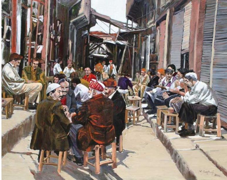
Resim-1: Mehmet Başbuğ, "Muş'ta Kahvehane, 100x150cm, tüyb, 2006

Anadolu kültüründen bir kareyi betimlediği "Muş'ta Kahvehane" isimli çalışmasına bakıldığında Anadolu'nun gündelik yaşamının tüm gerçekliğiyle yansıdığı görülmektedir. Resme baktığımızda kedimizi bir anda o dar sokakta oturan insanların arasında buluveririz. Ön plandaki figürler önemli bir konuyu görüşüyorlarmış gibi hissettiren geri plandaki figürler kendi hallerinde günlük sohbetlerini ediyorlarmış görüntüsü vermektedir. Eserde, güçlü bir gözlem yeteneğine sahip olan Başbuğ, doğup büyüdüğü bölge insanının yüz ifadelerini, kıyafetlerini ve sokağı, detaylarına da sadık kalarak büyük bir titizlikle resimlemiştir.