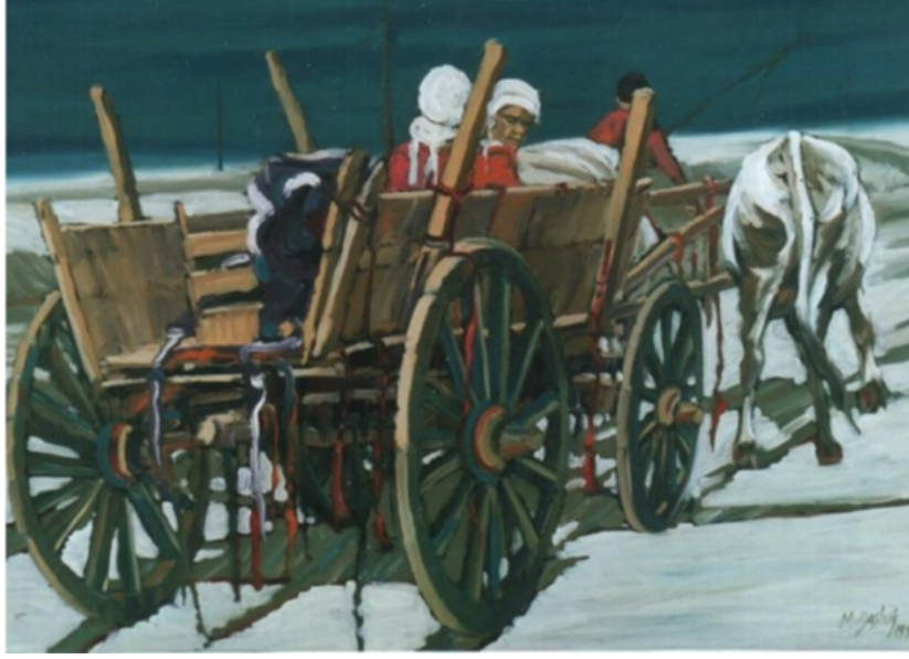
Resim 2: Mehmet Başbuğ, Göç, 80x100 cm, tüyb, 1990

Başbuğ'un eserlerinde gerçeklikle anlattığı bir diğer konu da Türk ulusunun vermiş olduğu İstiklal mücadelesidir. Kurtuluş savaşıyla, bitmeyen tükenmeyen acılar çekmiş milletin duyguları, kadın ve çocuk figürlerinin yüzlerine yansımıştır. Bu yansıma, koyu karanlık bir atmosfer içerisinde, ufka doğru ilerleyen kağnılar, yorgunluktan bitap düşmüş Mehmetçiklerin omuzlarındaki tüfeklerde bile görülmektedir (Şirin, 2020: 969). Başbuğ Milli mücadeleyi tüm gerçekliğiyle izleyiciye sunmaktadır. Öyle ki Erol (2020), sanatçıyı Kurtuluş Savaşının ve bağımsızlık mücadelesinin, Kuvayı Milliye ruhunu devam ettirmeyi hedefleyen, günümüz kuşağının 21. yüzyıldaki temsilcilerinden olarak görmektedir. Başbuğ'un eserlerinde Mehmetçiklerin teşkilatlandırıldığı, yoksulluktan bitap düşmüş halkın her şeylerini ortaya koyarak ve ya istiklal ya ölüm diyerek topyekûn cephenin yolunu tutmaları sanatçının kompozisyonlarının ana temasını oluşturmaktadır. Sanatçı kurtuluş savaşı temalı çalışmalarında o dönem halkının yaşadıkları duyguları, zorlukları, mücadeleleri gerçekçi bir tavırla gözler önüne sermektedir (akt. Şirin, 2020: 969).