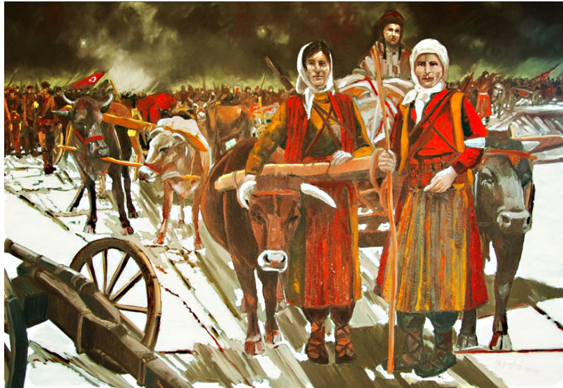
Resim 3: Mehmet Başbuğ, İstiklal Savaşı'nda Seferberlik, 140x200 cm, tüyb 2008

Başbuğ'un eserlerinde gerçeklikle anlattığı bir diğer konu da Türk ulusunun vermiş olduğu İstiklal mücadelesidir. Kurtuluş savaşıyla, bitmeyen tükenmeyen acılar çekmiş milletin duyguları, kadın ve çocuk figürlerinin yüzlerine yansımıştır. Bu yansıma, koyu karanlık bir atmosfer içerisinde, ufka doğru ilerleyen kağnılar, yorgunluktan bitap düşmüş Mehmetçiklerin omuzlarındaki tüfeklerde bile görülmektedir (Şirin, 2020: 969). Başbuğ Milli mücadeleyi tüm gerçekliğiyle izleyiciye sunmaktadır. Öyle ki Erol (2020), sanatçıyı Kurtuluş Savaşının ve bağımsızlık mücadelesinin, Kuvayı Milliye ruhunu devam ettirmeyi hedefleyen, günümüz kuşağının 21. yüzyıldaki temsilcilerinden olarak görmektedir. Başbuğ'un eserlerinde Mehmetçiklerin teşkilatlandırıldığı, yoksulluktan bitap düşmüş halkın her şeylerini ortaya koyarak ve ya istiklal ya ölüm diyerek topyekûn cephenin yolunu tutmaları sanatçının kompozisyonlarının ana temasını oluşturmaktadır. Sanatçı kurtuluş savaşı temalı çalışmalarında o dönem halkının yaşadıkları duyguları, zorlukları, mücadeleleri gerçekçi bir tavırla gözler önüne sermektedir (akt. Şirin, 2020: 969).