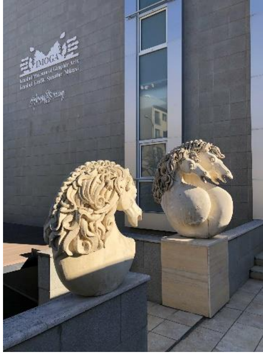
Görsel 3: İmoğa İstanbul Grafik Sanatlar Müzesi Giriş Bölümü