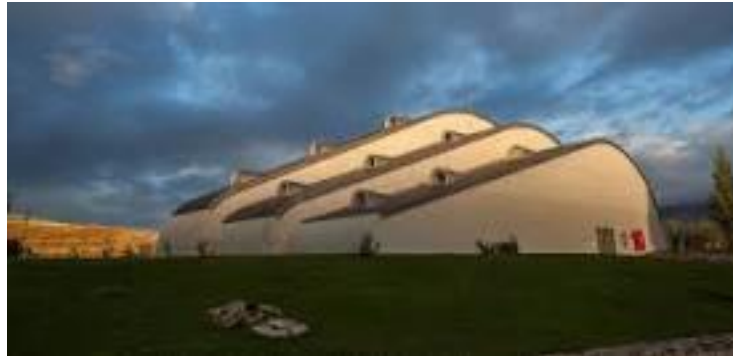
Görsel 7: Baksı Kültür Sanat Vakfı Müzesi