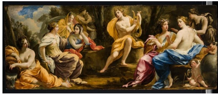
Görsel 1: Apollon ve Müzler- Simon Vouet- 1640

Müze kavramı Yunan mitolojisinde kullanılan Musalar yani ilham perileri adı verilen tanrıçalara adanan tapınlardan gelmektedir. (Gerçek, 1999: 1). Müzelerin isminin dayandığı Musalar dokuz tanrıçadan oluşmakta ve bu dokuz tanrıçanın da farklı bir yaratıcı özellikleri bulunmaktadır (Artun, 2012: 11). Müzecilik kavramı da sanat kavramı gibi birçok araştırmacı tarafından farklı şekillerde ifade edilmiştir. Müzeler kültürel mirasın muhafaza edildiği ve sonraki nesillere taşınan ve sergilenen aynı zamanda eğitim amacıyla kullanılabilen kurumlar olarak tanımlanmıştır (Mercin, 2003; 112). Müze, sanatsal, bilimsel, geleneksel ve birçok alanlarda, geçmişi ve bugünü de içine alan görerek, duyarak ve yaşayarak öğrenmenin gerçekleşmesini sağlayan mekânlar olarak değerlendirilmiştir (Buyurgan ve Buyurgan, 2012: 68). Allan'a göre ise müze, koleksiyonların incelendiği, etüt ve keyif alma amacı taşıyan binalar olarak görülmektedir (Allan'dan Akt. Şahan, 2005, 488).