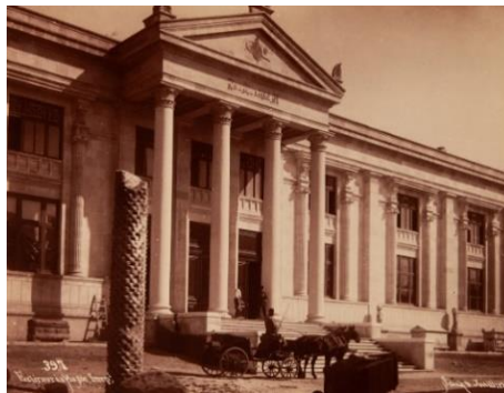
Görsel 2: Müze-i Hümayun (Günümüzde İstanbul Arkeoloji Müzesi)