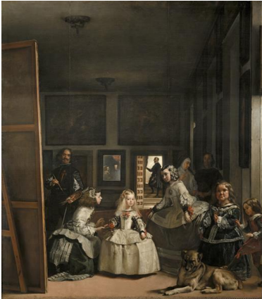
Resim 1. Diego Velazquez, Las Meninas, 1656.