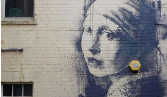
Resim 6. Banksy, The Girl With The Pierced Eardrum, 2014