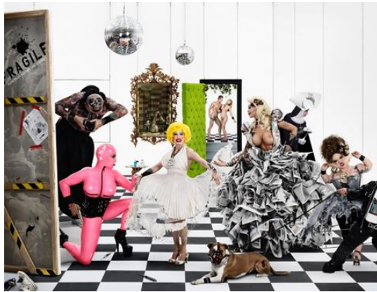
Resim 2. Gerard Rancinan, Maids Of Honor, 2009

İlk olarak Rancinan'ın Velazquez'in ( Las Maninas ) Nedimeler tablosu üzerine gerçekleştirdiği Maids Of Honor adlı yapıtı ele alınmıştır. Nedimeler ( Las Meninas ) tablosu Velazquez tarafından 1656 tarihinde hayata geçirilmiştir. Bu resimde Velazquez'in kendisi de büyük bir tuval üzerine resim yaparken görülmektedir. Dikkatli bakıldığında neyin resmini yaptığı anlaşılmaktadır. Atölyenin arka tarafındaki ayna, portreleri için poz veren kral ve kraliçenin figürlerini yansıtmaktadır. Bu yüzden bizler de izleyiciler olarak kral ve kraliçenin gördüğü şeyi, yani atölyeyi ziyaret eden bir grup insanı görmekteyiz. Kral ve kraliçenin küçük kızları Infanta Margarita, iki nedime arasında durmaktadır. Nedimelerden biri ona içecek bir şey sunarken, diğeri kral çiftine doğru saygıyla eğilmektedir. Bu nedimler gibi, insanları eğlendirmeleri için tutulan iki cüce görülmektedir. Arka planda ciddi