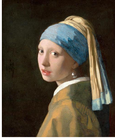
Resim 5. Johannes Vermeer, Girl With A Pearl Earring, 1665

hangi beklenti içinde bakarsanız o size o duygularla cevap verecektir (Krausse, 2005: 15). Eser hakkında bahsedilen teknik özelliklerin dışında Mona Lisa Sanatçılar tarafından da birçok parodisi yapılarak yeniden üretilmiştir. Spoerri ise yapıtında eserin günümüz görsel kültürdeki konumuna atıfta bulunarak Mona Lisa gibi sanat tarihinde önemli bir yeri olan ve aynı zamanda popüler kültürde de sıklıkla kullanılan bir sanat nesnesini, günlük yaşamda kullanılan sıradan bir eşyada dekoratif öge olarak sunmuştur. Sanatçının, sanat tarihinde önemli bir yeri olan bir eseri günlük yaşamda kullanılan bir eşyanın dekoratif ögesi haline getirerek imgenin görsel kültürümüzdeki dolaşımına dikkat çektiği söylenebilir. Böylelikle Louvre Müzesinde korunan, insanların görmek için sıraya girdiği resmin, günlük sıradan bir nesnenin tasarımında kullanıldığını vurgulaması; zamanın değişimini ve sanatın günümüz yaşamındaki yerini sorgulatmaktadır.