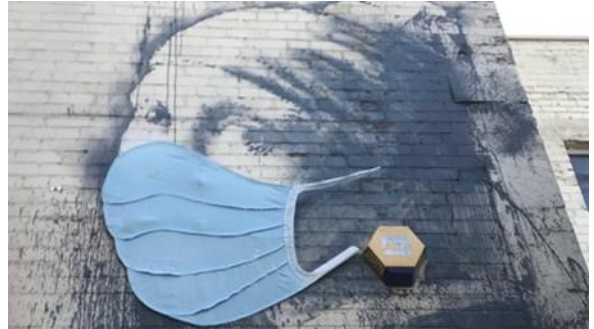
Resim 7. Banksy, The Girl With The Pierced Eardrum, 2020.