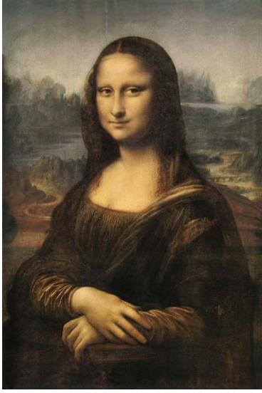
Resim 3. Leonardo Da Vinci, Mona Lisa, 1503-1519.