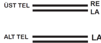
Şekil 19 : Kozağaç Curası Düzen Şeması

Anadolu'daki iki telli saz örneklerinden biri de Burdur Kozağaç curasıdır. Kozağaç curası tüm iki telli Anadolu sazlarının aksine tezene ile icra edilmektedir. Burdur'un Kozağaç bölgesinde ve yakın coğrafyada görülen çalgıda ikişer telden oluşan iki tel grubu vardır. Genellikle 11 perdelidir fakat icracının tercihinine göre perde sayısı 13 perdeye kadar arttırılabilmektedir. Kozağaç curasında geçmişte birer adet telden oluşan iki tel grubu olduğu ve beşli düzende (şekil 2) icra edildiği fakat zaman içerisinde tel sayısının arttırılarak ikişerli tellerden oluşan iki tel grubu ile icra edilmeye başlandığı yerel icracılar tarafından aktarılmaktadır. Dört telli kullanılmaya başlandıktan sonra alt tel grubundaki teller ve üst telin alt sırasında yer alan telin aynı sese akortlanması ile yeni bir duyuş özelliği geliştirilmiştir. Bu düzenlemenin armonik açıdan beşli düzenin duyuş karakterinin korunmasının yanı sıra Anadolu'da sıklıkla görülen melodi çalarken sürekli dem sesi duyma ihtiyacından kaynaklanmış olması muhtemeldir. Kozağaç curasında kullanılan düzen Şekil 19'da verilmiştir.