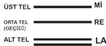
Şekil 20 : Kozağaç Curası Avşar Düzeni Şeması

Kozağaç curasında üst tel grubunun altında yer alan telin istendiğinde kaydırılarak orta tel olarak kullanılması ile saz değiştirmeden iki telli saz, üç telli saza dönüştürülebilmekte ve bölgede "Avşar düzeni" olarak bilinen bağlama düzeni elde edilmektedir. Kozağaç curasında yapılan geçici tel aktarımı ile elde edilen düzen Şekil 20'de verilmiştir.