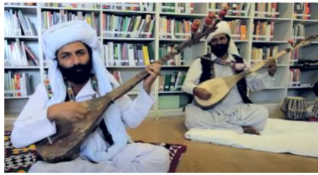
Şekil 13 : Afganistan Balochi Saz Damboora İcra Eden Mahalli Sanatçılar (Url-10)

Afganistan bölgesinde icra edilen diğere bir saz ise “Balochi saz” olarak da adlandırılan “damboora”dır. Balochi veya Balochistan; İran, Pakistan, Hindistan, Türkmenistan ve Afganistan’ı içine alan coğrafi alan olarak bilinmektedir. Afganistan’da bir eyalet olan Baluchistan müzik kültürü bakımından kendine özgü bir yapıya sahiptir. Aynı bölgede kullanılmasına rağmen Balochi damboora ve dambora Hazaragi yapısal ve ses özellikleri bakımından birbirinden farklı iki sazdır. Dambora Hazaragi ile icra edilen müziklerin duyuş özellikleri ve çalgının icra tekniği ağırlıklı olarak kuzey komşuları olan Türkmenistan ve Özbekistan’da görülen Özbek dutarı ve dombraya benzemektedir. Balochi saz dambooranın çalış üslubu ve müzik yapma biçimi ise ağırlıklı olarak güney, güneydoğu ve güneybatısında bulunan Pakistan, Hindistan ve İran müzik kültürüyle benzeşmektedir. Damboora (Balochi saz), dambora Hazaragi’den farklı olarak metal tellidir ve üç telli olarak kullanılmaktadır. Tellerden biri ahenk teli olarak karar sesini sürekli duyuracak biçimde akortlanmaktadır. Çalış biçimi olarak iki telli ile aynı özellikleri göstermesine rağmen ahenk teli sebebiyle üç telli sınıfta değerlendirilmektedir. Damboora çalgısı tezeneli ve tezenesiz olarak iki farklı çalış tekniği ile icra edilebilmektedir. Şekil 13’te Balochi saz damboora ve icra eden mahalli sanatçılar verilmiştir.