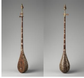
Şekil 6: Afgan, Türkmen Dutarı (Url-3)

İki telli saz ailesine ait diğer bir çalgı ise Kazak halk çalgısı dombradır. Dombra Kazakistan'da yaygın olarak çalınan iki telli sazdır. Dombra (alt tel "la" kabul edilecek olursa) diğer iki telli sazlar gibi dörtlü düzenle (re-la) icra edilmektedir. Daha az yaygın olmakla beraber Altay Kıtay Kazaktarı akordu olarak isimlendirilen beşli düzen de kullanılmaktadır. Kromatik düzümde 19 perdeye sahiptir. Perdeleri misinadan yapılan dombrada geçmişte bağırsak teller kullanılsa da günümüzde genel olarak naylon teller tercih edilmektedir. Yaklaşık olarak 100 cm uzunluğundadır. Kazak dombrasının görünümü Şekil 7'de verilmiştir.