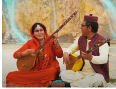
Şekil 12 : Afganistan Dambora Hazaragi İcra Eden Mahalli Sanatçılar (Url-9)

edilmektedir. Şekil 12’de iki telli Dambora Hazaragi ve icracıları verilmiştir.