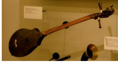
Şekil 9 : Phoenix, Arizona Müzik Enstrüman Müzesinde Sergilenen Tovshuur (Url-6)

olarak 70 cm – 100 cm uzunluğundadır ve armudu, üçgen veya dikdörtgen gövde tipinde olabilmektedir. Dörtlü düzende akort edilen çalgı geçmişte at kuyruğundan elde edilen tellerle icra edilse de günümüzde naylon (misina) teller kullanılarak icra edilmektedir. Şekil 9'da Amerika Birleşik Devletleri'nde bulunan Arizona Müzik Enstrüman Müzesi'nde (Musical Instrument Museum) sergilenen tovshuur çalgısı verilmiştir.