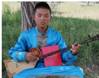
Şekil 11 : Üçgen Gövdeli Tovshuur Çalgısı (Url-8)

Çeşitli kaynaklarda Moğol halk çalgısı olarak da geçen çalgının üçgen gövde formunda olan şekli ise yine Kafkas halkları tarafından yaygın olarak kullanılan panduri ve türevi çalgılara oldukça benzemektedir. Perdeli olan çalgılarda kromatik düzümde 19 perde bulunmaktadır. Şekil 11'de Avusturya Bilimler Akademisi'nin (Osterreichische Akademie Der Wissenschaften) yürüttüğü "Kaybolan Diller ve Kültürel Miras" isimli projede kayıt altına alınan, üçgen formda tovshuur çalgısı çalan bir Moğol icracının fotoğrafı verilmiştir.