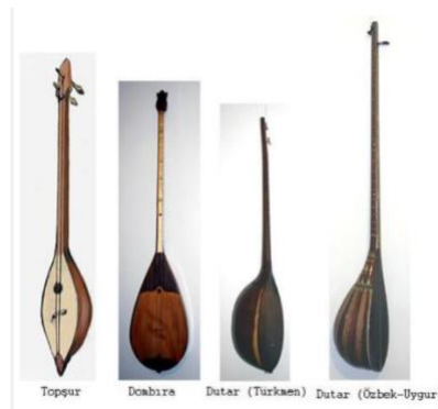
Şekil 8: Topşur, Dombra, Dutar (Url-5)

İrfan Gürdal "Orta Asya ve Anadolu'daki Ortak Müzik Kültürü" isimli yazısında iki telli sazlar ve benzerliklerini Şekil 8'de verilen resimdeki gibi göstermiştir. Resimde topşur isimli bir çalgıya yer verilmiştir.