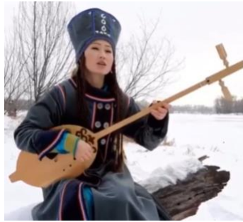
Şekil 10: Tovshuur Çalan Hakas Bölgesi Sanatçısı (Url-7)

Sibirya'da bulunan ve Türk Şaman Uygurlığı olarak bilinen Abakan, Hakas Cumhuriyeti müzik kültürü bakımından Kuzey Asya'da yer alan ülkelere benzemektedir. Özellikle dombra ve Uygur dutarı ile yakın duyuş özelliklerine sahiptir. Sibirya'nın güneyinde bulunan Hakas-Minusinsk Vadisi yerlisi Hakas Türklerinin kullandığı çalgı sağ el teknikleri ve kullanım biçimiyle diğer iki telli çalgılarla benzer müzikal özellikler göstermektedir. Şekil 10'da bu bölgede yaşayan tovshuur sanatçısının fotoğrafına yer verilmiştir. Sanatçı, çalgının farklı gövde tipli türlerinden biri olan armudi gövdeli bir tovshuur kullanmaktadır.