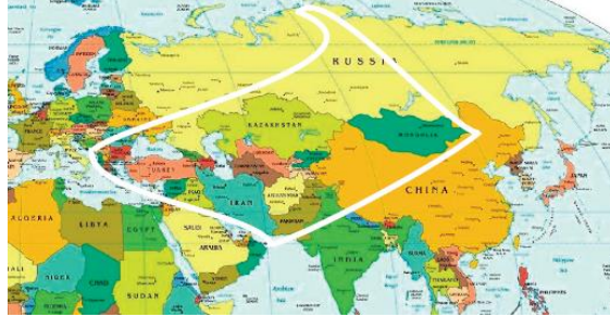
Şekil 16: İki Telli Sazların Görüldüğü Coğrafi Alan

İki telli saz ailesi pek çok isimle ve farklı yapısal özelliklerde Moğolistan'dan Avrupa içlerine Sibirya'dan İran, Afganistan'a kadar oldukça geniş bir coğrafi alanda kullanılmaktadır. Farklı ülkeler ve farklı müzik kültürlerinde müzik yapma aracı olarak kullanılan bu çalgı ifade gücü ve duyuş özellikleri sebebiyle büyük bir coğrafi alanda bugün dahi varlığını sürdürmektedir. Şekil 16'da iki telli sazların görüldüğü coğrafi alan yaklaşık olarak verilmiştir. Bu görsel, kültürel difüzyonun etkisiyle ortaya çıkan müzikal benzeşmenin coğrafi bakımından kapsadığı alanı göstermektedir.