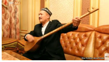
Şekil 3 : Uygur Dutarı (Url-1)

Özbek dutarı yapısal özellikleri ve akort biçimiyle Uygur dutarı ile benzer özelliklere sahiptir. Akort biçimi olarak yine dörtlü düzen ağırlıklı olmak üzere kimi zaman beşli düzen, nadiren de olsa sekizli veya ünison düzen kullanılmaktadır. Şekil 4’te Özbek ve Uygur Dutarları birlikte verilmiştir.