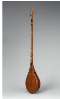
Şekil 5 : Türkmen Dutarı (Url-2)

Türkmen dutarı, yapısal olarak Özbek ve Uygur dutarlarından farklıdır. Uzunluk bakımından daha kısa ve daha küçük gövde hacmine sahiptir. Özbek ve Uygur dutarları yaklaşık olarak 100 cm - 120 cm uzunluğundadır fakat Türkmen dutarı 80 cm - 90 cm uzunluğundadır. Bu iki çalgı arasındaki en önemli fark ise Türkmen dutarında metal tellerin kullanılmasıdır. Akort biçimi olarak yine tüm dutar ailesinde olduğu gibi ağırlıklı olarak dörtlü düzen kullanılmakta, yaygın olmasa da beşli düzen, ünison veya sekizli düzen de kullanılabilir. Türkmen dutarı 13 perdelidir ve diğer dutarlar gibi tezenesiz olarak çalınmaktadır. Türkmenistan ve İran bölgelerinde Türkmenler tarafından çalınan dutarın görünümü Şekil 5’te verilmiştir.