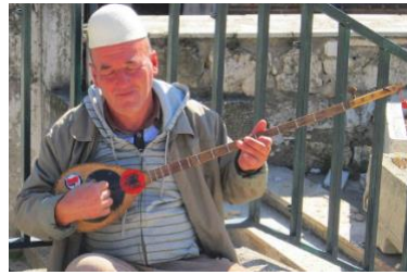
Şekil 15: Makedonya, Üsküp'te Çiftelli Çalan Mahalli İcracı (Url-12)

Şekil 15'te ise Makedonya, Üsküp'te çiftelli çalan mahalli bir icracının fotoğrafına yer verilmiştir. Fotoğrafta yer alan püskül Antik Çağlardan beri Anadolu'da var olan çalgılara püskül takma geleneğiyle benzerlik göstermektedir.