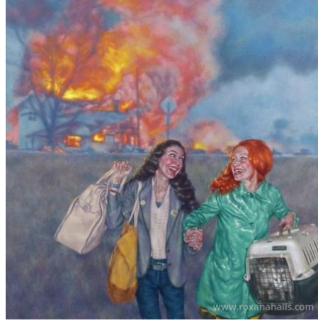
Görsel 9: Roxana Halls, Parçalarken gülmek , 2019.

olabilirler". ( https://www.artsy.net/artwork/roxana-halls-laughing-with-my-mouth-full ). Sanatçının diđer eserleri de incelendiđinde bu iki kadının çok büyük bir ihtimalle evi yaktıklarını düşünebiliriz.