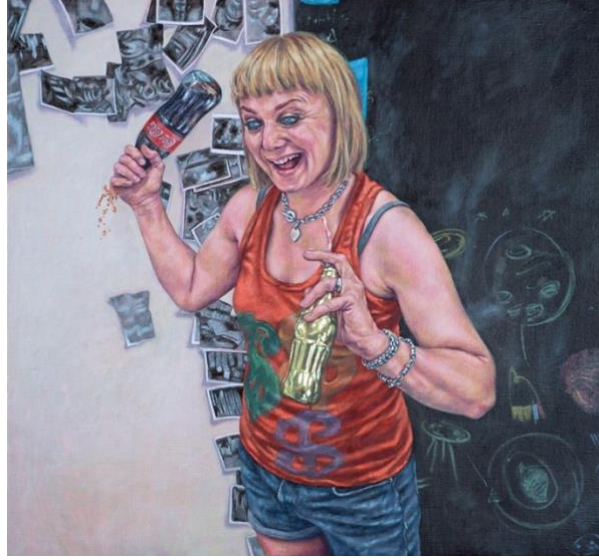
Görsel 11: Roxana Halls, Yaparken gülmek Şişe, 2022.

Roxana Halls'un gülerken serisinden 2022 yılına ait bir başka resimde elinde kola şişesini ters tutan bir kadın resmedilmiştir. Diğer elinde altın rengi bir kola şişesi daha olan kadın yine diğer resimlerde olduğu gibi hareket anındadır (Görsel 11). Özellikle bu görselin, 80'ler, 90'lar colacola görsellerinin stiline benzediği görülebilir. Sahneye ortalanmış bir kadın figürü, kola şişesini ters tutarak birisinin kafasına vuracaktı gibi resmedilmiştir. Gözlerdeki çılgın ifade, zemindeki negatif ve pozitif alanlar görsele dinamizm katmaktadır. İlk anda, alışlagelmiş bir reklam görseli izlencesi şeklinde başlayan bu deneyimin de sanatçının üslubuyla başka bir mesaja döndüğü görülebilir. Sanatçının son dönem eserlerinde yine silah tercihini yapan kadınlar bulunmaktadır. Sanatçı bu serisiyle ilgili olarak yayınladığı instagram gönderisinde alttaki metni paylaşmıştır.