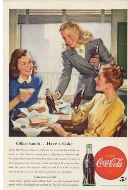
Görsel 2. Coca Cola Coke Women Out To Lunch Diner T (1947)

Bir ürün lansmanı için üretilen poster tasarımları, hedef kitlenin ürünü benimsemesini sağlarken bir yandan da akılda kalıcılığını arttırabilmektedir. Dolayısıyla figüratif illüstrasyonlarda bir duygu aktarımı amaçlandığı için, yüz ifadelerinin önem taşıdığı düşünülebilir (Görsel 1, 2).