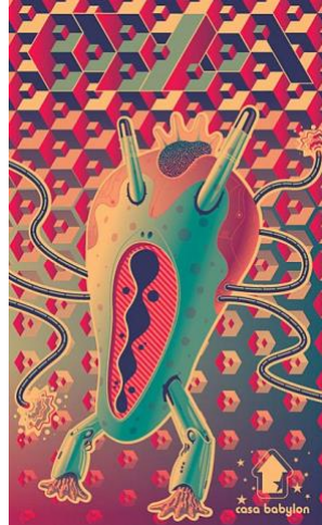
Görsel 4. Santiagoguerrero Casa babylon poster ve broşür için illüstrasyon

Bilgisayar destekli photoshop vs. gibi yazılımlardan öncesinde de sıkça tercih edilirken, teknolojik gelişmeler sonrasında üretimin hızlanması ve bilgisayar ortamındaki farklı doku ve etkiler sayesinde zenginleşme ve farklı üsluplaşma olanaklarının artmasıyla modern zamanda da sıkça tercih edilen bir yöntemdir (Görsel 4, 5).