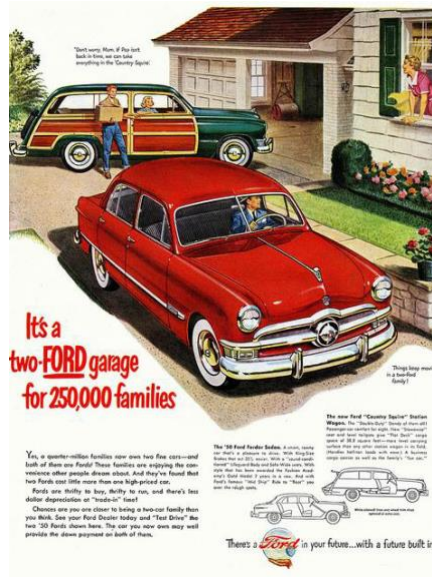
Görsel 1. It's a two Ford garage for 250,000 families, 1950.

Bir ürün lansmanı için üretilen poster tasarımları, hedef kitlenin ürünü benimsemesini sağlarken bir yandan da akılda kalıcılığını arttırabilmektedir. Dolayısıyla figüratif illüstrasyonlarda bir duygu aktarımı amaçlandığı için, yüz ifadelerinin önem taşıdığı düşünülebilir (Görsel 1, 2).