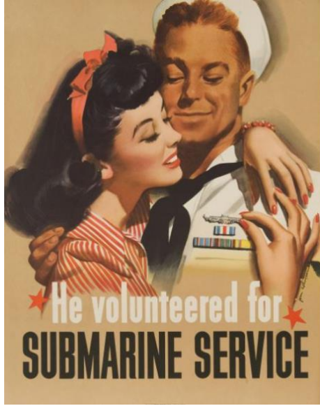
Görsel 3. He volunteered for Submarine Service. ABD basım ofisi 1944.

Reklam veya sosyal bir mesaj için oluşturulan illüstrasyonlarda yüz ifadelerinin önem taşıdığı görülebilir. Bu tür illüstrasyonların gerek bir ürünü satmak, gerekse bir fikri insanlara yerleştirmek veya his uyandırmak gibi amaçları vardır. Bir fikri yerleştirmede negatif etki yansıtılmak istenmez. Örneğin bir diş fırçası veya macunu tanıtımında, aşırı diş fırçalamanın zararından bahsedilmesi tercih edilmez. Bu bağlamda "gülümseme"nin önemi, güven, huzur mutluluk gibi mesajlar taşıdığı görülebilir.