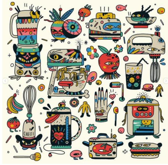
Görsel 5. Selin Çınar'ın Arzum'un 55. Yılı için yaptığı illüstrasyonlar.