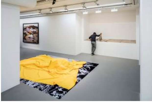
Görnel 3. Gustav Metzger, To Crawl Into (İçeri Girmek İçin), Arter Sanat Galerisi, 2017.

Bu gelişmeler sonucunda izleyicilere aktif ve sosyal bir varlık olarak alan açan, etkileşime dayalı, yeni ve demokratik sanat anlayışı ortaya çıkmıştır. Sanatsal üretimlerde deneyim olgusu en önemli noktalardan biri olmuş, artık katılımcı olarak tanımlanan izleyici, sanatın aktif tamamlayıcısı haline gelmiştir. 2017'de Arter Sanat Galerisi'nin ev sahipliği yaptığı Görme Biçimleri adlı sergide yer alan Gustav Metzger'in "İçeri Girmek İçin" adlı tarihi fotoğrafı, sanat ve izleyici ekseninde gerçekleştirilen önemli bir fiziksel deneyim örneği olarak değerlendirilebilmektedir. Çalışmada, kaldırım temizlemeye zorlanan Viyana Yahudileri'nin zemine yerleştirilmiş dev görüntüsü, ancak bir örtü altından sürünülerek görülebilen bir deneyimle karşılık bulmaktadır. Bu deneyimde fotoğrafa ait olan anlam, deneyimi gerçekleştiren izleyicinin eylemi ile tamamlanmakta ve bu yolla sanatın bireysel vurgusu yerine katılımcı yönü açığa çıkmaktadır.