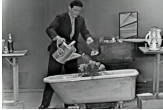
Görsel 1. John Cage, Water Walk, 1950

yapıt olarak değerlendirilmiştir (Eco, 1992: 13).