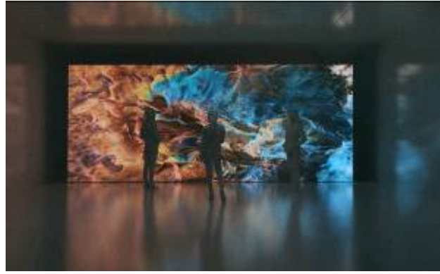
Görsel 6. Refik Anadol, Yapay Zeka Veri Heykeli, ISS, Hubble, MRO, Giriş Kat, Pilevneli Sanat Galerisi, Sergi Kataloğu, 2021