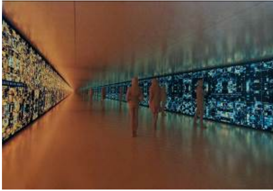
Görsel 5. Refik Anadol, Veri Tüneli, Bodrum Kat, Pilevneli Sanat Galerisi, Sergi Kataloğu 2021

Serginin 'Hatıralar' adlı birinci kısmı, yapay zekâ yoluyla elde edilen ve sınıflandırılan işlenmemiş verilerin pigmentler haline getirildiği hareketli veri ve heykel ve tablolarından oluşmaktadır. Sergideki işler, Hubble, MRO ve ISS teleskopları aracılığıyla kayıt altına alınan, bugüne dek bir sanat yerleştirmesinde yararlanılan, uzay temalı en geniş veri kümesi denilebilecek ve sayısı iki milyonu aşan görüntüden yararlanmaktadır. 'Düşler' adlı ikinci bölümü ise kaynağı aynı arşive ait, 15 dakika süren, mekânla bütünleşik ve izleyiciyi saran bir yapay zekâ sineması ile üç boyutlu veri heykellerinden meydana gelmektedir. Sanatçı, veri heykelleri ile dünyanın ve diğer gök cisimleri ve gezegenlerinin yüzey özelliklerini değerlendirip teleskopların düşlerini tablolar haline getirmektedir. 'Makine Hatıraları: v.2' adlı yapay zekâ sineması izleyicinin on beş dakika süresince uzayla ilgili rüya görmüş bir makinenin belleğine ulaşmaya aracı olmaktadır (Kıvrak, 2021: 2-3). Sergi kapsamında yer alan işler sırasıyla; Veri Tüneli, Bodrum Kat; Yapay Zekâ Veri Heykeli, ISS, Hubble, MRO Giriş Kat; Makine Hatıraları v2, Birinci Kat; Makine Halüsinasyonları: Sentetik Manzaralar-Mars Heykelleri, Asma Kat ve Makine Halüsinasyonları: Hubble Rüyası, ISS Rüyası, MRO Rüyası, Üçüncü Kat olarak mekânda dağılım göstermektedir.