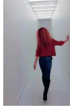
Görnel 4. Marina Abramovic, Sound Corridor (War) Ses Koridoru (Savaş), Sakıp Sabancı Müzesi, 2020

Teknoloji destekli katılımcı deneyimini bir örnekle değerlendirmek gerekirse, Görme Biçimleri 'nde olduğu gibi kişisel olarak deneyimlediğim, Marina Abramovic'in Sakıp Sabancı Müzesi'nde gerçekleşen Flux, Akış (2020) adlı sergideki işten söz etmek mümkündür. Sanatçının "Sound Corridor" (War), "Ses Koridoru" (Savaş) adlı işinde, ses, ışık ve mekân ilişkisinin güçlü kurgusu katılımcıya etkisi çok yüksek bir deneyim yaşatmaktadır. Mekânın uzun dar koridoru bütünüyle beyaza boyanmış, beyaz floresan ışık tavanı belli aralıklarla aydınlatmıştır. Yaratılan alan kurgusu içerisinde sergi katılımcısı silah ve çatışma sesleri ile bir kapıdan girip, diğerinden çıkması için yönlendirilmiş, böylelikle kişinin farklı bir uzama yolculuk yaparak kendisini savaşın ortasında hissetmesi sağlanmıştır. Oldukça etkili bu enstalasyonda fiziki alanın ses ve ışık kullanımıyla desteklenmesi, deneyimin boyutunu artırmış, dolayısıyla izleyicinin duygusunu da aynı derecede güçlendirmiştir.