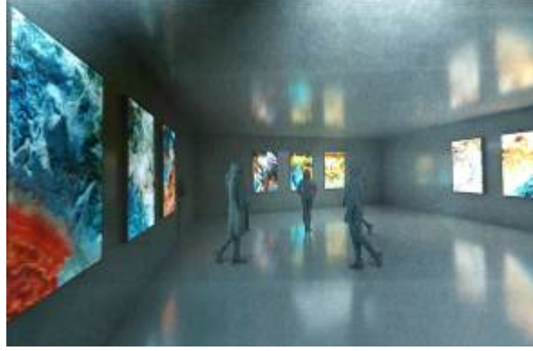
Görsel 9. Refik Anadol, Makine Halüsinasyonları: Hubble Rüyası, ISS Rüyası, MRO Rüyası, Üçüncü Kat, Pilevneli Sanat Galerisi, Sergi Kataloğu, 2021

Özellikle en alt kata yerleştirilen “Veri Tüneli”, izleyicinin üretim süreçlerine ve ardında yatan işlem sürecine tanıklık ettiği bir bölümdür ve “Nasıl?” sorusuna verilen en açık yanıtın alındığı bölüm olarak değerlendirilebilir. Veri Tüneli, ham verinin ve teleskoplardan alınan görüntülerin nasıl işlendiğini ve sanatsal veriye dönüştüğünü göstermekte, o nedenle serginin bu bölümünün, özellikle yazılım, kod, arka plan süreçleri konusunda ilgili bireyler açısından merak uyandıran bir bölüm olduğunu söylemek mümkündür. “Makine Hatıraları v.2” adlı sinema deneyimi de gerek kullanılan teknoloji gerek ardında yatan fikir, gerekse mekânsal etkisi bağlamında izleyiciyi en çok etkileyen deneyim alanlarından birisi olmuştur.