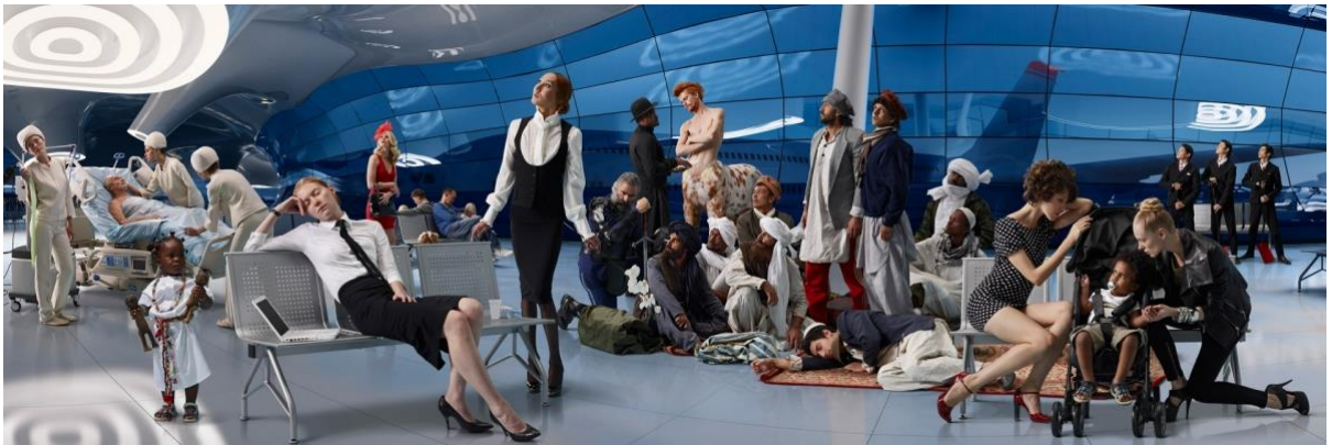
Resim 5. AES+F, Alegori Sacra / Kutsal Alegori, Panaroma I, 2012, Dijital Kolaj

İngiliz Sokak sanatçısı olarak bilinen Banksy , sosyal politik meseleler odağında geliştirdiği sanat dilini herkesin ulaşabileceği kamusal alanlardaki duvarlara şablon baskı türünde uygulamaktadır. Banksy'nin mizahi bir ironiyle harmanladığı işleri çoğunlukla sokağa dair bir eylem izlenimi uyandırmaktadır. Sanatçının Odadaki Fil isimli sergisi, bu kez farklı bir deneyimi, bir iç mekânda, yine yoğun mesaj ileten yanıyla sunmaktadır. Mekânın nesneyle olan ilişkisini biçim ve anlam birlikteliği yönünde planlayan Banksy, serginin isminden de anlaşıldığı gibi, oturma odasına dönüştürdüğü bir mekânın ortasına devasa bir fil yerleştirmekle kalmamış; fili duvar kağıdıyla aynı renge boyayarak mekana özgü bir bütünsellik yaratmıştır. "Odadaki Fil" aslında bir İngiliz atasözü olarak, görünürde olup da görmezden gelinen sorunlara işaret eden ironik bir içeriğe sahiptir. Bu metaforu gerçek bir mekânve canlı bir fil aracılığıyla doğrudan kendi maddi koşulu içinde kurgulayan sanatçı, görmezden gelinen sorunlar ve çelişkileri "göstermek" adına sıra dışı bir anlatım yoluna başvurmuştur. İç mekânda canlı bir filin bulunması normalde olmaması gereken, son derece absürt bir durumken; filin varlığı, mekanla kurduğu bütünlük içindeki yokluğu üzerinden okunmaktadır. Fil, odanın ortasında durmaktadır ancak gerçekte de tıpkı ima edildiği gibi görünmemektedir.