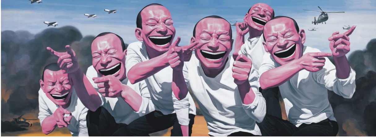
Resim 1. Yue Minjun, Fighting/ Kavga No: 15, 2007-2008, Litografi, 80x120 cm.

Çağdaş Çin Sanatının önemli isimlerinden biri olan Yue Minjun'un , metafor bağlamı oldukça güçlü imgeleri, bu tür zıt ilişkiler üzerine kurulan anlam yapılanmasına olanak vermektedir.