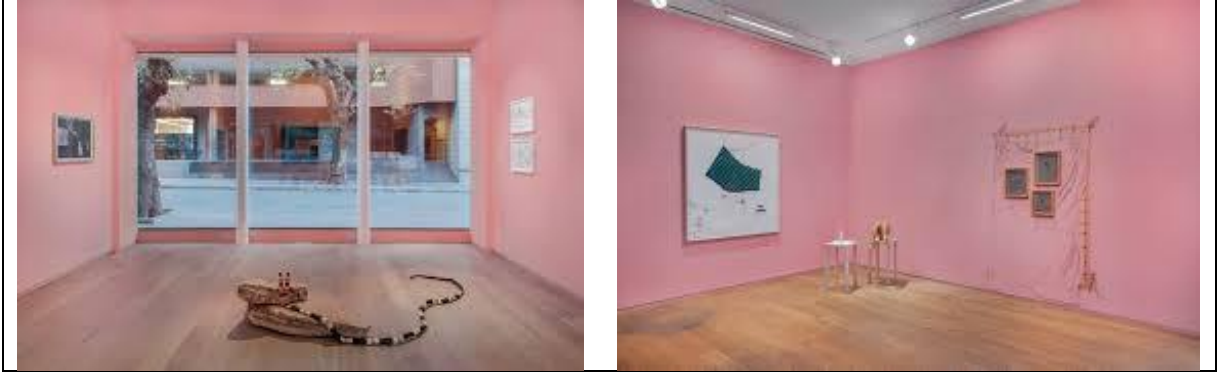
Resim 2. Nilbar Güreş, Nilbar Güreş, Çift Başlı Yılan: Queer Tutku Vahşidir, 2015, Dantel, kemer tokası, taş, Ykş. 44 x 210 x 150 cm.