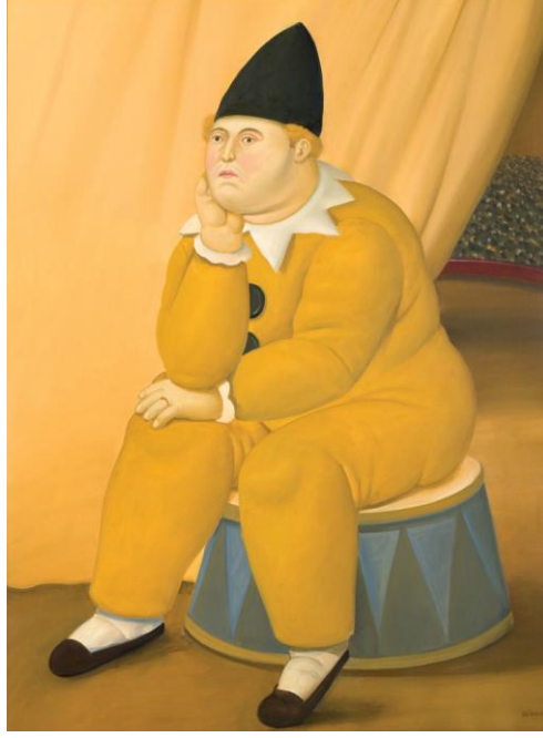
Resim 3. Fernando Botero, Oturmuş Palyaço, 2008, t.ü.y.b., 135x101 cm (Botero Sergi Kataloğu, 2010: 111).