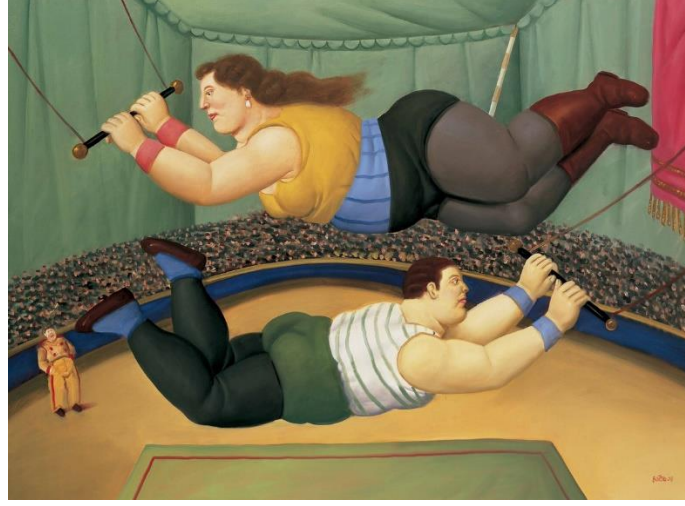
Resim 4. Fernando Botero, Uçan Kartallar, 2008, t.ü.y.b., 2008, t.ü.y.b., 99 x 137 cm (Fernando Botero Sergi Kataloğu, 2009: 32-33).