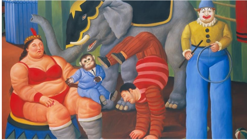
Resim 1. Fernando Botero, Fille Sirk İnsanları, 2007, t.ü.y.b., 182x206 cm (Botero Sergi Kataloğu, 2010: 107).

"Fille Sirk İnsanları" (2007) Adlı Resmin Düzanlamsal ve Yananlamsal Düzlemde Göstergebilimsel Analizi: "Fille Sirk İnsanları" (2007) isimli çalışmada düzanlamsal düzlemde şov pistinin gerisinde sirk yaşamının parçası olan kulis mekânı temsil edilmektedir. Kostümleriyle birlikte maymun ve fil olmak üzere iki tane hayvan figürü ve biri kadın toplam üç tane insan figürü bulunmaktadır. Fil, resim yüzeyinin büyük bir alanını kaplayacak biçimde arka plana, maymunun sol ön tarafta oturan kadın figürünün kucağına yerleştirilmiştir. İnsan figürlerinin şov alanındaki görevlerine dair kimlikleri üzerindeki giysiler ve gösteri