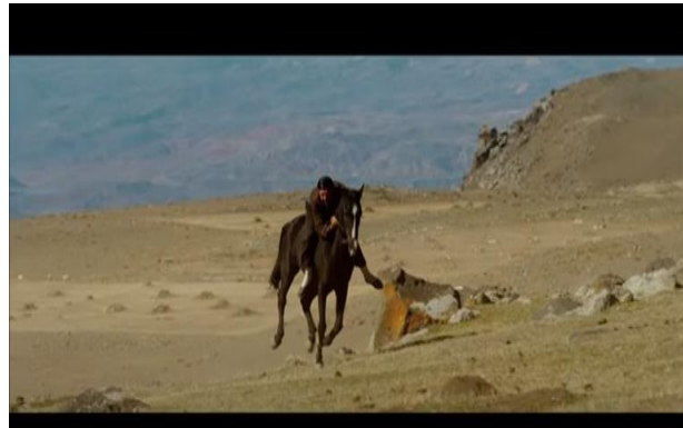
Resim 8. İntihar için uçuruma kaçtığı an

Mızgin Aziz'in tüm sorumluluğunu üstlenir ve artık bütün ihtiyaçlarını o karşılar. Aziz'e alışmak için çaba gösterir. Ancak toplum baskısı, toplumun onları aşağılaması, dalga geçmesi ve hayatlarını çekilmez bir hale getiren tutum ve davranışlar karşısında dayanamaz. Aziz bu durum karşısında kendini çok çaresiz hisseder, Mızgin'e yük olduğunu düşündüğü için intihar girişiminde bulunur.