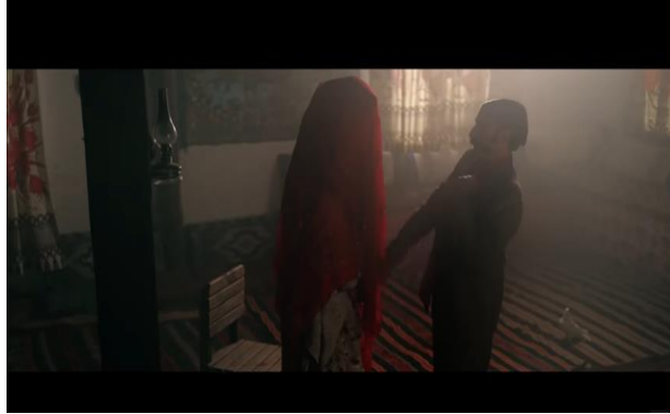
Resim 6. Gerdek gecesi

Gelin içeri girdiğinde sürekli ağlar Aziz'in annesi bu senin kaderin diyerek Aziz'i ona emanet ettiğini söyler ve odadan çıkar. Damat Aziz içeri girdiğinde kızın güzelliği karşısında heyecanına yenik düşerek bayılır.