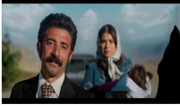
Resim 11. Filmin son sahnesi

Aziz'de bu değişimi gören ailesi ile arasında geçen diyaloglar şu şekilde devam eder.