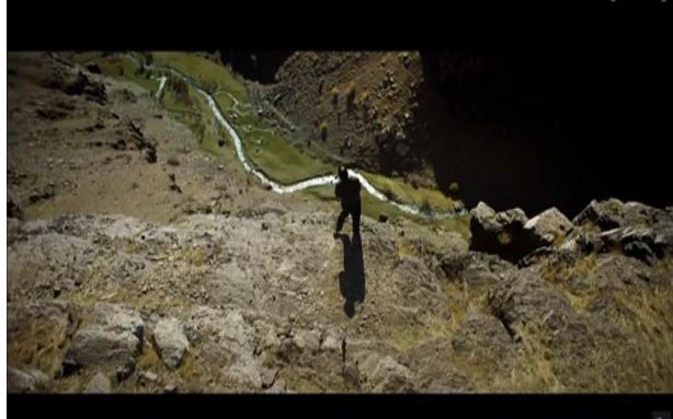
Resim 9. Uçurumun kenarı

En yakın arkadaşı olarak gördüğü atına binerek uçuruma doğru süratle koşan Aziz uçurumun kenarına gelir ve atlamak üzereyken peşinden koşan Mahir öğretmen tarafından durdurulur.