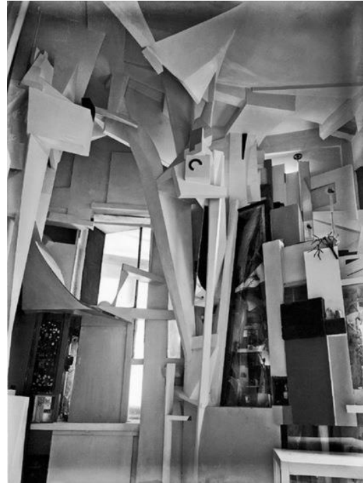
Resim 3. Kurt Schwitters, Merzbau.

(1923 tarihinden 1937 yılına kadar sürede inşa edilmiştir.)