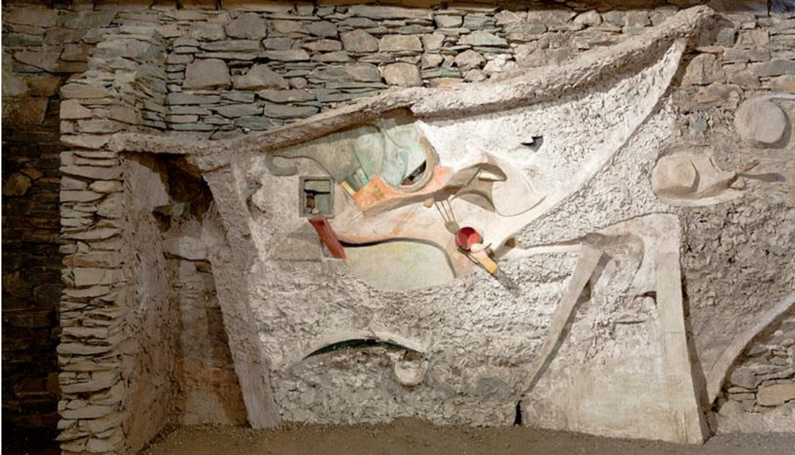
Resim 6. Merz Barn Eseri (Merz Ambarı/Ahır), 1947. Schwitters'in Ölümünden Sonra Oğlu Ernst'in çektiği Bir Fotoğraf

Sadece iş yaparak değil, iş yapmayı feda ettiği erotizm aracılığıyla da insanlaşır. İnsan ayrıca ölümlü olduğunu fark etmesiyle de hayvanlardan ayrılır. Ve ölümlü erotizm arasında bir birlik oluşur. Çünkü iş hayatına, çalışmaya son veren en mutlak hadise ölümdür. Sanat da ölüm ve erotizmde olduğu gibi, çalışmanın kesintiye uğradığı, arzuların kamçulandığı bir etkinlikdir (Altınıyıldız Artun, Artun, 2018:530).