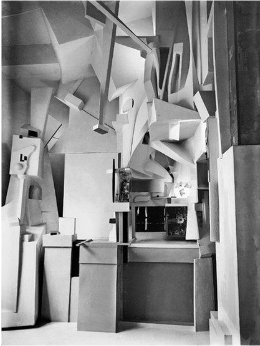
Resim 2. Kurt Schwitters, Merzbau.