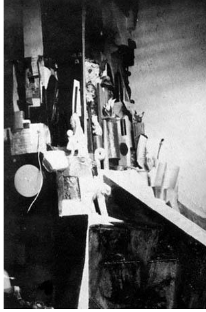
Resim 5. Erotik İstirap Katedrali (KdeE), 1928.

Kurt Schwitters, Merzbau eserinin temelini oluşturmaya devam ederken Merz heykellerinden ikincisi (Resim -5), Erotik İstirap Katedrali ile çalışmasını eş zamanlı yürütmüştür. Merzbau yapısını şekillendiren bu sütunlar, sanatçının uzun bir zaman diliminde sayılarını arttırması ile sürece eklenmiştir.