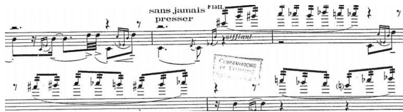
Şekil 3: A. Jolivet "Cinq Incantations" Kurbağa Dili

Cinq Incantations (Beş Büyü), A. Jolivet tarafından 1936 yılında flütist Jan Merry'e ithafen bestelenmiş, ilk icrası 1938 yılında yapılmıştır. Bu eserin ritmik yapısı, sürekli tekrar eden belirli sayıda motifler, uç noktalarda hareket eden aralık ve dinamikler, Jolivet' nin 1929-1933 yılları arasında kompozisyon çalıştığı hocası E. Varèse'den ne kadar etkilendiğini göstermektedir (Larson, 1990: 199). Jolivet'nin Afrika seyahati dönüşü, dinlediği neyin tınlarından esinlenerek bestelemiş olduğu beş kısımdan oluşan müziğin tasviri bir içeriği bulunmaktadır. Bu beş başlık , insanlığın derin arzularını hatırlatmaktadır: dünyada barış, eski günlerden miras kalan ismi, zenginlikleri ve mutlulukları sürdürme, sofrada yeterli miktarda yemek, iç huzur ve ebedi ölüm. Varèse'in aksine burada flütün imkânları hiç zorlanmamakta ve yalvarmak için flüt tanrıya doğru sesini yükseltmektedir. Kutsal flüt yalvarmaktan yorgun ve acıdan harap olmuş durumdadır. Flütün bütün zenginliklerinin ve farklı oktavlarda değişik renklerin kullanılması, tekniklerin saplantılı tekrarı, Density 21.5'den sonra bu esere de başyapıt özelliği kazandırmaktadır. Solo flüt eserlerinde, şekil 3'te gördüğümüz kurbağa dili (fluttertonguing) tekniğine ilk bu eserde rastlanmaktadır (Artaud,1986: 44-45).