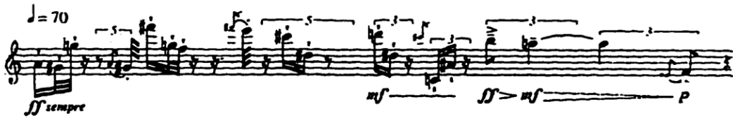
Şekil 7: Sequenza I'in 1992 Uyarlaması Notasyon Değişikliği

İlk bakışta Sequenza I'in 1992 uyarlaması, 1958 uyarlamasına göre daha belirgin notasyona sahip gibi gözükse de detaylı incelendiğinde farklı bir sonuca varılabilir. 1992 yılında yeniden yazılan uyarlamada bütün uzun notalar ve üzerinde fermata (durak işareti) bulunan notalar daha kontrollüdür. 1958 uyarlamasında bulunan bütün fermata'lar, 1992 uyarlamasında saniyeleri belirtilerek yazılmıştır. Eski