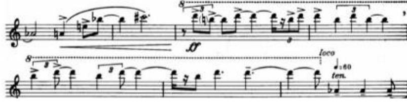
Şekil 1: E.Varèse "Density 21.5" 4. Oktav Re Notası

bestelenmiş ve 1946 yılında revize edilerek güncel haline getirilmiştir. Bu parça adını, G. Barrère'in yoğunluğu 21.5 olan platin flütünden almıştır. Platin flüt, diğer bütün madenlerden yüksek bir yoğunluğa sahip olduğu için geniş bir tona ve güçlü ses renklerine sahiptir (Önertürk, 2015: 98). Eser, kriz döneminde bestelenmiştir. Güçsüzlükten kaynaklanan çaresizliği ifade etmekte ve dünyaya karşı haykırmaktadır. Flüt o dönemde, kuvvetli kalın ses çıkarılamayan, üç oktavın üstüne zorluklarla çıkabilen, mekanik problemlerden dolayı çalınması zor bir çalgı idi. Varèse bu eserde kullandığı teknik ve tınlarla, flütün fiziksel sınırlarını aşarak, çalgıya farklı bir boyut kazandırmak istemiştir. Seslerin, nüansların ve ritmin iç içe geçmesiyle olağanüstü bir parça ortaya çıkmıştır. Bu parçada dikkat çeken bir yenilik te, flütün daha önceki eserlerde sık rastlanmayan 4. oktavın üzerindeki Re notasına çıkarak, ısrarla ve vurgulu bir şekilde tekrar ederek bu notanın duyulmasıdır (Şekil 1). Perdelere vurma (key clicks) tekniği ilk bu eserde kullanılmıştır (Şekil 2). Density 21.5, sonraki elli yıl içerisinde gelişecek olan bütün temel öğeleri kapsayan ilginç bir eserdir.