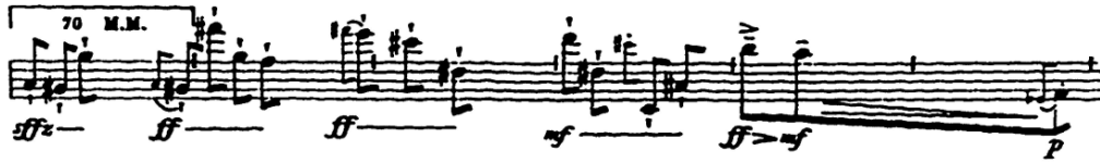
Şekil 6: Sequenza I'in 1958 Uyarlaması

1992 yılında Sequenza I , 1958 versiyonuna (Şekil 6) nota değerleri eklenerek tekrar yazılmıştır (Şekil 7). Bestecinin asistanı David Osmond-Smith, bu aktarım sırasında eserin orijinalliğini kaybettiğini düşünmektedir (Knopke, 1997: 24)