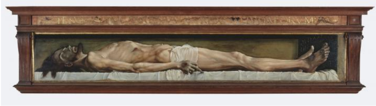
Resim 2. Hans Holbein, 1521, Ölü İsa’nın Mezarındaki Cesedi, Pano Üzerine Yağlı Boya, 31x200 cm

Ayrıca Hristiyanlara göre İsa, ölümü ve dirilişi ile “ insanoğlunun kurtuluşu ”nu ifade etmektedir (2016: 231). Bu anlayış, sanat tarihi boyunca birçok farklı ölü İsa resimlerinin ortaya çıkmasına neden olmuştur. Giotto’dan Andrea Mantegna’ya, Dürer’den, Caravaggio’ya kadar farklı anlayışlarda ölü İsa resimleri yapılmıştır. Kuşkusuz tüm ölü İsa tabloları önemli ikonografik detaylar barındırmaktadır. Fakat bu noktada özellikle Hans Holbein’in ‘Ölü İsa’nın Mezarındaki Cesedi’ çalışması, ölü bedeninin içinde bulunduğu durumu doğrudan bize göstermektedir. Bedenin tabut içerisindeki klostrifobik atmosferi ve İsa’nın içinde bulunduğu durum kutsal Hristiyan anlatısını inkâr etmektedir. Holbein, ikonografinin alışılmış kuralları dışında yeni bir temsil kurgulamıştır.