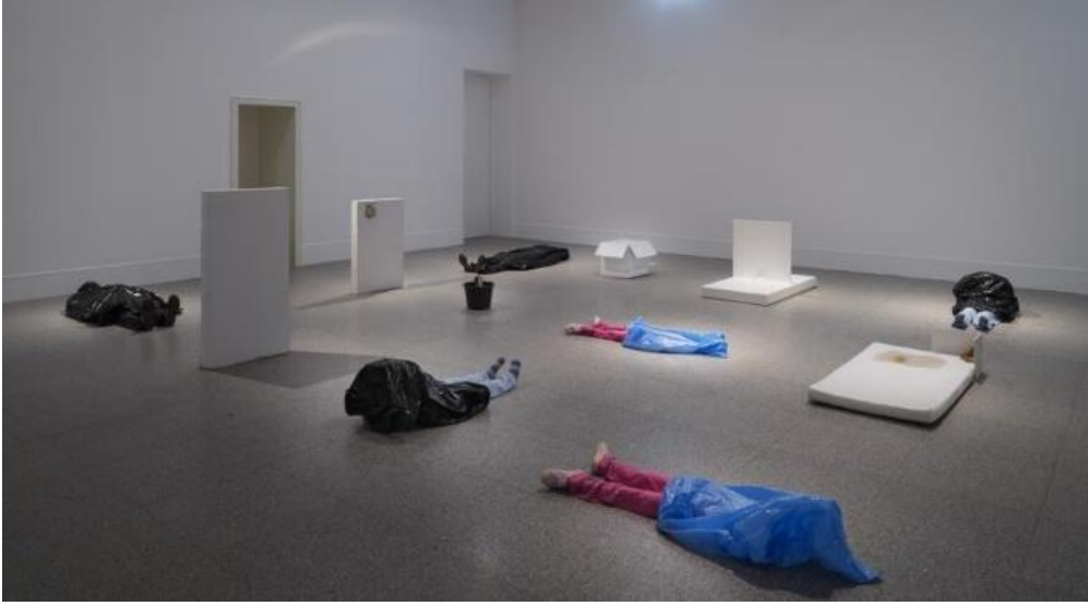
Resim 7. Gregor Schneider, 2016, Duvardan Önce Duvar, Kurulum Görünümü, Bundeskunsthalle, Almanya

Gregor Schneider, kamusal alan içerisinde ölümü teşhir etme fikrinden her zaman etkilenmiştir. Hatta sanatçı bir serginde kendisini ölü olarak gösterdiği bir performans bile gerçekleştirmiştir. Peki, ama neden? Schneider, bu konuya ilişkin olarak; ölen birini veya yeni ölmüş birini sergilemek istediğinden bahsetmiştir. Ayrıca asıl amacının ölümün güzelliğini izleyicisine doğrudan göstermek olduğunu söylemiştir (2008, http://bit.do/fNsn5 ). Dolayısıyla sanatçı, ölü beden kavramına ironik ve bir o kadar da gerçekçi şekilde yaklaşmaktadır. Schneider, bedeninin ölümlülüğü, çaresizliği, savunmasızlığı, bireyselliği gibi insana ilişkin temel olguları ölüm kavramı üzerinden yansıtmaktadır. Ölüm kavramını benzer kaygılarla ortaya koyan bir diğer sanatçı ise Patrick Raynaud'tur. Tabii bu noktada tartışılacak olan asıl konu da sanatçının 'Anatomik Tiyatro' çalışmasıdır.