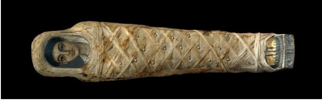
Resim 1. Antik Mısır Mumyası, M.S. 100-120, Ahşap Üzerine Balmumu Karışımı Boya, 26x42.13 cm

Ölmüş olan, yaşamın dışına atılmış olandır. Fonksiyonunu kaybetmiş bir bitişin halidir. Fakat birçok toplumda aslında bu durum, yeni bir başlangıcın habercisidir. Bu bağlamda baktığımızda Antik Mısırlılar ölü bedenlerini mumyalayarak diğer dünyaya hazırlamışlardır. Tabii bu noktada bedenlerin çürümeden kalması önemli konudur. Çünkü bedenden ayrılan ruh, bozulmamış olan bedene geri dönecektir. Antik Mısırlılar bedeninin çürümesinden ve bunun sonucunda tekrar canlanamamasından doğan tedirginliklerine sıkça rastlanmaktadır.