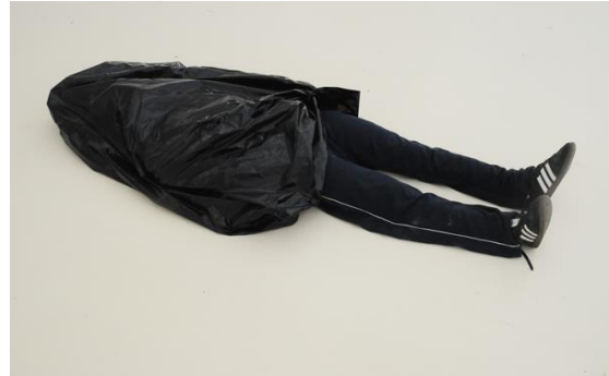
Resim 5.(Solda) Berlinde De Bruyckere, 2011, Bir – Diğerine II, Balmumu, Epoksi, Demir, Ahşap, Cam, 193x183x86 cm Resim 6. (Sağda) Gregor Schneider, 2004, Adam, Hazır ve Karışık Teknik