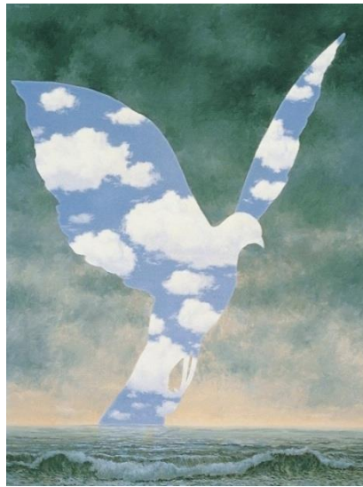
Görsel-2:Rene Magritte, "TheLargeFamily", 1963

Rene Magritte, bu eserinde gökyüzü ve bulut görüntüsünü doğada bulunan biçiminden uzaklaştırarak kendi varlığının amacını sürrealist bir açıdan ele almaktadır. Bir sanatçının kendi gerçekliğini oluşturmak