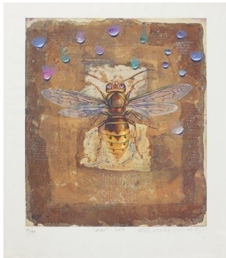
Görsel-5: Ergin İnan, "Arı", 2015, 44x37, A.Ü.K.T

Daha çok özgün baskı sanatçısı olarak tanınan ve bu alanda kişisel bir üslup geliştiren Ergin İnan'ın resimleri, fantastik akımın izlerini taşır. Sanatı daha çok gerçeküstü ve fantastik yapıtlar olarak dışa vurur (Sanal-2).