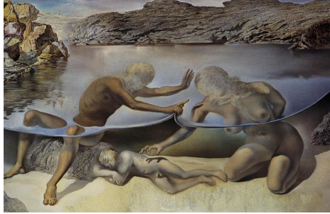
Görsel-3: Salvador Dali, "Hercules lifting the Skin of the Sea asks Venus for a Moment Longer Before She Awakens Love", 1963

konusunda ki tavrı, Magritte’te belirgin örneklerde görünmektedir. Bulut imgesine yüklediği anlam, sanatçının yaşama karşı hislerinin mantık dışı bir ölçüde savunma biçimidir. Sürrealizm akımında kendine has yorumları ile ve bu akımın en belirgin isimlerinden birisi olan Salvador Dalide, (Görsel-3) doğa resimlerinde su temasına sürrealist tarzda yorumlara sıklıkla yer veren sanatçılardandır.