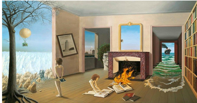
Görsel-4: Dominique Appia, "Entre Les Trous De La Memoria", 1975

Dominique Appia, sürrealist ifade şekillerinde "su ve bulut" temasına sıklıkla yer veren sanatçılardandır. (Görsel-4) Sanatçının doğaya resimsel anlamda egemen olma tutkusunu, iç dünyasının yadsınmaz gerçekliklerinden ve inançlarından oluşmaktadır.