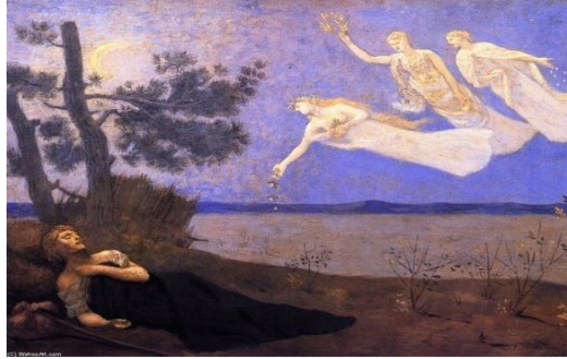
Görsel-1: Pierre De Chavannes, "Düş", 1883

Dada ile Sürrealizm arasında önemli farklar vardır. Sürrealizm tümüyle psikolojik bir olay. Dada ise sanatı inkar eden niteliğiyle tümüyle negatif, yıkıcı bir sanat anlayışı ve uygulamasıdır (Kınay, 1993: 286).Düş, hayalcilik, bilinçaltı ve rüyalar sürrealizm için önemli kavramlardır. Düş; gerçek olmayan ama olmuş ya da varmışçasına bellekte tasarlanan, düşünülen şey anlamına gelmektedir. Düş sırasında kişi, mantığın belirleyici unsurlarından uzaklaşır ve bilinçaltının derinliklerine dalar. Düş kurmanın sanatsal bir ifade biçimine dönüşmesinde sürrealizm akımı bu anlamda kendisine sağlam bir yer edinmektedir. Bu cümleden hareketle sürrealizm; hayal gücünün ve düş kurmanın aracılık ettiği bir ifade biçimidir denebilir. Çalkantılı bir dünyanın ortasında yer alan ve bilinçaltı, düşlere ve rüyalara entegre olan sürrealistler, 20. yüzyıl bağlamında "kendisinin anlatılışını" toplumsal bir ölçüde dile getirmektedir. Hayalciliğin sonucunda ortaya konan biçimcilik, sınırlamalardan arınarak yaşamsal bir itki haline gelmekte ve rasyonelleşmiş bir görüntünün yerini almaktadır. (Görsel-1)