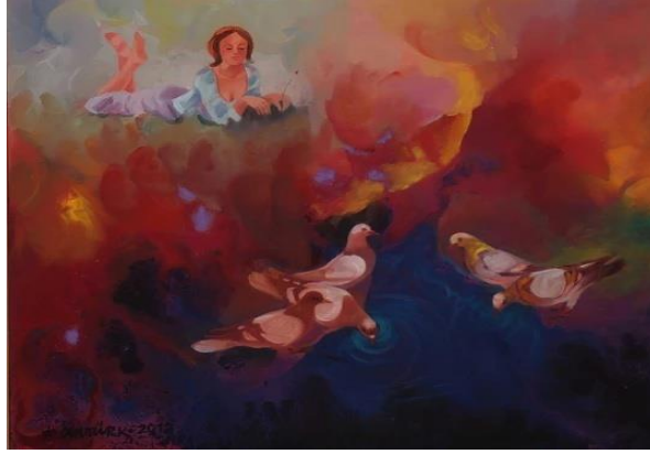
Görsel-9: Fikri Cantürk, "Su İçen Güvercinler", T.Ü.Y.B

Eserde görülen su imgesi, (Görsel-9) sanatçının hayali bir evrenin sınırlarında ortaya çıkan bir ifadedir. Bu anlamda sanatçının su temasına kendi bakış açısının somut gerçekliği tabirini kullanmak kabul edilebilir bir anlayıştır. Gerçekçi gibi görünürken, gerçekçi olmayan ya da görünen dünyanın gerçekliğinden beslenirken sanatçı, sürrealist bir yaklaşımın dışavurumu olarak karşımıza çıkmaktadır. Sanatçı, eserlerinde yoğun bir duygusallığın ifade biçimlerini göstermek istemektedir. Lekeseli bir armoninin dağılımındaki ahenkler, gerek doğa yorumlamalarını gerek su yorumlamalarını çok öte bir yere koymaktadır.