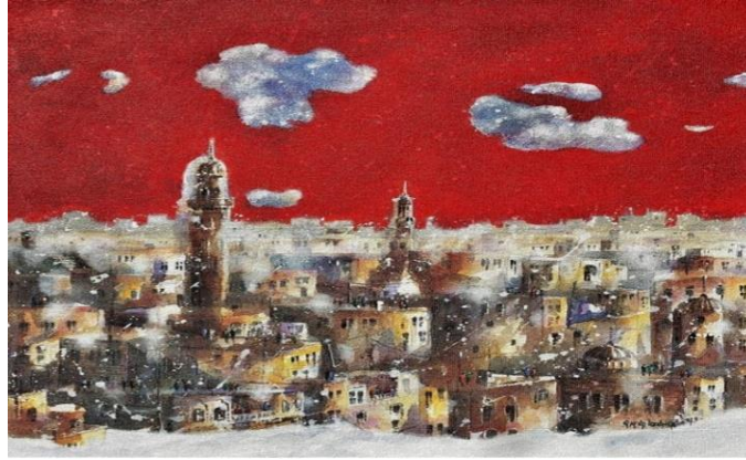
Görsel-6: Gafur Uzuner, "Mardin Midyat Arası", 2019, 45x45, Akrilik

"Resimlerimi yaparken doğadan birebir çalışmıyorum. Kurmaca üzerine gidiyorum ve nihai amacım; gezilerimden aldığım izlenimlerin sonuçlarını artistik anlamda değişime uğratarak aktarmak. Resimlerimde bulutlar geniş yer kaplamakta ve bu çocukluğumdan gelen bir dürtü. Ankara'nın bir köyünde doğdum ve çocukken sürekli bulutlara bakıp onları hissetmek istedim. Bulutlarımı resmederken onların biçimlerini bozarak artistik kaygularıyla yorumluyorum " (Gafur Uzuner ile Kişisel İletişim, 11 Ocak 2021).