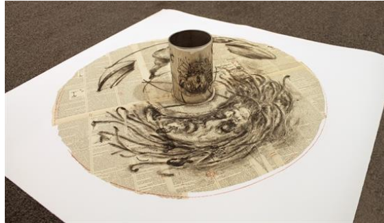
Resim 7. William Kentridge, Medusa, Karışık teknik, 5x23,2 x77,47 cm,2001.

Kentridge, "Medusa" (Resim 7) adlı eserinde ise görme duyusuyla algılanamayan, herhangi bir forma sahip değilmiş gibi görünen ancak özel bir bakış açısıyla bakıldığında doğru algılanan 'anamorfik' kavramını uygulamıştır. Yunancadan 'yeniden dönüşüm' olarak çevrilen anamorfik kavramını sanatçı bu tasarımda Fransız Larousse Ansiklopedisi'nin (1906) sayfaları üzerine litografi tekniği ile gerçekleştirmiştir. Medusa'nın görüntüsünü ayna kaplamalı çelik silindir üzerine yansıtan Kentridge, bu efsanevi mitin tehlikeli bakışını açılabilir hesaplarla ortadan kaldırarak üç boyutlu algı yanılsaması yaratmış eser ile izleyen arasında güçlü bir atmosfer oluşturmuştur.