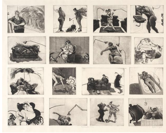
Resim 1. William Kentridge, 16 Ev Sahnesi, Yumuşak zemin ve aquatint, 49,5x63,5 cm, 1980.

Kentridge'in "Küçük Ahlak" adlı çalışması (Resim 2) 1994 yılında ilk demokratik seçimlerle birlikte belli toplulukların yerinden edilmesi, Afrika Ulusal Kongresi ile hükümet arasındaki görüşmelerden sonra Nelson Mandela'nın serbest bırakılması da dahil olmak üzere o dönemin önemli olaylarının yer aldığı süreci kapsar. Goya'nın "Savaşın Felaketleri" serisindeki kompozisyon ve karakterleri de anımsatan bu serisi ise sekiz gravür plakasından oluşmaktadır. Sanatçı, "Küçük Ahlak" serisi adlı çalışmalarını: "Güne Hazırlık", "Manzaraya Girmek", "Atık Önleyici", "Müzakereler Başlıyor", "Delegelerin Alayı", "Pratik Hususlar", "Yedek Ordu", "Büyüyen Yaşlı", olarak adlandırmıştır. Kentridge, bu adlandırmalar ile yaşadığı dönem hakkında da bir anlamda ipucu verir.