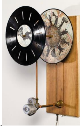
Resim 6. William Kentridge, Fenakistiskop, Karışık Teknik, Çap: 29,2 cm, yükseklik: 80cm, 2000.

Platon'un Mağaralar Alegorisinde bahsettiği mahkumlar ve onların dünyayla tek bağlantısı olan duvarlara yoldan geçen insanların ateş aracılığıyla yansıyan gölgeleri arasında bağlantı kurarak göçmenleri ele alan Kentridge, (Resim 6) Bacon'un Popüler Dünya Atlası üzerine baskısını gerçekleştirmiş ve fenakistiskop* adlı cihazın üzerine monte etmiştir. Sinemaya ait bu cihazla, aşamalı hareket kavramını hareketsiz görüntülerle birleştiren sanatçı, litografi tekniğiyle ürettiği çalışmasını, hareket eden diskler aracılığıyla üst üste bindirerek izleyeni yeni bir görüntüye ulaştırmıştır.