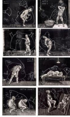
Resim 3. William Kentridge, Ubu Gerçeği Anlatıyor, Gravür, 24,8x30 cm, 1996-1997.