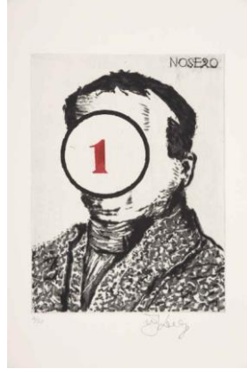
Resim 8. William Kentridge, Burun 20, Gravür, 40x34,9 cm, 2009.

yerini siyah bir maske alır. Kentridge'in bu çalışmalarında görüldüğü üzere "Spesifik formlarında, her zaman silme efüzasyonu, kaçırma ve unutmaya tabi olan siyasi belleğin yapısını yansıtır" (Krauss vd, 2017: 91).