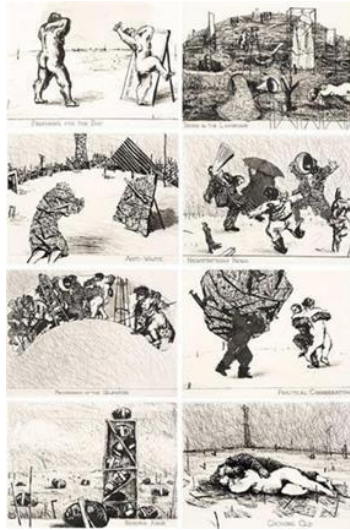
Resim 2. William Kentridge, Küçük Ahlak, Gravür, 24x32 cm, 1993.

Kentridge'in "Küçük Ahlak" adlı çalışması (Resim 2) 1994 yılında ilk demokratik seçimlerle birlikte belli toplulukların yerinden edilmesi, Afrika Ulusal Kongresi ile hükümet arasındaki görüşmelerden sonra Nelson Mandela'nın serbest bırakılması da dahil olmak üzere o dönemin önemli olaylarının yer aldığı süreci kapsar. Goya'nın "Savaşın Felaketleri" serisindeki kompozisyon ve karakterleri de anımsatan bu serisi ise sekiz gravür plakasından oluşmaktadır. Sanatçı, "Küçük Ahlak" serisi adlı çalışmalarını: "Güne Hazırlık", "Manzaraya Girmek", "Atık Önleyici", "Müzakereler Başlıyor", "Delegelerin Alayı", "Pratik Hususlar", "Yedek Ordu", "Büyüyen Yaşlı", olarak adlandırmıştır. Kentridge, bu adlandırmalar ile yaşadığı dönem hakkında da bir anlamda ipucu verir.