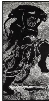
Resim 5. William Kentridge, Telefon Kadın, Tuval üzerine linol baskı, 203,2x100,3 cm, 2000.

Kentridge'in "Telefon Kadın" (Resim 5) adlı linol baskiresminde gövde ve kafası oldukça hantal, çevirmeli bakalit telefona dönüşüme uğrayan kadın figürü büyük adımlarla bir gölet üzerinde durmaktadır. Siyah beyaz renklerle basılan bu çalışmada telefon imgesi, Apartheid rejimi sırasında konuşma özgürlüğünün kısıtlandığı ve kadın kimliğinin sorgulandığı dönemi yansıtmaktadır.