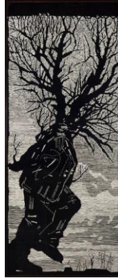
Resim 4. William Kentridge, Yürüyen Adam, Tuval üzerine linol baskı, 240x100,3 cm, 2000.