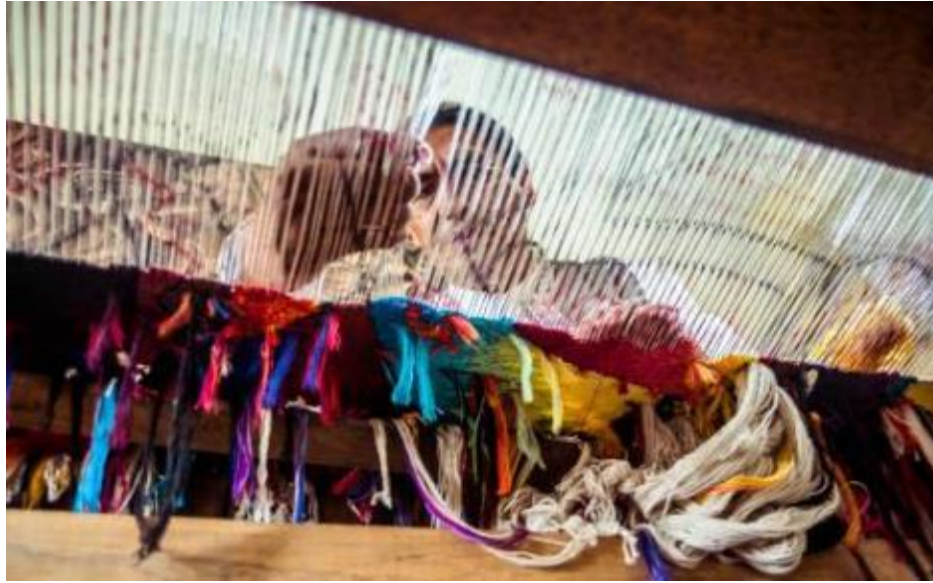
Resim 22. Tapestry yaratım süreci, dokuma esnasında arka yüzeyde bırakılan iplik uçlarının görünümü. ( https://maximolaura.com/creation-process/ )

Maximo tapestry dokumaları, sanatçı tarafından kendi teknikleri üzerine eğitim verdiği seçilmiş bir grup usta dokumacı tarafından uygulanan el dokumalarıdır. Peru'da tapestry dokumacılığı, nesilden nesile aktararak öğrenildiği için, Maximo atölyesinde çalışan dokumacıların çoğu ailelerinden gelen dokumacılık geçmişine sahiptir. Atölyede Maximo'dan aldıkları eğitimlerle, yaratım sürecini ve sanatçının kendine özgü geliştirdiği tekniklerini öğrenmişlerdir. Sanatçının dikkatli denetimi altında, dokuma sürecinde renkler ve dokular sıra sıra açığa çıkmaktadır. Dokuma işlemi tamamlandıktan sonra tapestry dokumasının uzatma ve temizleme aşamasına geçilmektedir. Uygulama yapılırken dokumacının gördüğü alan tapestrynin ön yüzü olduğu için iplik uçları ters tarafta bırakılmakta (Resim 22), uygulama sonrasında temizleme yapılmaktadır. Tezgâhtan çıkartılan tapestryde gerilim farklılıkları oluştuğundan son olarak dokuma gerilerek kalıcı ölçü belirlenmektedir ( https://maximolaura.com/creation-process/ ).