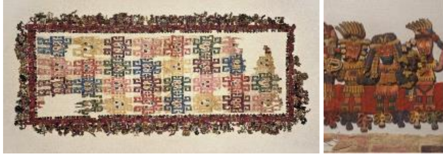
Resim 2. Paracas Tekstil, Nazca, Pamuk ve devetüyü elyafı, 148x62,2 cm, 100-300. Brooklyn Müzesi, 38.121. ( https://www.archaeology.org/issues/337-1905/features/7548-maps-peru-paracas-textile )

MÖ 900-200 yılları arasında etkin olan Chavin kültüründen günümüze kalan kısıtlı sayıda tekstillerde dişil tanrıların ve hayvan figürlerinin sembollerle yer aldığı tören giysi örnekleri bulunmaktadır. Daha geç örneklerde üzerine desen işlenmiş tekstiller, düz örmeler ve çapraz ilmekli özel örme yapılar yaygınlaşmıştır (Desrosiers, 2014: 2).