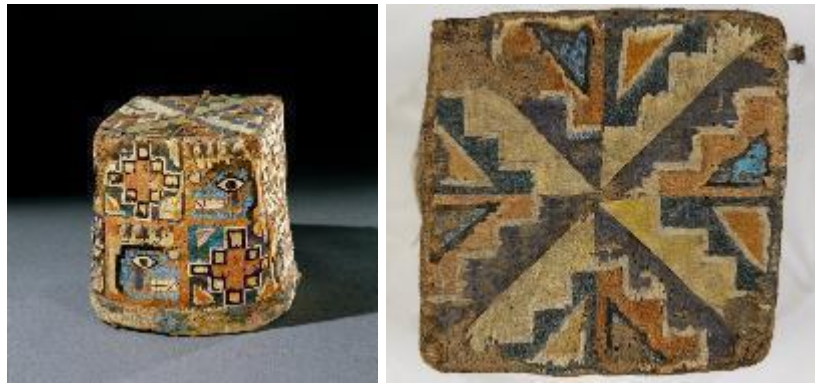
Resim 3. Wari Dört Köşeli Şapka, Pamuk, kamyş, tüyler, 17x14x14 cm, 650-1000. Brooklyn Müzesi, 41.228. ( https://www.brooklynmuseum.org/opencollection/objects/51469 )

MS 700-900 yılları arasında Wari eyaletinde seçkin sanat üretimi devlet kontrolünde yapılmıştır. Bu dönemden günümüze kalan tekstiller arasında yüksek rütbeli görevliler için üretilmiş şapkalar, tunikler ve etkileyici renk alternatifleri ile dokunmuş, oldukça geometrik desenlerden oluşan çok sayıda yinelenen motif içeren duvar halıları, yer almaktadır.