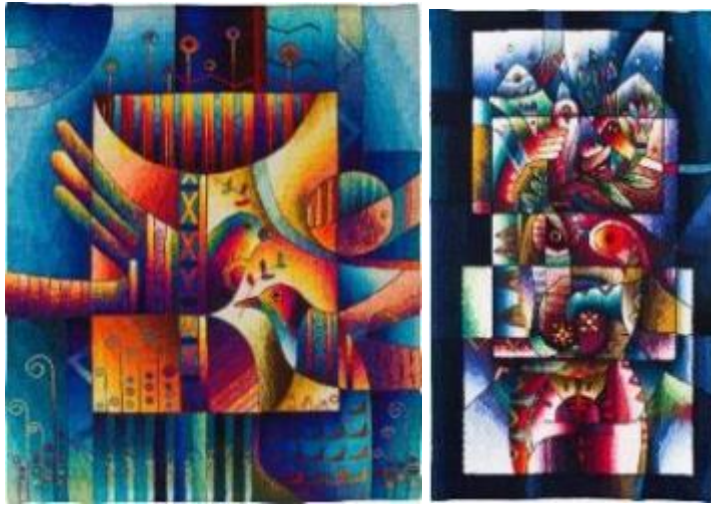
Resim 15. "Barışma", Maximo Laura Tapestry Dokuma, 120x100 cm, 2016. Resim 16. "Aile Kurma I" Maximo Laura, Tapestry Dokuma, 250x100 cm, 2018.

Sanatçı, And sembollerinin ve mitlerinin Atalarına Ait Hatıraları ("And Mitolojisi", "Jaguarlar", "Kademeli", "Spiraller", "Kare Haç" ve "Kozmik"); Müzisyenlerin ruhani mekânları ("Hatun Raymi", "Wiñay Taki", vb.); Orman ("Mallqu"); Dağ ("Musosqamay"); alegorili tören şarkıları; Kutsal sunular ("Takionqoy", "Kusi Pacha", vb.); Ritüeller ve Vizyonlar ("Totemler", "Yllapa", "Pachamama Taki"); Yaşamın kutlanması ("Balık", "Kuşlar", "Galapagos", "Yakın Bulgular"); ve İç Denizler ("İç Deniz") gibi doğadan ve geldiği toprakların zengin kültüründen esinlenerek ortaya koyduğu eserlerinin yaratım sürecini yaşadığını ifade etmiştir. Peru topraklarının antik dokusunun, doğasının, destanların ve masalların tükenmez bir ilham kaynağı olduğunu ifade eden sanatçı, geleneğin devam etmesi için kendisine bu konuda sorumluluk düştüğünü vurgulamıştır. Kültürlerin özünü, rengini, çeşitliliğini ve kimliklerini en iyi biçimde ayakta tutan geleneklerini önemseydiğini aktarmıştır. Sanatçı bazı eserlerinde de küresel ısınmaya, insanlar arasındaki şiddete, ekolojik özellikli konulara da değinerek, küresel problemlere olan duyarlılığını sanatsal bir tepki vererek göstermiştir. Maximo özet olarak, eserlerinde ele alınan konu ne olursa olsun, farklı görmenin ve farklı yorumlamanın sonucunun yeni ilhamların doğmasına sebep olduğunu belirtmiştir.