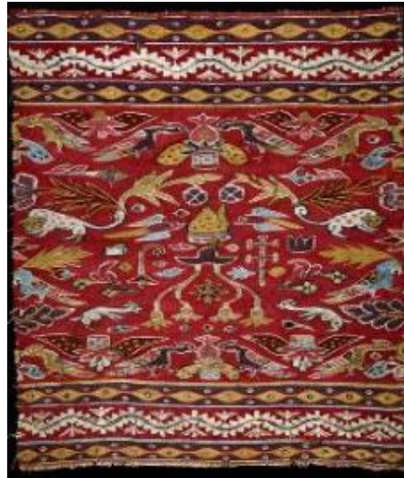
Resim 7. Goblen dokuma, Pamuk çözü, yün atkı, 1600-1699. yıllarına tarihlenen pamuk çözü ve yün atkı goblen dokuma, karakteristik olarak dönemin tipik kolonyal goblenine özgü teknik özelliklere sahiptir. Viktorya Albert Müzesi koleksiyonu, T.15-1923. ( http://collections.vam.ac.uk/item/O84911/tapestry-unknown/ )

Eski Peru kumaşlarına, dünyanın büyük müzeleri tarafından önem verilmiş, sergilenmiş ancak hak ettiği tanınırlığı yeterince sağlayamamıştır. Güney Amerika'da Zengin bir tarih ve kültüre sahip And bölgesi ve tekstillerinin bulunduğu coğrafyada da yeterince tanındığından söz edilemez.