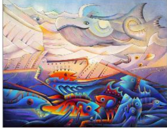
Resim 18. Tapestry yaratım süreci, çizim aşaması. Resim 19. Tapestry yaratım süreci, renklendirme aşaması. ( https://maximolaura.com/creation-process/ )

Maximo, dokuma ön hazırlık aşamasında yaptığı çizimi, renkli kalemlerle ya da bilgisayar ortamında renklendirmektedir (Resim 19). Sonraki aşamada desen, renk laboratuvarına götürülerek renklendirilen tasarıma uygun renk yorumlamaları yapılmaktadır. Sanatçının "kelebekler" olarak adlandırdığı tapestry dokumasında kullandığı iplik tonları tek renk ve birden fazla düz renk ipliğin bir arada kullanımı ile (Resim 20) elde edilmektedir. Böylelikle, çok renkli etkisi ile öne çıkan Maximo'nun tapestry dokumalarında kullanılacak parlak ve canlı renk tonları ve kombinasyonları oluşmaktadır. Sürecin devamında küçük ölçekli hazırlanan çizim, uygulanacak tapestry'nin boyutuna uygun büyütülerek ya da bilgisayar ortamında hazırlandı ise basımı alınarak gerçek ölçekte çizim hazırlanmaktadır. Dokumacıya uygulama esnasında kılavuzluk etmesi amacıyla, farklı doku ve tekniklerin dahil edileceği bölümler belirtilerek çizim çözgü ipliklerine aktarılmaktadır ( https://maximolaura.com/creation-process/ ).