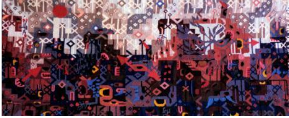
Resim 12. "And Mitolojisi", Maximo Laura, Tapestry Dokuma, 122x363 cm, UNESCO Latin Amerika ve Karayipler Ödülü Eser, İspanya, 1992. ( https://maximolaura.com/maximo-laura-award-winning-tapestries/ )