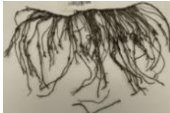
Resim 1. Sayısal kayıt tutma için düğümlerin kullanıldığı Quipus, Sertleşmiş pamuk, 215cm, 1400-1600.