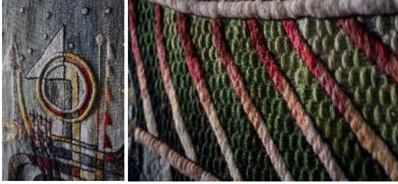
Resim 25. "Kutsal Gök Gürültüsü", Detay.

Maximo; 2010 yılında UNESCO'nun "Somut Olmayan Kültürel Mirası Destekleme" üzerine verdiği, "Yaşayan İnsan Hazineleri, Peru Ödülü" ile onurlandırılmıştır. Sanatçı kültürel mirasının gururlarından biri olan Peru tekstiline, kimlik ve devamlılık duyguları aşıladığına inandığını belirtmiş, Peru'nun binlerce yıllık mirasını sürdürmekten gurur duyduğunu vurgulamıştır. Bu ödülle, uzmanlık alanında bilgi ve tekniklerini geliştirmeye ve bunları yeni nesillere aktarmaya, onları eğitmeye, kayıt altına alınmış belgeler, eserler üretmeye ve bu zamanın kendisine sunduğu diğer tüm araçları içselleştirerek yoluna devam etmesi için hayatında önemli bir taahhüdü üstlendiğini ifade etmiş, böylelikle ülkesinin sürdürülebilir kalkınmasına katkıda bulunduğunu aktarmıştır.