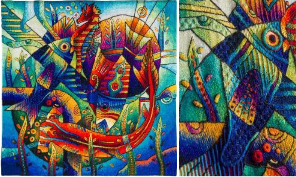
Resim 26. "Mutlu Gün Batımı I", Maximo Laura, Tapestry, 120x120 cm, 2019. Resim 27. "Mutlu Gün Batımı I", Detay Görüntü.

Maximo; 2010 yılında UNESCO'nun "Somut Olmayan Kültürel Mirası Destekleme" üzerine verdiği, "Yaşayan İnsan Hazineleri, Peru Ödülü" ile onurlandırılmıştır. Sanatçı kültürel mirasının gururlarından biri olan Peru tekstiline, kimlik ve devamlılık duyguları aşıladığına inandığını belirtmiş, Peru'nun binlerce yıllık mirasını sürdürmekten gurur duyduğunu vurgulamıştır. Bu ödülle, uzmanlık alanında bilgi ve tekniklerini geliştirmeye ve bunları yeni nesillere aktarmaya, onları eğitmeye, kayıt altına alınmış belgeler, eserler üretmeye ve bu zamanın kendisine sunduğu diğer tüm araçları içselleştirerek yoluna devam etmesi için hayatında önemli bir taahhüdü üstlendiğini ifade etmiş, böylelikle ülkesinin sürdürülebilir kalkınmasına katkıda bulunduğunu aktarmıştır.