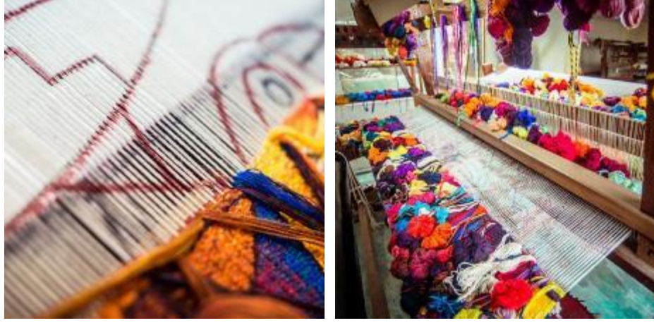
Resim 21. Tapestry yaratım süreci, kılavuz çizgilerinden yararlanılarak uygulama aşaması. ( https://maximolaura.com/creation-process/ )

Maximo tapestry dokumaları, sanatçı tarafından kendi teknikleri üzerine eğitim verdiği seçilmiş bir grup usta dokumacı tarafından uygulanan el dokumalarıdır. Peru'da tapestry dokumacılığı, nesilden nesile aktararak öğrenildiği için, Maximo atölyesinde çalışan dokumacıların çoğu ailelerinden gelen dokumacılık geçmişine sahiptir. Atölyede Maximo'dan aldıkları eğitimlerle, yaratım sürecini ve sanatçının kendine özgü geliştirdiği tekniklerini öğrenmişlerdir. Sanatçının dikkatli denetimi altında, dokuma sürecinde renkler ve dokular sıra sıra açığa çıkmaktadır. Dokuma işlemi tamamlandıktan sonra tapestry dokumasının uzatma ve temizleme aşamasına geçilmektedir. Uygulama yapılırken dokumacının gördüğü alan tapestrynin ön yüzü olduğu için iplik uçları ters tarafta bırakılmakta (Resim 22), uygulama sonrasında temizleme yapılmaktadır. Tezgâhtan çıkartılan tapestryde gerilim farklılıkları oluştuğundan son olarak dokuma gerilerek kalıcı ölçü belirlenmektedir ( https://maximolaura.com/creation-process/ ).