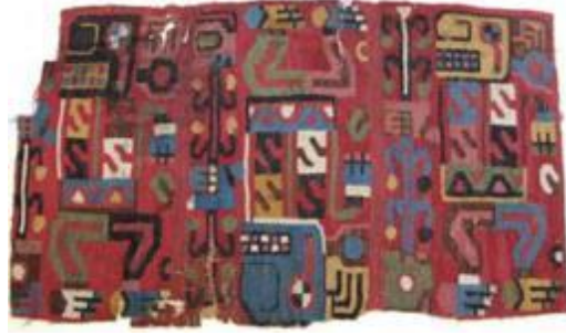
Resim 4. Wari Tekstil Parçası, MS 650-900, Yale Üniversitesi Sanat Galerisi, New Haven ( https://artgallery.yale.edu/collections/objects/59624 )

Kültürel açıdan bakıldığında, tekstillerin yüzeyinde yer alan görsellerde inançlara ait dini soyut semboller, kozmolojik ve simgesel mesajlar yer almakta, uzay ve zaman hakkında pek çok bilgi aktarmaktadır (Joslyn, 2008, s. 2).