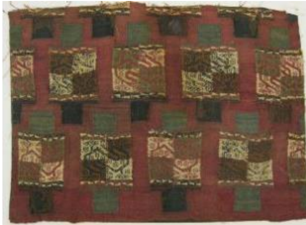
Resim 6. İnkâ / Moquegua. Tekstil Parçası, Deve lifi dokuma, 32x43 cm, 1000-1532. Brooklyn Müzesi, 29.1312.3. ( https://www.brooklynmuseum.org/opencollection/objects/142940 )