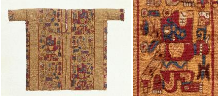
Resim 5. Wari Tuniği, Pamuk ve deve tüyü elyafı, 22,1x31,8 cm Peru, MS 500-800. Brooklyn Müzesi, 71.180. ( https://www.brooklynmuseum.org/opencollection/print/object/98046 )

Kültürel açıdan bakıldığında, tekstillerin yüzeyinde yer alan görsellerde inançlara ait dini soyut semboller, kozmolojik ve simgesel mesajlar yer almakta, uzay ve zaman hakkında pek çok bilgi aktarmaktadır (Joslyn, 2008, s. 2).