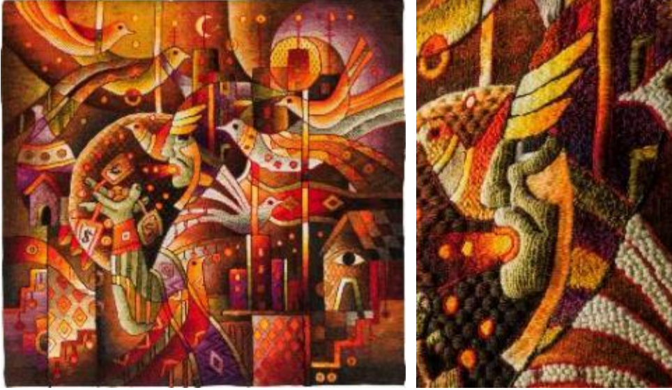
Resim 30. "Bereket Enerjisi", Maximo Laura, Tapestry Dokuma, 120x120 cm, 2018.