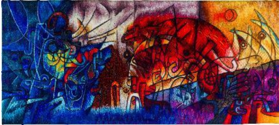
Resim 13. "Jaguar'ın Kutsal Nefesi", Maximo Laura, Hand-Woven Tapestry, 106x240 cm, 2019.