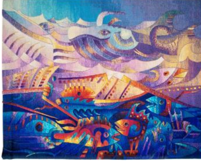
Resim 23. Tapestry yaratım süreci tamamlanmış tapestry dokuma örneği. ( https://maximolaura.com/creation-process/ )