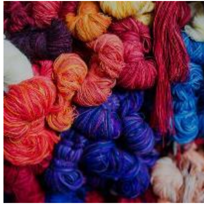
Resim 20. Tapestry yaratım süreci, rengin yorumlanma aşaması. ( https://maximolaura.com/creation-process/ )