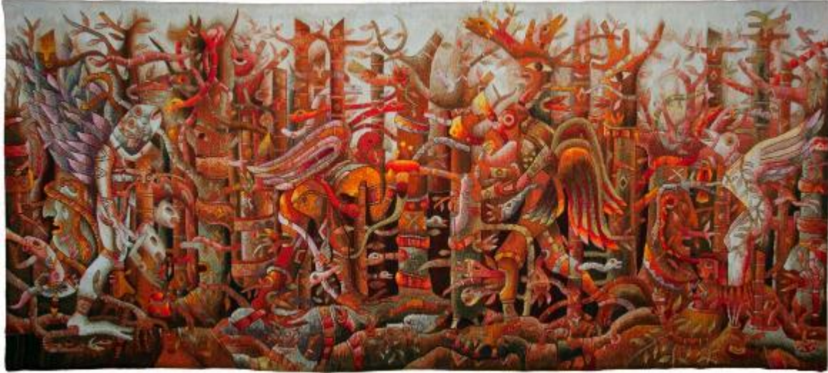
Resim 17. “Ormanda Kutsal Karşılama”, Maximo Laura, Tapestry Dokuma, 176x402 cm. ( https://maximolaura.com/creation-process/ )