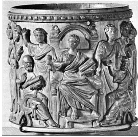
Resim 3. Berlin Pyksisi, Berlin Şehir Müzesi Koleksiyonu, V. yüzyıl.

Pagan ve Hıristiyan temaların birlikte yer aldığı sarkofağın merkezinde eğitimi olmanın ( paideia ) simgesi okuyan erkek ile evlilikte uyumun ( concordia ) sembolü olması muhtemel orans kadın figürü resmedilmiştir (Urbano, 2016: 37, fig. 3).