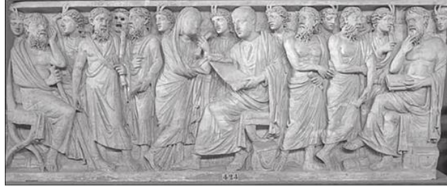
Resim 1. Pullius Peregrinus Sarkofağı, Torlonia Müzesi, 240-260.

Roma Sanatı'nda filozof betimli figürler ağırlıklı olarak erkektir. 8 Tipleminin klasik versiyonunda sakallı, 9 pallium 10 ve tunik giyimli; elinde kitap, rulo, kodeks ve/veya değnek tutmakta olan bir figür; oturur veya ayakta durur vaziyetteyken okuma, düşünme veya söylev verme/konuşma halinde betimlenir. Figür yalnız olabildiği gibi etrafında insanlar ya da ilham perileri veya erdemlerin kişileştirimleriyle çevrili olarak da betimlenebilir. Pagan sarkofaglarındaki filozof figürü 11 gömülü olan kişiyi temsil eder; kimi örneklerde bu kişiyi çevreleyen figürlerde de filozoflara atfedilen giysi/sakal kodlarının kullanıldığı görülür (Resim 1). Hıristiyan sarkofaglarında rastlanan filozof figürü 12 ise İsa'yı, sarkofagda yer alan sahnelerdeki diğer figürleri ve/veya sarkofagda gömülü olan kişiyi betimlerken kullanılır (Resim 2). Filozof/öğretmen betimleri sarkofaglar dışında katakomplar ve taşınabilir objelerde de resmedilmiştir 13 (Resim 3).