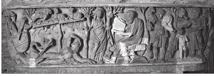
Resim 2. Santa Maria Antiqua Sarkofağı, Roma, 260-270.

Pagan ve Hıristiyan temaların birlikte yer aldığı sarkofağın merkezinde eğitimi olmanın ( paideia ) simgesi okuyan erkek ile evlilikte uyumun ( concordia ) sembolü olması muhtemel orans kadın figürü resmedilmiştir (Urbano, 2016: 37, fig. 3).