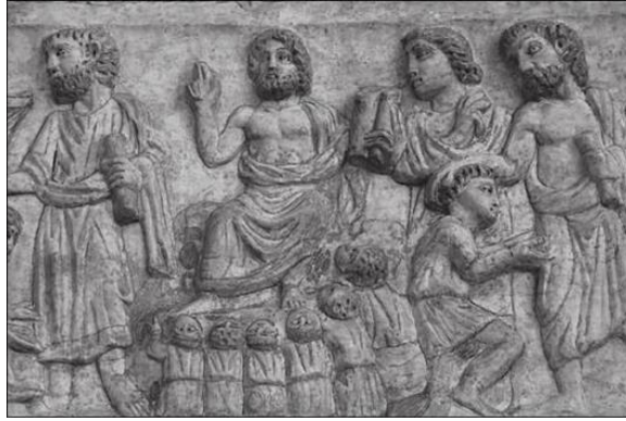
Resim 5. Filozof/Öğretmen İsa Betimli Levha Palazzo Massimo, Roma Devlet Müzesi Koleksiyonu, 290-310 civarı.

İsa bu tasvirlerde; filozof tiplemesinin klasik biçiminde görüldüğü üzere kimi zaman sakallı (Resim 5) ancak çoğunlukla sakalsız 19 (Resim 6) ve kısa saçlı, pallium ve tunik giyimli; oturur veya ayakta, elinde kitap/kodeks/rulo tutarken betimlenir. Etrafını çevreleyen öğrencilerine/dinleyicilerine hitaben konuşurken tasvir edilen filozof İsa betimleriyle anlatılmak istenen, olay üzerine kurulu bir sahne olmaktan ziyade İsa'nın erdemin öğreticisi olma vasfıdır.