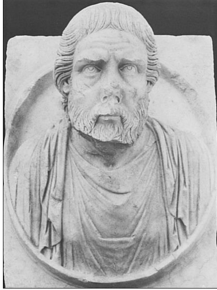
Resim 4. Filozof Büstü Atriumlu Ev, Aphrodisias, V. yüzyıl. (Smith, 1990: levha XII).