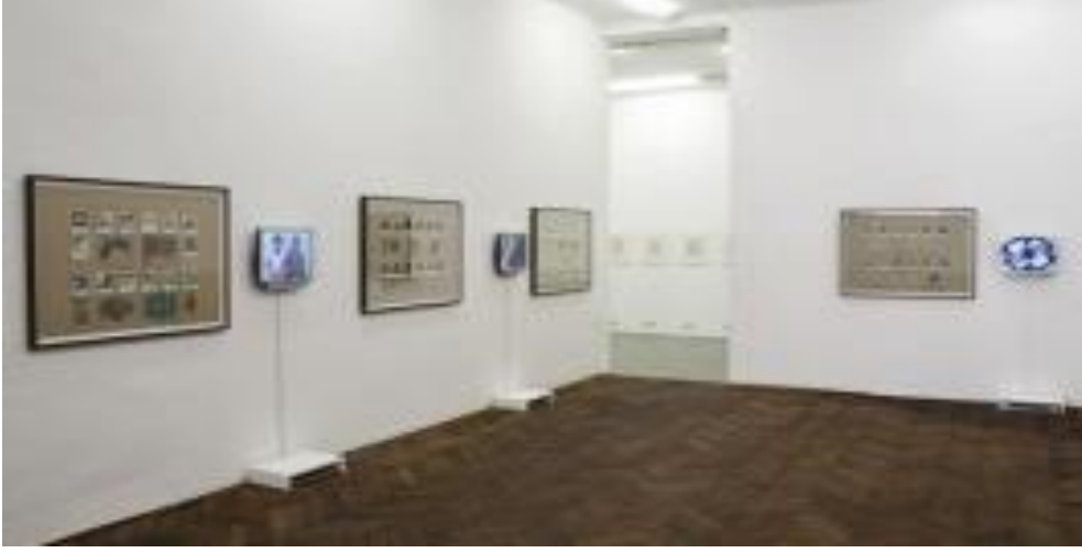
Görsel 2: Nil Yalter, Temporary Dwellings . 1974

18 Ocak 1938'de Kahire'de dünyaya gelen ve lise öğrenimini İstanbul Amerikan Robert Kolej'de tamamlayan Nil Yalter, video sanatı ve Fransız feminist sanat akımının 1970'lerdeki öncü temsilcilerinden birisidir. Paris'e bir ressam olarak giden Yalter, yaptığı ilk video çalışması ile aynı zamanda Fransız video sanatı tarihinin ilk işlerini de gerçekleştirmiş olur (Altunay, 2013:82). 70'lerden itibaren ürettiği video, performans ve yerleştirme çalışmalarında hem bu toplumsal hareketlerin hem de etnoloji biliminin etkisi, sanatçıya özgü çoğul bir estetik içerisinde gözlemlenir. Ayrıca ilk resimlerinden günümüze değin ürettiği tuvallerinde ve dijital çalışmalarında genel olarak soyut sanatın, özellikle de Rus konstrüktivizm akımının etkilerini görmek mümkündür (Toprak, 2018: 222).