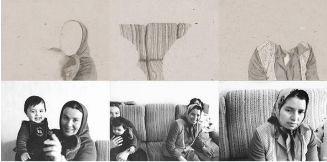
Görsel 6: Nil Yalter, Turkish Immigrants . Photos/drawings: Nil Yalter. Video: Yalter/Croiset . 1977

Türk Göçmenler. Fotoğraflar / çizimler: Nil Yalter. Video: Yalter / Croiset. 1977 Enstalasyon: Siyah-beyaz video, Paris'teki