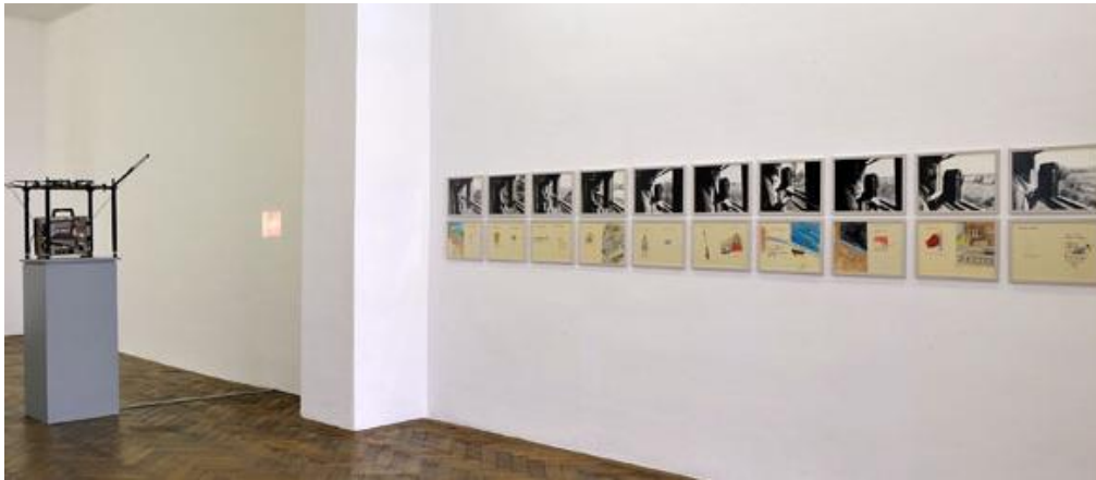
Görsel 4: Nil Yalter, Orient Express (Doğu Ekspresi) , 1976. Fotoğraflar, çizimler, 16 milimetre film. Paris ve İstanbul arasında trende çekilen polaroidler.

Sanatçının günlük yaşam akışının rutinine göre hazırladığı kolajlarda ayrıntılar oldukça dikkat çeker; örneğin İstanbul'un en popüler semtinde, çingene kadınların saçlarına taktığı çiçeklerin kurutulup estetik biçimde sunulması, gerçekçi tasarımların yanı sıra duygusal imgelerin de ipuçlarını verir. Ayrıca Temporary Dwellings 2 adlı çalışmasında da görüldüğü gibi (Görsel 3) çocuklara fazlasıyla yer verilen görsellerde çocukların bakışları, gülümsemeleri, bisiklete binmeleriyle dünyanın her yerinde aynı olan çocuk tavrını aktarırken video kaydında yine bir çocuğun konuşması bize bunu hatırlatan yeni bir araca dönüşür. Kolajlardaki metinler göçmenlik, gelip geçicilik ait olma durumlarına net mesajlarla atıf yapar. Bu kimliklere sahip çıkarak bunları kayıt altına alan Yalter sergileriyle de farklı ülkelerde dolaşıma girmesine katkı sağlar.