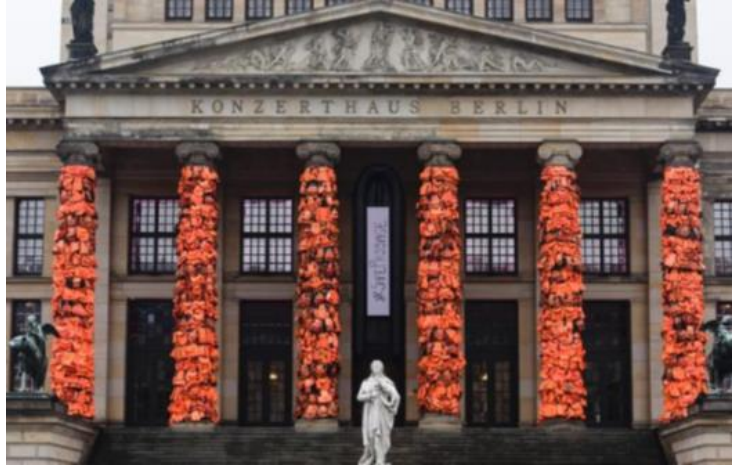
Görsel 1: Ai Weiwei'nin Berlin Konser Alanının sütunlarına bağladığı 14.000 can yelegeği