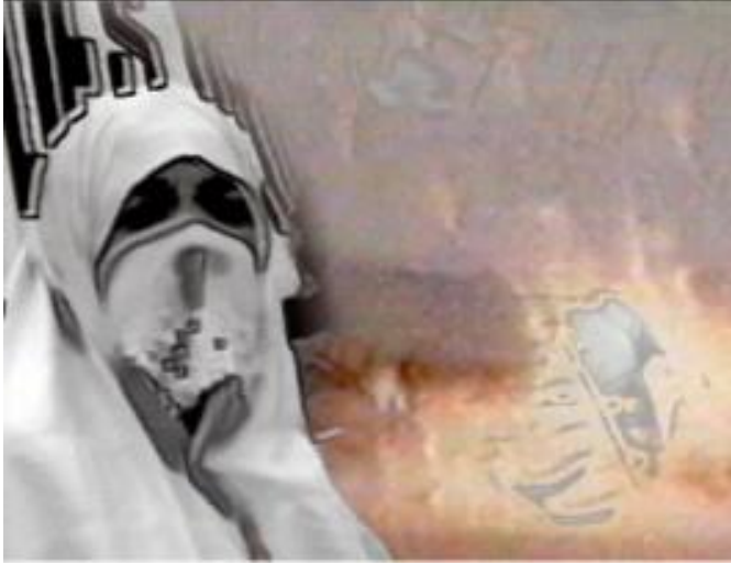
Görsel 11: Nil Yalter, Circular Rituals . "Transvoices". 1992

Hikmet ve Hasan Hüseyin Korkmazgil'in şiirleri eşlik eder. Elbette seriye eşlik eden şairlerin bu isimler olması bir tesadüf değildir. Yalter'de gurbet konusu kendi benliğinden çıkıp, işlediği konulara ve işlere eşlik eden sözcüklere kadar bir bütünlük oluşturur. Yalter'in kendisi de bir göçmandır, her zaman kadrajın dışında kalan göçmenleri eserlerinin tam ortasına yerleştirir (Görsel 11) ve elbette bu eserlerin eşlikçisi olan dizelerin sahibi şairler de hayatları boyunca gurbetliğin ne demek olduğunu bilen ve bunu işleyen şairlerdir (Epik, 2016).