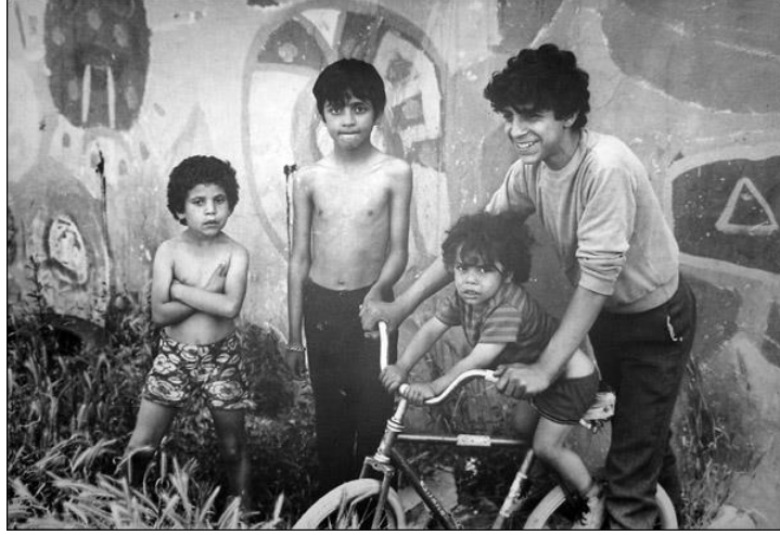
Görsel 3: Nil Yalter, Temporary Dwellings 2 . 1974

Paris, New York ve İstanbul'daki göçmenlerin geçici meskenleri üzerine polaroid, obje ve çizimler içeren 10 kolaj. Maison de la Culture. Grenoble 1977 / Maison de la Culture. Ris-Orangis 1979