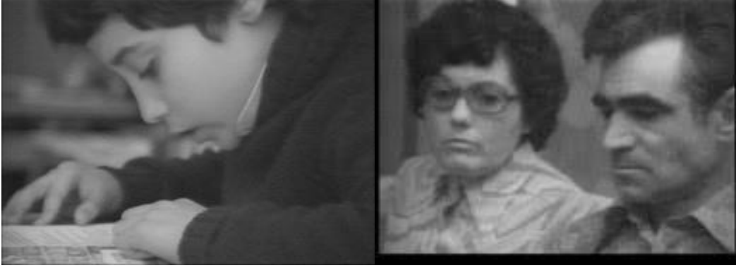
Görsel 9: Nil Yalter, Ris Orangis S&B 24 video kaseti. Maison de la Culture. Ris-Orangis 1979 Paris banliyölerinde yaşayan Portekizli göçmen işçiler hakkında bir röportaj Institut Français d'Istanbul. 2006 / Musée de l'immigration. Paris 2009

Ris Orangis adlı videosunda da Yalter (Görsel 9), izleyicisine Paris banliyölerinde yaşayan Portekizli göçmen işçiler hakkında bir röportaj kaydı izlettirmektedir. Türk göçmenlerin yaşadıklarını bir kez de Portekizli göçmenlerin ağzından aktaran bu videodaki kadın, yoğun bir isyan ifadesiyle, sokakta görünmez olmalarına, kimsenin onlara selam vermemesine, dışlanmışlıklarına ve yalnızlıklarına tepkisini dile getirmektedir.