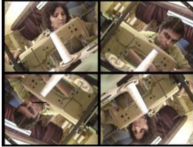
Görsel 10: Nil Yalter, Exile is a hard job . 1983 2 kanallı video enstalasyonu ve dört monitör, fotoğraflar, metinler ve resimler. Şekerleme yapan kaçak Türk göçmen işçiler, Paris. ARC Paris Modern Sanat Müzesi 1983 I / Institut Français d'Istanbul. İstanbul 2006 II / Göçmenlik Müzesi. Paris 2009 III / İstanbul Modern. İstanbul. 2011 IV

Ris Orangis adlı videosunda da Yalter (Görsel 9), izleyicisine Paris banliyölerinde yaşayan Portekizli göçmen işçiler hakkında bir röportaj kaydı izlettirmektedir. Türk göçmenlerin yaşadıklarını bir kez de Portekizli göçmenlerin ağzından aktaran bu videodaki kadın, yoğun bir isyan ifadesiyle, sokakta görünmez olmalarına, kimsenin onlara selam vermemesine, dışlanmışlıklarına ve yalnızlıklarına tepkisini dile getirmektedir.