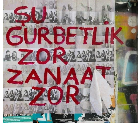
Görsel 13: Nil Yalter, Şu Gurbetlik Zor Zanaat Zor . Fotoğraflar, metinler ve resimler, afişler.

Nil Yalter 2002 'de tüm arşivlerinden faydalanarak duvar afişlerine dönüştürmüştür. Bu izinsiz yapılan afişleme ilk önce İspanya'da, sergide galeri açılışı sırasında duvarlara yapıştırılır. Hep aynı görüntüler vardır ve ölçüsü çok büyüktür ve üzerinde kırmızı boya ile o memleketin dilinde "Şu Gurbetlik Zor Zanaat Zor" yazar (Görsel 13). Bu çalışmanın ilk denemesidir. İki aşaması vardır denemenin ilk aşaması asmak ve yazıyı yazmak; ikinci aşaması ertesi günü veya iki üç gün sonra sokak baskısı sonucunda ne yaptıklarını görmek. Örneğin İspanya'da afişler istenmemiş ve yırtılmış daha sonra bu afişlerin son durumunun fotoğrafları çekilmiştir (Berkmen, 2016). Şu Gurbetlik Zor Zanaat Zor serisi I, II, III şeklinde numaralanmışken, sonrasında yapılan çalışmaların güncellenmesi ve yeni bir dil kazanmasıyla, işler duvar afişlerine dönüştü ve seri bu noktadan sonra Walls (Duvarlar) olarak adlandırıldı (Görsel 14 ve 15). Bu afişleme çalışmaları Mumbai, Fransa, Viyana ve Türkiye'de yapılmıştır. Yalter her döneminde göçmenlerle yaşayarak, konuşarak, çizerek, yazarak iletişime geçmiştir; Walls (Duvarlar) serisi ile bu iletişim kanallarına bir yenisini eklediği görülmektedir.