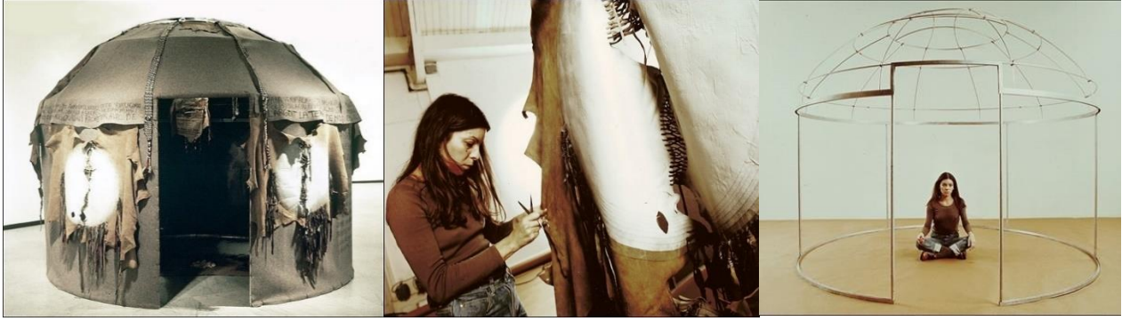
Görsel 5: Nil Yalter, Topak Ev . 1973

Museum of Modern Art of Paris 1973 / Museum of Tessé. Le Mans 1974 / Project 74 Köln 1974