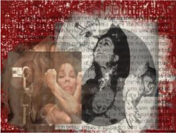
Görsel 12: Nil Yalter, Skin Story (Ten Hikayesi) , 2003 Etkileşimli CD-ROM.

Video kaseti 1. Cezayir sokaklarında protesto eden kadın göçmen işçilerin video görüntüleri aracılığıyla Avrupa'nın çok kültürlü deneyimini yansıtıyor. Whitney Müzesi. New York. 1992 / Centre Georges Pompidou. Paris 1992 / Amerikan merkezi. Paris 1992 / Aksanat, Centre d'Art Contemporain. İstanbul 1994