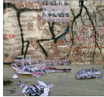
Görsel 15: Nil Yalter, Walls. Demolition . 2012

El Exilio Es Un Duro Trabajo V (Şu Gurbetlik Zor Zanaat Zor V serisi)