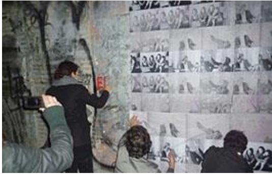
Görsel 14: Nil Yalter, Walls. Construction . 2012

Nil Yalter 2002 'de tüm arşivlerinden faydalanarak duvar afişlerine dönüştürmüştür. Bu izinsiz yapılan afişleme ilk önce İspanya'da, sergide galeri açılışı sırasında duvarlara yapıştırılır. Hep aynı görüntüler vardır ve ölçüsü çok büyüktür ve üzerinde kırmızı boya ile o memleketin dilinde "Şu Gurbetlik Zor Zanaat Zor" yazar (Görsel 13). Bu çalışmanın ilk denemesidir. İki aşaması vardır denemenin ilk aşaması asmak ve yazıyı yazmak; ikinci aşaması ertesi günü veya iki üç gün sonra sokak baskısı sonucunda ne yaptıklarını görmek. Örneğin İspanya'da afişler istenmemiş ve yırtılmış daha sonra bu afişlerin son durumunun fotoğrafları çekilmiştir (Berkmen, 2016). Şu Gurbetlik Zor Zanaat Zor serisi I, II, III şeklinde numaralanmışken, sonrasında yapılan çalışmaların güncellenmesi ve yeni bir dil kazanmasıyla, işler duvar afişlerine dönüştü ve seri bu noktadan sonra Walls (Duvarlar) olarak adlandırıldı (Görsel 14 ve 15). Bu afişleme çalışmaları Mumbai, Fransa, Viyana ve Türkiye'de yapılmıştır. Yalter her döneminde göçmenlerle yaşayarak, konuşarak, çizerek, yazarak iletişime geçmiştir; Walls (Duvarlar) serisi ile bu iletişim kanallarına bir yenisini eklediği görülmektedir.