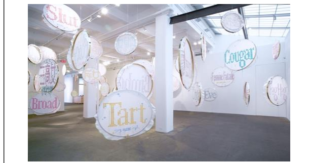
Görsel 2: Lin Tianmiao, "Badges", 2011, beyaz ipek, renkli ipek iplik, metal nakış kasağı, Galerie Lelong, New York

ilişkin kabulleri ve önermeleri sorgulayarak, bunlara alternatif teknikler ve malzemeler sunmuştur. Böylece sanatçının ve izleyicinin rolü yeniden biçimlendirilmiş, sanatın ve sanat yapıtının tanımını genişletilmiştir(Koşar,2007:2040). Güncel sanatta malzeme dağarcığının genişlemesi sanatçılara sınırsız olanaklar sunmuştur. Sanatçılar disiplinlerarası yaklaşımlarla yeni söylemler ve teknikler geliştirmiştir. Geleneksel teknikleri yeniden ele alan sanatçılar, çeşitli mecralarda özgün üretimler ortaya koymuşlardır. Farklı disiplinlerde karşımıza çıkan tekstil alanına ait malzemelerin ve tekniklerin kullanım örneklerine sıklıkla rastlanmaktadır. Sürekli arayış içinde olan sanatçılar için geleneksel ve güncel birlikteliğinin kullanımı ilgi çekici olmuştur. Bu birliktelik günümüzde farklı şekillerde ortaya çıkabilmektedir. Malzeme ve tekniği sabit tutarak sergileme yaklaşımında farklılığa gidilebildiği gibi, farklı yüzey değişkenlerinin kullanımı ile malzeme ve tekniklerde değişiklik yapılabilmektedir(Görsel 2).