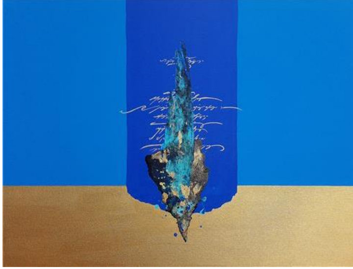
Resim 6. Seyit Mehmet Buçukoğlu, İmzalı, Tuval Üzerine Karışık Teknik, 60 cm x 80 cm, 2019 (Buçukoğlu, 2020)

Günümüz resim sanatçılarından Aylin Beyoğlu "Kılavuzu karga olanın" atasözünden yola çıkarak hazırladığı resimlerinde "kılavuz ve kimliksiz" ismiyle İngilizce Latince yazılar kullanmıştır (Resim 7). Atasözünde anlatılmak istenenin aksine, oldukça zeki olan ve uzun yaşayan bir hayvanın kılavuzluk yapabileceğini dolayısıyla resimlerinde de bu düşüncesini anlatmaya çalıştığını belirtmektedir (Mistikalem, 2017).