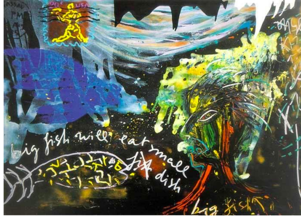
Resim 4. Bedri Baykam, Büyük Balık Küçük Balığı Yer, Tuval Üzerine Yağlıboya, 150 cm x 200 cm (Turkish Paintings, 2020)