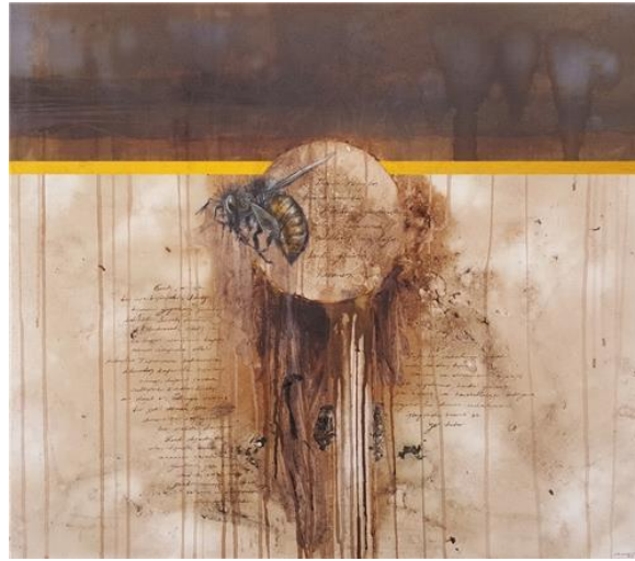
Resim 5. Seyit Mehmet Buçukoğlu, İmzalı, Tuval Üzerine Karışık Teknik, 70 cm x 80 cm, 2017 (Buçukoğlu, 2020)