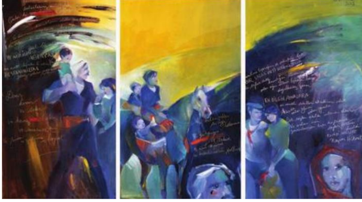
Resim 3. Kayıhan Keskinok, Kuvayı Milliye, Derici Kağıdı Üzerine Yağlıboya, Üçlü, 3x(142 cm x 70 cm), 2002 (Keskinok Sanat Vakfı, 2017)