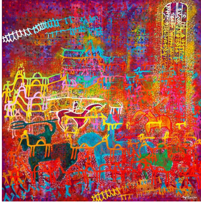
Resim 8. Rauf Tuncer, İsimsiz, Tuval Üzerine Akrilik, 130 cm x 130 cm (Gazi Üniversitesi, 2020)

Son dönem ressamlarımızı incelediğimizde; yazı ve resim dilini bir arada kullanarak eserlerinde kültürel değerleri yansıtan sanatçıların da olduğunu görmekteyiz. Bu sanatçılardan ikisi de Rauf Tuncer ve Gültekin Akengin'dir. Sanatçıların eserlerinde kültürel sembol ve motiflere runik alfabe yazılar eşlik etmekte ve Türk kültür tarihi vurgulanmaktadır (Resim 9, 10).