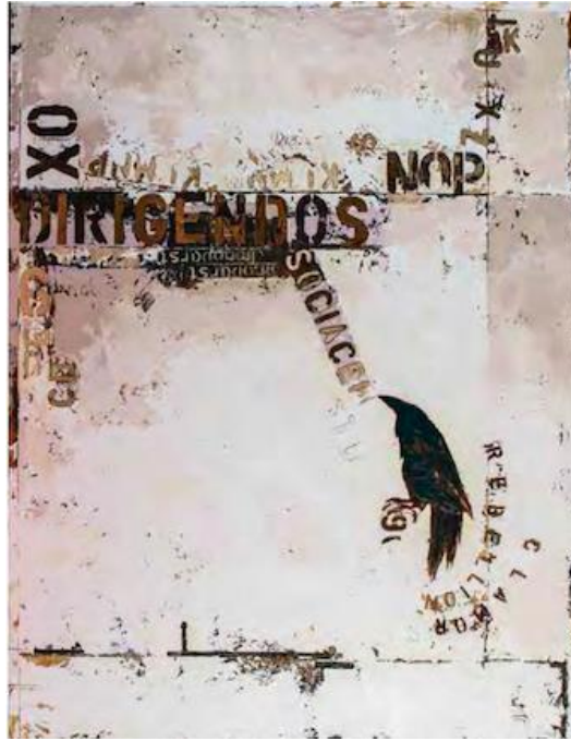
Resim 7. Aylin Beyoğlu, Kılavuz 6, Tuval Üzerine Yağlıboya, 145 cm x 110 cm (Kültür Portalı, 2015)

Günümüz resim sanatçılarından Aylin Beyoğlu "Kılavuzu karga olanın" atasözünden yola çıkarak hazırladığı resimlerinde "kılavuz ve kimliksiz" ismiyle İngilizce Latince yazılar kullanmıştır (Resim 7). Atasözünde anlatılmak istenenin aksine, oldukça zeki olan ve uzun yaşayan bir hayvanın kılavuzluk yapabileceğini dolayısıyla resimlerinde de bu düşüncesini anlatmaya çalıştığını belirtmektedir (Mistikalem, 2017).