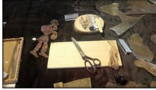
Resim 12. Karagöz Hacivat materyal örnekleri Karagöz Evi M. Sergi salonu