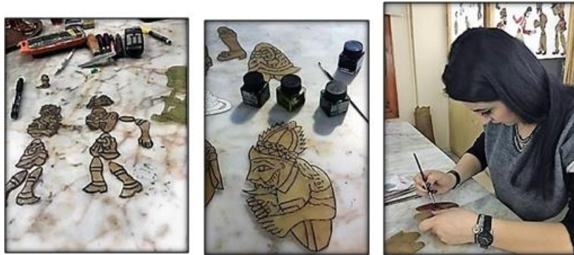
Resim 6. Karagöz tasvirini ekolin boya ile boyama

Boyanan tasvirlerin kol, bacak, gövde kısımları misina, naylon veya kat-küt adı verilen ipliklerden biri ile bağlanmaktadır. Tasvirlerin elbiselerinin üzerine çiçek zımbası ile ay, çiçek ve yıldız şeklinde süslemeler yapılmaktadır. Ayrıca oynatma çubuklarının yerleri zimbalarla açılmaktadır. En son olarak tasvirlerin her iki tarafı boyaların üzerine cila yapmak üzere saf zeytinyağı ile parlatılmaktadır. Karagöz tasvirlerinin oynatılması için 50cm. boyunda, gürgen ağacından elde edilen çubuklar kullanılıyor. Bu çubuklarla tasvirlerin dengede kalması sağlanmaktadır. Karagöz tasvirleri günümüzde patiskadan ya da Amerikan bezinden yapılan ölçüleri 80 veya 120cm veya 130 cm olan perdede oynatılmaktadır. Perdenin arkasında 200-250 watt bir spot lamba 20-30 cm mesafeden görülmeyecek şekilde perdeye yansıtılmaktadır. Araya mesafe konularak lambanın perdeye zarar vermesi engellenmektedir.