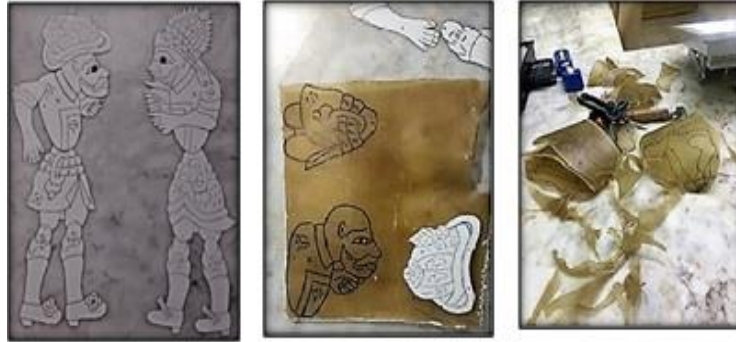
Resim 4. Karagöz tasvir kalıpları ve deriye uygulanıp, kesilmesi.

Tasvir yapımında uygun deri seçimi yapıldıktan sonra sıra kalıpların deriye işlenmesidir. Karagöz tasvirlerinin çeşitli kalıpları bulunmaktadır. Karagöz oyunundaki her tipin ve göstermeliklerin kâğıtlara profilden kalıpları çizilmektedir. Birçok tasvir yapımcısı genellikle ustasından öğrendiği hazır kalıpları kullanmaktadır. Deri kalıbın üzerine konarak ya da deri ile kâğıdın arasına karbon kâğıdı konarak üzerinden kurşun kalemle bastırmadan şekil deriye çizilmektedir (Resim 4).