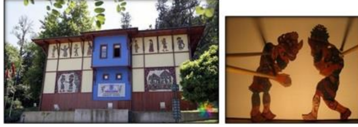
Resim 11. Karagöz Evi Müzesi