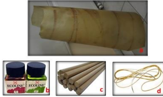
Resim 3. Karagöz tasvir yapımında kullanılan gereçler; a. deri, b. ekolin boya, c. çubuk, d. kat küt