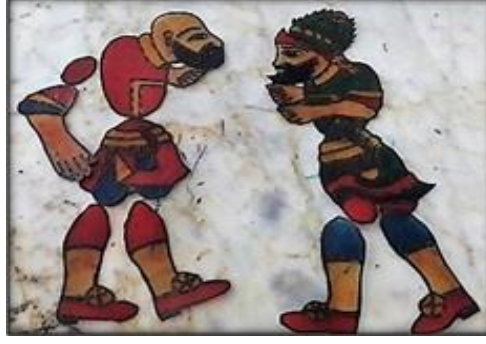
Resim 7. Karagöz Hacivat deri tasvir örneği