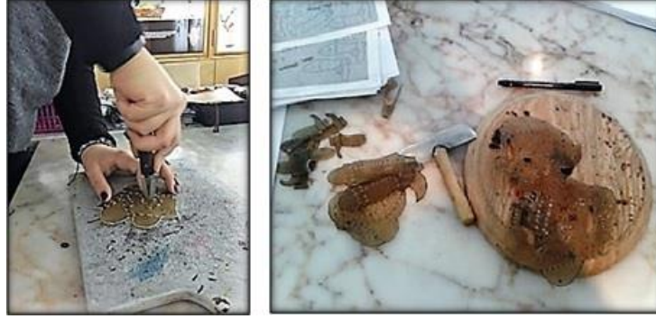
Resim 5. Nevregan bıçağı ile oyma tekniği

Boya olarak genellikle kök veya kimyasal boyalar kullanılmaktadır. Boyamak için boya sırasında çeşitli kalınlıkta boya fırçaları kullanılmaktadır. Kimyasal boyalardan ekolin boya tercih edilmektedir (Resim 6). Önemli olan boyanın renklerinin iyi ve canlı olması, solmamasıdır. Önce ten rengi olacak kısımlar boyanır. Sonra giysi kısımları, çiçekler süsler ve dekor aksesuarlar boyanır. Siyah boyayla kaş, göz, burun, ağız, sakal boyandıktan sonra kenar çizgileri boyanır. Deri tasvirlerinin her iki tarafı da boyanmaktadır.