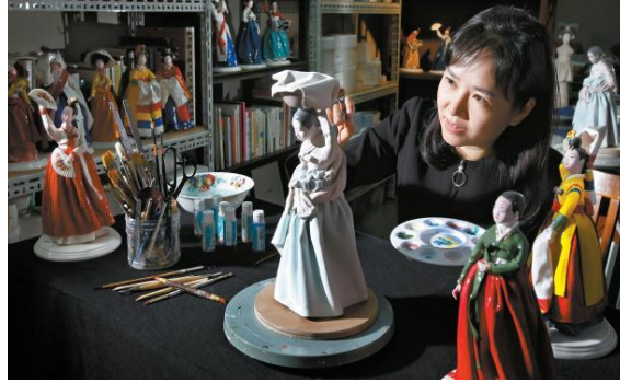
Resim 14. Oh Joo-Hyun porselen bebekleri ile

Japonya hariç Uzakdoğu ülkelerinin çoğunda geçmişe yönelik araştırma yapıldığında o ülkelere ait olduğu kesin olarak bilinen bir porselen bebek görseline ulaşılamamıştır, incelenen tüm Uzakdoğu bebekleri arasında da önemli ölçüde farklılığa rastlanmamaktadır. Tarihsel süreci, kaynak yetersizliğinden dolayı incelenemese de Kore'de geleneksel porselen bebekler hakkında bazı sonuçlara ulaşılabilmektedir. Çağdaş Koreli sanatçılardan Oh Joo-Hyun'un porselen bebekleri, detayları ile dikkat çekmektedir. Geleneksel kıyafetleri ile görülen bebeklerde kumaş veya farklı bir materyal bulunmayıp tamamı porselendir. Sanatçı, renklendirmede sıraltı boya ve şeffaf sır kullanmaktadır.