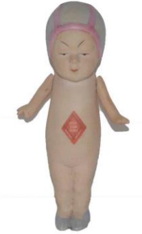
Resim 10. Queue San Baby

Replika olmayan porselen bebeklerin pek çoğu karakter bebeği (character doll) sınıfında değerlendirilmektedir. Görünüşlerinde ve yüz ifadelerinde klasik, Avrupa tipi porselen bebekten farklı olarak kendilerine has dokunuşlar vardır. Karakter bebeklerinin bir örneği Morimura Brothers'a ait özgün üretimlerden biri Queue San Baby isimli tam sırsız porselen bebettir. Görsel 9'da Queue San bebeğin yalnızca kollarının eklemli olduğu görülmekte, göğsündeki "Queue San Baby" etiketi göze çarpmaktadır. Görünüş olarak Queue San bebeğe biraz benzeyen Cho-Cho San bebek de tam sırsız porselendir, ek olarak bacakları da eklemli olup oturabilmektedir (Van Patten, 2001).