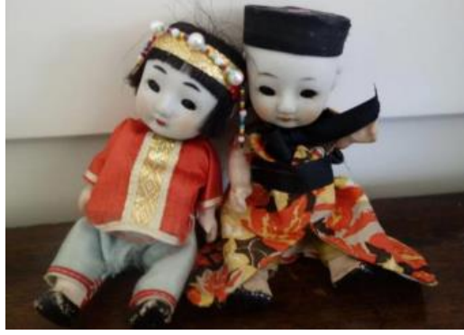
Resim 13. Çin yapımı porselen bebekler

Japonya hariç Uzakdoğu ülkelerinin çoğunda geçmişe yönelik araştırma yapıldığında o ülkelere ait olduğu kesin olarak bilinen bir porselen bebek görseline ulaşılamamıştır, incelenen tüm Uzakdoğu bebekleri arasında da önemli ölçüde farklılığa rastlanmamaktadır. Tarihsel süreci, kaynak yetersizliğinden dolayı incelenemese de Kore'de geleneksel porselen bebekler hakkında bazı sonuçlara ulaşılabilmektedir. Çağdaş Koreli sanatçılardan Oh Joo-Hyun'un porselen bebekleri, detayları ile dikkat çekmektedir. Geleneksel kıyafetleri ile görülen bebeklerde kumaş veya farklı bir materyal bulunmayıp tamamı porselendir. Sanatçı, renklendirmede sıraltı boya ve şeffaf sır kullanmaktadır.