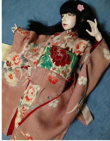
Resim 22. Azusa Chiyoda, "Beatitude in the Distance", 2015 ( behance.net/mayerlinglc379 )

Resim 22'deki bebekte Japon esintileri rahatlıkla gözlemlenebilmektedir. Bebeğin kostüm ve saç modelinden sanatçının yaşadığı coğrafyaya dair kültürel özellikleri eserlerine yansıttığı sonucuna ulaşılmaktadır. Chiyoda'nın diğer bebeklerinde de sıklıkla kullandığı benzer kostümler, saç şekilleri ve duruşlar Resim 23'teki örnekte görülmektedir (Resim 23).