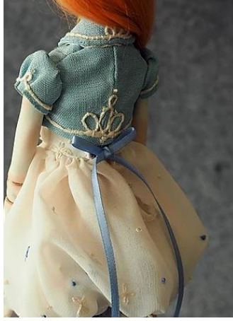
Resim 20. Zulu Kam, "Cloud in Garden-Sparrow", 2018, (zuminousdoll.com/gallery)

Zulu Kam'ın porselen bebekleri, günümüzde dünya çapında sık rastladığımız özellikte eklemli bebeklerdir. Aynı zamanda bebeklerin hem yüzleri ve fiziklerinde hem kostümlerinde sanatçının doğduğu coğrafyanın etkilerine rastlanmamaktadır.