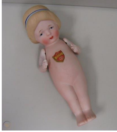
Resim 7. Baby Belle

Nippon döneminde üretilen özgün Japon porselen bebekler arasında hem tam sırsız porselen hem de sadece başı porselen olan bebekler bulunmaktadır. 1915'te Alman bir firma tarafından lisansı alınsa dahi Japonya'da Morimura Brothers tarafından da üretilen Baby Bud, tam sırsız porselen bebeklerden biridir. Nippon versiyonunun sırt kısmına "Baby Bud" ismi kazınmıştır (Van Patten, 2001). Morimura Brothers'a ait Baby Belle ve Baby Darling bebekleri de tam sırsız porselen bebeklerdir ve farklı boyutlarda üretilmişlerdir. Morimura Brothers, replika bebekleri ile göze çarpsa da özgün porselen bebekler de üretmiştir.