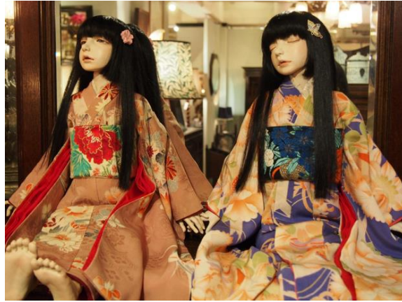
Resim 23. Azusa Chiyoda, "Beatitude in the Distance" (solda) ve "Slumber" (sağda), 2015 ( behance.net/mayerlinglc379 )

Resim 22'deki bebekte Japon esintileri rahatlıkla gözlemlenebilmektedir. Bebeğin kostüm ve saç modelinden sanatçının yaşadığı coğrafyaya dair kültürel özellikleri eserlerine yansıttığı sonucuna ulaşılmaktadır. Chiyoda'nın diğer bebeklerinde de sıklıkla kullandığı benzer kostümler, saç şekilleri ve duruşlar Resim 23'teki örnekte görülmektedir (Resim 23).