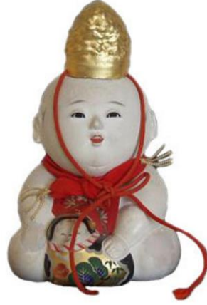
Resim 5. Goshō bebeği

Japonya'nın farklı bölgelerinde farklı materyallerin sık kullanıldığı görülmektedir. Örneğin, Tokyo'da metal kullanımı öne çıkarken kağıt bebekler Osaka'da yaygınlaşmıştır, porselen bebekler konusunda ise Kyoto ve Fukuoka göze çarpmaktadır (King, 1977). Porselen dendiğinde ilk akla gelen yerlerden biri olan Uzakdoğu'da özellikle Birinci ve İkinci Dünya Savaşları arasındaki dönemde Avrupa tarzı çok sayıda bebeğe ulaşılmaktadır. Bunun sebebinin ise, o döneme kadar porselen bebek konusunda çok ustalaşmış olan Almanya'nın savaş döneminde geride kalması ve diğer ülkelerin bu durumdan faydalanarak kendi üretimleri olan bebekleri ihraç etmeleri olduğu düşünülmektedir.