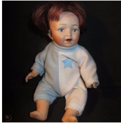
Resim 8. Baby Ella

Yine Morimura Brothers'a ait bir replika olan Baby Ella bebeğinin yalnızca başı porselen, vücudu ise kompozittir. Baby Ella da farklı boyutlarda satışa sunulmuştur. Aynı firmanın ürettiği Baby King'in yine yalnızca başı porselen ve vücudu kompozittir fakat bu bebekte gofun kullanılmıştır (Van Patten, 2001). Ağız açık ve gözleri canlı renkte modellenmiştir, ağız açık modellenen porselen bebeklere genel olarak daha az rastlanmaktadır.