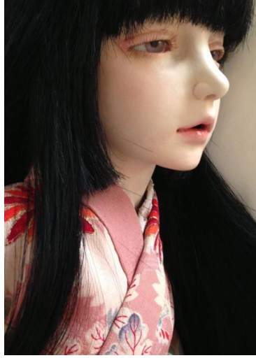
Resim 21. Azusa Chiyoda, "Beatitude in the Distance", 2015 (behance.net/mayerlinglc379)

Porselen ile çalışan bir diğer bebek sanatçısı ise Azusa Chiyoda'dır. Japon sanatçının bebeklerinde geleneksel kıyafetlere yer verdiği göze çarpmaktadır. Bebeklerin en çarpıcı özelliği, yüz hatlarında ve ifadede gerçekçiliğin ön planda tutulmasıdır.