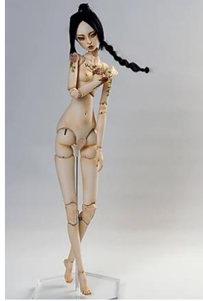
Resim 17. Zulu Kam, "Tancho", 2019 (zulu-luminousdoll.com/gallery)

Porselen ile art-doll kategorisinde bebekler üreten sanatçılardan biri de Çinli sanatçı Zulu Kam'dır. Sanatçı, Zulu Luminous Dolls adı ile bebeklerini markalaştırmıştır. Bebekleriyle aynı stilde illüstrasyonları da olan sanatçı, eklemli porselen bebekler üretmektedir.