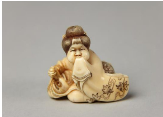
Resim 1. Japon kültüründe bazı bebekler (Baten, 1988)

İlkel birer bebek örneği sayılabilecek ilk figürin örneklerinden biri netsukelerdir. “Wakun No Shiori” (Geleneksel Japonca Sözlük) ye göre netsuke, asılan küçük obje anlamına gelmektedir (Bushell, 1961). Minyatür heykelcikler olan netsukeler hem Çin’de hem Japonya’da karşımıza çıkmaktadır. Ahşap, fildişi ve kemikten oyulanları olduğu gibi zaman içerisinde mercan, inci ve değerli metallerle süslenenleri de yapılmıştır. Netsukeler Japon geleneksel erkek elbisesinin bir kısmına düğme olarak, tütün kesesi ve ilaç kutusu gibi objelere de düğme benzeri bir işlev görmesi için takılmaktadır (britannica.com).