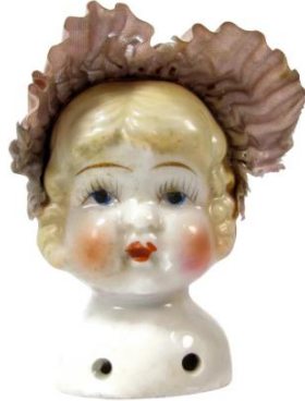
Resim 6. Japon yapımı pekişmiş çini bebek başı

Pekişmiş çini bebekler genellikle baş ve omuzlar olarak modellenip kumaş bir vücuda dikilmek üzere için alt kısmında delikler açılmaktadır. Bu türün özelliği, tenin bünye renginde bırakılıp sadece ağız, göz ve yanakların sır altı boya ile renklendirilmesi ve ardından şeffaf sırla sırlanmasıdır. Pekişmiş çini bebek başları, saçlarla birlikte veya şapkalı modellenebilmektedir. Resim 6'da Japon yapımı, kumaş şapkalı bir pekişmiş çini bebek görülmektedir.