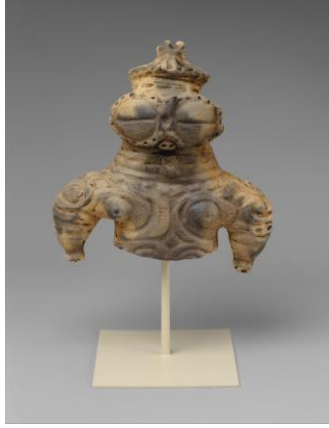
Resim 3. Dogu örneği (metmuseum.org)

Bazı geleneksel Japon bebekleri kökenini ilkçağ animlizminden almaktadır, bunlara örnek olarak “dogu” ve “haniwa” gösterilebilir (Sonobe, 1965). Jomon döneminden ulaşan “dogu”lar pişmiş topraktan olup genellikle doğurganlığı simgeleyen kadın figürleridir. Bulunan çoğu “dogu”nun kasten kırılmış gibi görünmesi, bir çeşit tedavi ritüelinde kullanıldığını düşündürmektedir. Bu yaklaşıma göre, hastalık, törenle hastadan figüre aktarılmakta, sonra figür kırılarak yok edilmekte veya gömülmektedir (metmuseum.org). Yine pişmiş topraktan yapılan “haniwa”lar ise pek çok kültürde benzerine rastlanan, ölü ile birlikte gömülen veya törenlerde kullanılan cenaze bebekleridir. Kelime anlamı olarak “kil çemberi” anlamına gelen içi boş ve sırsız haniwalar, sucuk yöntemi ile doğrudan içi boş olarak yapılmaktadır (Frédéric, 1996).