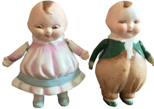
Resim 12. Happifats bebekler