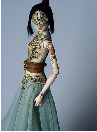
Resim 18. Zulu Kam, "Tancho", 2019 (zuminousdoll.com/gallery)

Resim 17 ve 18'de görülen bebeğin adı "Tancho"dur. Sanatçı Tancho'nun üzerine dekor ile dövme benzeri çiçek motifleri işlemiştir.