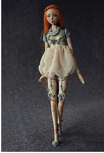
Resim 19. Zulu Kam, "Cloud in Garden-Sparrow", 2018, (zuminousdoll.com/gallery)

Zulu Kam'ın bebekleri genellikle seriler halinde karşımıza çıkmaktadır. "Sparrow", "Manu", "Oleander" gibi isimler verdiği bebek modellerini seçtiği temalara uyarlayarak dekorlamakta, bebek kostümlerini de yine bu temalar çerçevesinde hazırlamaktadır. Tancho'nun da dahil olduğu "Skeleton" (İskelet) serisinde bebeklerin kostümlerinde iskeleti andıran aksesuar ve işlemler göze çarpmaktadır. Sanatçı, İskelet serisinde ölümden sonra yaşam teması üzerinde durmaktadır. "Cloud in Garden" (Bahçede Bulutlar) ise bir başka seri olarak karşımıza çıkmaktadır, bu seride bebeklerin görsel etkisinin çok daha sakin ve yumuşak olduğu sezilmektedir. Aynı zamanda kostümlerde de bulutları andıran işlemler bulunmaktadır. Seriden bir bebek, Resim 19'da görülmektedir.