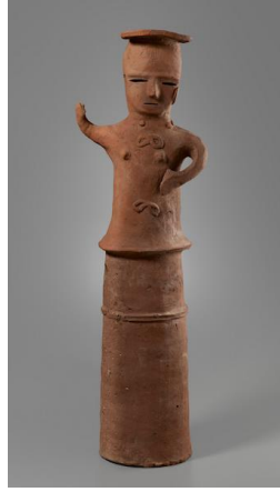
Resim 4. Haniwa örneği (metmuseum.org)

Kumaş, ahşap, fildişi, kemik ve pişmiş toprak gibi başka kültürlerde de bebek yapımında kullanılan malzemelerin yanı sıra Uzakdoğu'ya has bazı malzemelerle de karşılaşmaktadır. Örneğin Gosho bebekleri porselen ve ahşaptan yapılabildiği gibi gofun adı verilen bir bileşimden de üretilebilmektedirler. Gosho bebekleri genellikle bir erkek bebek temsilidir, giysileri minimaldir veya yoktur. Beyaz tenli ve başı orantısız derecede büyüktür. Seramik çamurundan yapılan Gosho bebekleri gofun ile kaplanmaktadır. Gofun, yapıştırıcı ve toz haline getirilmiş istiridye kabuklarından yapılan bir eşit macun olarak tarif edilmektedir (Baten, 1988).