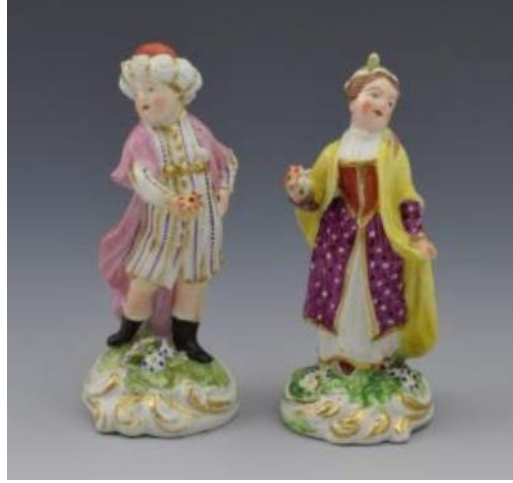
Resim 7. Türk Porselen Figürleri, Derby, 18. Yy. (Cengiz, 2019: 145)

18. yüzyılın sonuna doğru giderek azalan Türk figürü örneklerinin bir devamı niteliğinde, birkaç yeni figür daha üretilmiştir. Bu figürler genellikle rokoko canlanmasına bağlanabilecek değişik bir porselen grubunun parçası olarak görülebilir. 1793 yılında kurulan Minton imalathanesinde Herbert Minton, Sèvres ve Meissen'in sofistike figürlerini kalıp yöntemiyle çoğaltarak, mermerimsi, pürüzsüz bir dokuda, figürün ön planda olduğu, saf beyaz renkte üretimlerde bulundu. Bu gelişme, seramik alanında 19. yüzyılın en büyük yeniliklerinden biriydi (Hildyard, 2009: 112). Minton imalathanesinin üretimleri arasında, Padişah, Hanım Sultan, Sedirde Uzanan Türk ve Kadın Figür gibi modeller vardı. Figürlerin altına genellikle, 18. yüzyılın geleneğine uygun olarak kabartmalı, sarmal motif desenli kaideler de eklenmişti.