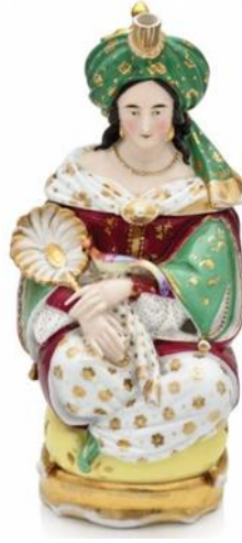
Resim 4. Sultan, Fransız İmalatı, (t.y.) (artam.com, 2020)

Avrupalı porselen biblo sanatçıları, Çin porselen tekniğinin (neredeyse 1500 yıllık bir gecikmeden sonra) kendi ülkelerine gelmesiyle birlikte, sanatsal ve teknik hünerlerini sergilemeye başladılar. Toplumun ilgi duyduğu her konuyu onlar sanatları ile biblolara aktardılar (Arcasoy, 2013: s.y.). Avrupa’da, Kändler’den sonra figür modelleme konusunda en ünlü Alman sanatçılarından birisi de Johann Peter Melchior’dur. Höchst porselen fabrikasında, 1767’den 1979 yılına kadar baş modelci olarak çalışmıştır. Melchior’un eserlerinde, Rokoko ve Neoklasik tarzlar arasında bir geçiş olduğu görülür. Zarif ve duygusal çalışmaları dikkat çekicidir (britannica.com, 2020). Höchst imalathanesi, özellikle, elinde tütün çubuğuyla tütün ve kahve iç en, oturan Türk figürü örnekleri gibi, Osmanlılara özgü unsurların kullandığı modeller yaratmıştır.