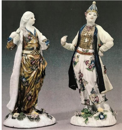
Resim 1. Türk Figürleri, J.J. Kändler, Meissen, 1748 (Sandon, 2010: 46)

18. yüzyılın en büyük ve en yaratıcı porselen heykeltıraşı olarak kabul edilen Kändler, 1733 yılında, Meissen'e baş modelci olarak atanmıştı. Modellerini meyve ağacından oyardı ve bu modeller üzerinden kalıplar alırdı. Bu teknik, alçı, balmumu ya da kilden yapılan modellere oranla daha keskin ayrıntıları mümkün kılardı (Çeşitli, 2009: 186). Meissen porselen fabrikasının usta modelcisi Johann Joachim Kändler'in modellediği Türk giysileriyle tasvir edilmiş bir çift porselen figür, fırça ile yapılmış dekorlarındaki dikkat çekici mavi rengi, yıldız süslemeleri ve adeta bir rol oynuyormuş gibi hareketli betimlemeleriyle dikkat çekicidir (Resim 1).