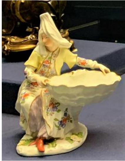
Resim 6. Karamanlı Kadın, Meissen, Faszination Rokoko Sergisi-Hetjens Müzesi, (t.y) (Filiz Adıgüzel Toprak, 2020)

Meissen imalathanesinin Türk figürleri, İngiltere'de kurulan Bow ve Chelsea imalathanelerinin üretimlerine de yansımıştır. İlk olarak 1746'da, Meissen'de üretilen Karamanlı Kadın figürünün bir kopyası, İngiltere'de üretilmiştir. Figürler karşılaştırıldığında, modelin duruşunun, elinde taşıdığı kabın, başlığının, kıyafetinin modelinin bire bir aynısı olduğu görülür (Resim 6).