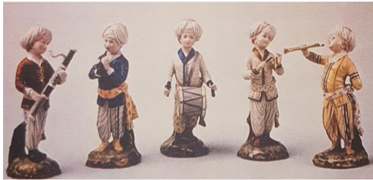
Resim 5. Mehter Figürleri, Melchior, 1778 (Arcasoy, 2004: 43)

Müziyen biblolarına da Avrupa porselen sanatında çok rastlanır. Melchior’un, Höchst için 1778 yılında tasarladığı Türk müziyenleri serisindeki figürler, Osmanlı Mehter Takımından esinlenerek yorumlanmıştır. Mehter Figürleri’ndeki müziyenler oldukça farklı giysiler içindedir ve her biri, elinde, fagot, obua, korno, triangle gibi batı kökenli farklı çalgılar tutmaktadır (Arcasoy, 2004: 42-43) (Resim 5).