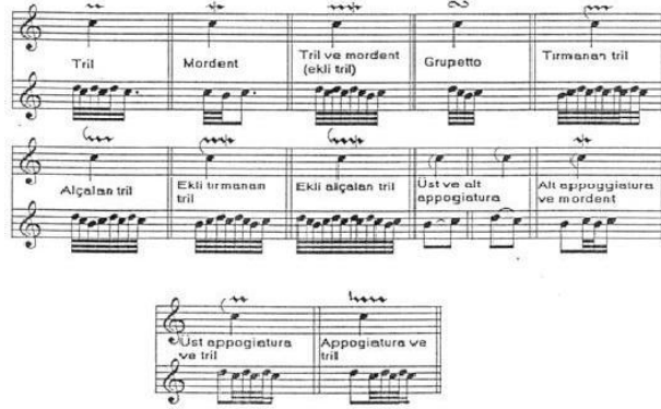
Şekil 7. J.S. Bach'ın explication tablosu

Yine Barok dönemden günümüze kadar ulaşan başka bir kaynak, aynı dönemde yaşayan besteci Henry D'Anglebert'in "Pieces de Clavecin" (1689) adlı eserinde bulunan süsleme sembolleri ile ilgili tablodur.