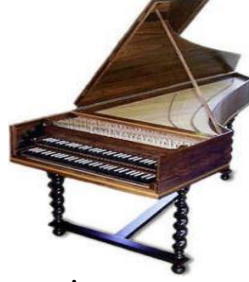
Resim 3. İki Klavyeli Klavsen

Barok dönemde yaygınlaşan klavsen sanatı, 17. ve 18. yüzyılda mükemmelliğin doruğuna erişmiştir. 19. yüzyılda ise, klavsen ve klavikordun yerini tamamen piyano almıştır. Ancak 20. yüzyılın ikinci yarısına gelindiğinde bestecilerin ve icracıların eski müziğe olan sevgisi tekrar klavsen ve klavikordu sahneye getirmiştir.