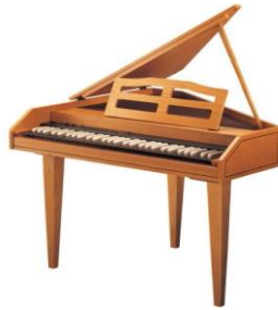
Resim 2. Klavsen

Klavsen'de tuşa dokunulunca, küçük tahta bir çubuk, çalgının içindeki tuşa ait telin üzerinden yukarı doğru kalkar, çubuğun yan tarafına tespit edilmiş kuş tüyünden bir mızrap, aynen mandolin telindeki gibi teli çeker. Sesin kuvvetlenmesi ya da hafiflemesi, çeşitli renklerin ortaya çıkartılması için, iki klavye mevcuttur. Üst klavye hafif, alt klavye kuvvetli sesler için kullanılır, Org'taki gibi. Klavyelerin değiştirilmesi ve birlikte kullanılmasıyla çeşitli tını etkilerini ve karışımlarını elde etmek mümkündür (Pamir, ty).