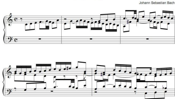
Şekil 3. Kontrpuan Tekniği İle Yazılmış Bir Füg Do Majör Füg

Barok dönemde armonik olarak en büyük gelişme Bach'ın orta ton sisteminden bir oktavı on iki eşit aralığa bölüp, matematiksel bir düzen kazandırıp 12 majör ve 12 minör tonu kesinliğe kazandırmasıdır. Bach'ın yazmış olduğu "Das Wohltemperierte Clavier" albümündeki 24 prelüde ve füg, bugün kullanılan eşit düzenli sistemin temellerinin örneklendiği eserlerdir.