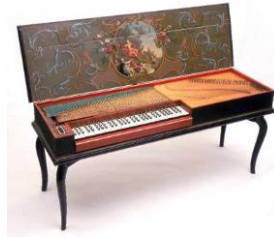
Resim 1 Klavikord

Klavikord'da tuşa basıldığında, çalgının içinde tuşa ait dikine tespit edilmiş bir bakır çubuk tele dokunur ve tuş tutulduğu sürece aynı pozisyonda kalır. Bu özellik dokunum ve tınının yapısı bakımından çok önemlidir. Klavsenden ve bugünkü piyanodan farklı olarak tuşa basıldıktan sonra parmağın tuş üzerinde yaptığı titreşimi hareketleri, ya da tuşa yapılan hafif veya kuvvetli itmeler ve baskılarla, çıkan sesi etkilemek olasıydı. Böylece sesin kuvvet oranısında küçük değişiklikler yapılabiliyordu. Klavikord'un tek klavyesi vardı. Çıkan ses zayıftı ama, ince nüanslara açıktı (Pamir, ty).