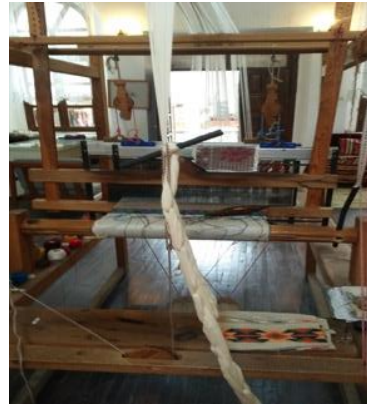
Fotoğraf 4.b.Sinop Halk Eğitim Merkezi El Dokuma İşlemi Yapan Kursiyer (Dokuma tezgahının arkadan görünümü)

Dokuma yapılırken atkıların, çözgülerin arasındaki ağızlıktan kolayca geçebilmesini sağlayan, atkı ipliğinin üzerine sarıldığı iki ucu sivri genellikle ağaçtan yapılan alete ise mekik denir (Fotoğraf 5).