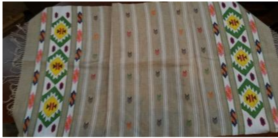
Fotoğraf 20. Peşkir örneği, Sinop Halk Eğitim Merkezi ve Aso Müdürlüğü Arşivi (Tüm Cebeci 2016)

(Fotoğraf 19-19.1.) 50x100 cm olup atkı ve çözüde keten iplik kullanılmıştır. Peşkirin iki ucunda simetrik olarak yerleştirilmiş motifler bulunmaktadır. Pembe, sarı, kırmızı, beyaz, lacivert, ve yeşil tonlarda pamuk iplik kullanılmıştır.