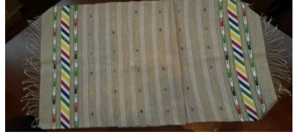
Fotoğraf 21 Peşkir örneği, Sinop Halk Eğitim Merkezi ve Aso Müdürlüğü Arşivi (Tüm Cebeci 2016)

(Fotoğraf 20) 50x100 cm atkı ve çözüsü keten ipliklerinden oluşturulan peşkirin ortasında tekrar eden beyaz bantlar ve içlerinde küçük motifler kullanılmıştır. Peşkirin iki ucu simetrik dokunmuştur. Ana bordür içerisinde geometrik motifleri yer almaktadır. Beyaz alan içerisinde yeşil, sarı, kırmızı ve lacivert tonlarda pamuk iplik kullanılmıştır. Ana bordürün alt ve üstünde de tekrar ayrıca iki bant yapılarak içerisinde ayrı motifler kullanılmıştır.