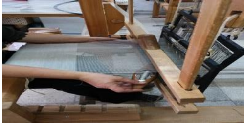
Fotoğraf 6 Sinop Halk Eğitim Merkezi El Dokuma İşlemi Yapan Kursiyer (Dokuma tezgahının önden görünümü) (Tüm Cebeci2006)