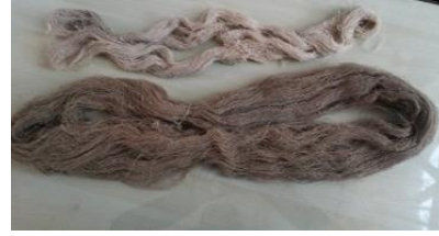
Fotoğraf 7. Pervane Medresesi Geleneksel El Sanatları Çarşısı) Sinop Valiliği İl Kültür ve Turizm Müdürlüğü Yöresel El Sanatları Çarşısı ve Atelyesi - Doğal keten ve beyazlatılmış keten örnekleri. (Tüm Cebeci 2006)

vaksar yüzeyde düzgünlük ve kir tutmama özelliği sağlar (Başer, 2002: 49-52).