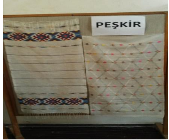
Fotoğraf 17 a -17 b. (Pervane Medresesi Geleneksel El Sanatları Çarşısı) Sinop Valiliği İl Kültür ve Turizm Müdürlüğü Yöresel El Sanatları

(Fotoğraf 16) Sinop Halk Eğitim Merkezi Arşivinde yer almaktadır. 50x100 cm boyutlarında olup zeminde atkı ve çözgüsü keten iplikten oluşturulmuştur. İki ucundada yöresel motiflerden oluşan desenlerle dokuma gerçekleştirilmiştir.