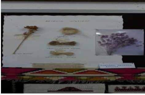
Fotoğraf 8. Sinop Halk Eğitim Merkezi Dokuma Atelyesi - Keten lifine ait hikaye panosu

Keten üretimi, Ayancık ilçesinde 1960-1990'lı yıllara kadar önemli miktarda üretilirken, 1990'lı yıllardan sonra önemli ölçüde düşmüştür. 2000'li yılların başında ise üretim tamamen bitmiştir. Kaliteli ketenin yetiştirildiği ilçede; Kültür Turizm Müdürlüğü, Ayancık Kaymakamlığının girişimleri ile tekrar Ayancık keteninin ekimi, Ayancık Gıda Tarım ve Hayvancılık Müdürlüğü tarafından desteklenmiştir. 2017 yılında ilçede toplam 31 bin 500 metrakare alan'a keten tohumu ekilmiştir. (Fotoğraf 8), (http:3)