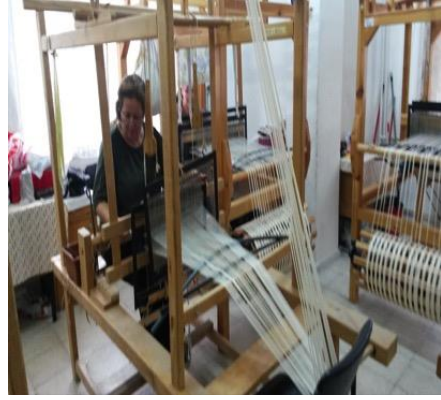
Fotoğraf 4.a Sinop Halk Eğitim Merkezi El Dokuma İşlemi Yapan Kursiyer (Dokuma tezgahının önden görünümü)