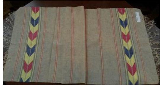
Fotoğraf 22 Peşkir örneği, Sinop Halk Eğitim Merkezi ve Aso Müdürlüğü Arşivi (Tüm Cebeci 2016)

(Fotoğra 21) 50x100 cm. atkı ve çözü iplikleri keten ipliklerinden oluşturulan peşkirin tüm yüzeyinde beyaz ince bantlar ve bu bantların içine yerleştirilmiş küçük motifler bulunmaktadır. Peşkirin iki ucunda da simetrik motifler yer almaktadır. Ana bodür ve iki ayrı bant şeklinde oluşturulan yüzey tasarımında stilize edilmiş bir motif kullanılmıştır. Yeşil, siyah ve kırmızı renkler tercih edilmiştir. Ana bordürde ise lacivert, beyaz, yeşil, sarı ve kırmızı renklerinde verev pesent (verev sarma) desenlendirme dokuma tekniğinde uygulanmıştır (Fotoğraf 22).