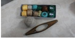
Fotoğraf 5. Sinop Halk Eğitim Merkezi Dokuma Atelyesi Dokumada Desen Yapımında Kullanılan 12 Numaralı Pamuk İplikler ve Kullanılan Ahşap Mekik (Tüm Cebeci 2016) Çerçevelerin yukarıya kaldırılıp aşağıya indirilmesi ile oluşan ağızlık denilen açıklıktan ise mekik aracılığı ile iplikler geçirilir ve dokuma işlemine başlanır. (Fotoğraf 6)