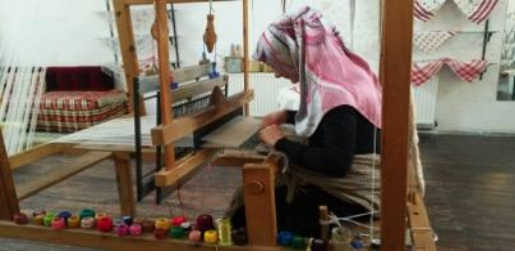
Fotoğraf 9 (Pervane Medresesi Geleneksel El Sanatları Çarşısı) Sinop Valiliği İl Kültür ve Turizm Müdürlüğü Yöresel El Sanatları Çarşısı ve Atölyesi- El Dokuma Çalışmasının yapılması (Tüm Cebeci 2006)

ucu bordürlerle bezenmiş keten ya da pamuklu dokumadan yapılmış dikdörtgen örtüler veya peçete gibi dize örterek de kullanılmaktadır (Altun 2008: 66). Sinop ilinin Ayancık ilçesinde Peşkir örneklerinde keten hammadesi kullanılmıştır. Yörede "düzen" adı verilen dokuma tezgahlarında 30,40,50 cm. eninde dokunur. (Fotoğraf 9) Bu dokumadan yöresel adıyla Göynek, nezgep, paça, erkeklerde pantolon, ceket yelek gibi giyim eşyaları ve çarşaf, peşkir, örtü gibi ev tekstili eşyalarıda yapılmaktadır. Sinop ili çevresinde peşkir veya çarşaf olarak yapılan el dokumalarının iki kısa kenarına dokuma sırasında renkli ipliklerle oluşturulmuş geometrik süslemeye "Dökme" adı verilmiştir. "Peşkir" veya "dökme" adı verilen dikdörtgen biçimindeki el dokumaları havlu yerine kullanılmıştır (yy., 2016: 4-5).