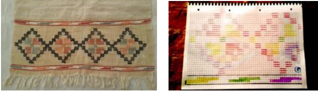
Fotoğraf 15 Öğretmen Süheyla Hayırcı arşivinden orjinal Ketan Peşkir.Çizim 15.1 desen raporu Ayşegül Ergül Sinop Merkez.

Dokuma işleminini gerçekleştirebilmek için öncelikle kareli kağıtlara desenin çizimi yapılır ve dokuma çalışması bu raporlara göre dokunur (Fotoğraf 14-14.1, 15-15.1).