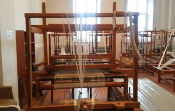
Fotoğraf 2. Sinop Kültür ve Turizm Bakanlığı Geleneksel El Sanatları Atölyesi Genel Görünüm (Tüm Cebeci 2016)

Sarılan çözgü iplikleri gruplar halinde tezgaha alınır ve "gücü" denilen çerçevelere geçirilir (Fotoğraf 2). Ayrıca el dokumasında kullanılan iplikler bobinler halinde hazır hale getirilmelidir (Fotoğraf 3). Tezgaha aktarıldıktan sonra uygulanacak desene göre dokuma işlemine başlanır (Fotoğraf 4).