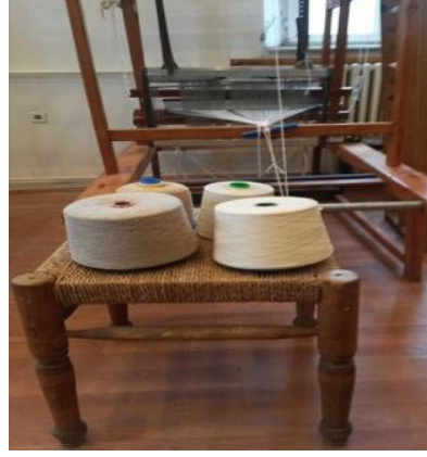
Fotoğraf 3 Sinop Kültür ve Turizm Bakanlığı Geleneksel El Sanatları Atölyesi -Keten İplik Bobinler (Tüm Cebeci 2016)