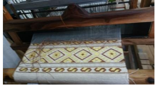
Fotoğraf 12. Sinop Halk Eğitim Merkezi Dokuma Atölyesi (Dokuma işlemi yapılmış çalışmadan detay)

Geçmişte el yüz havlusu olarak işlev gören peşkirler, mahramayla aynı teknikte dokunmaktadır. Peşkirlerde işleme tekniği olarak, düz sarma, verev sarma, balık sırtı, düz pesent, verev pesent, gözeme ve civankaşı gibi yöresel isimler kullanılmıştır. Geçmiş dönemlerde gündelik yaşantıda el ve yüz havlusu olarak kullanılmak amacıyla dokunmuşlardır. Mahrama ile aynı teknikle dokunan ve aynı işlevi gören peşkirlerin ayırt edici özelliği ise mahramaya göre daha ince ve uzun olarak dokunmasıdır (Fotoğraf 13).