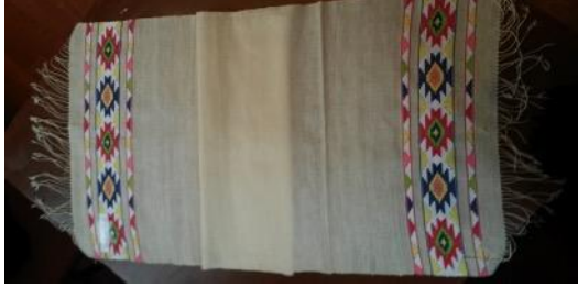
Fotoğraf 19 Peşkir örneği, Sinop Halk Eğitim Merkezi ve Aso Müdürlüğü Arşivi (Tüm Cebeci 2016)

da geleneksel desenlerimizden geometrik motifler kullanılmıştır. Ana bordürde beyaz zemin üzerine siyah, turuncu lila ve yeşil tonlar kullanılmıştır. İki ince bordürde ise birbirine paralel motifler kullanılarak, lila, yeşil, turuncu ve siyah tonlar tercih edilmiştir.