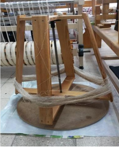
Fotoğraf 1: Sinop Halk Eğitim Merkezi Geleneksel Çıkırık (Tüm Cebeci 2016)

gereksinim vardır. Geleneksel yöntemlerle önce çıkırık üzerine ipler sarılır (Fotoğraf 1).