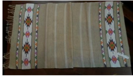
Fotoğraf 18. Peşkir örneği, Sinop Halk Eğitim Merkezi ve Aso Müdürlüğü Arşivi (Tüm Cebeci 2016)

(Fotoğraf 17a) 50x80.cm boyutlarında olup zeminde atkı ve çözgüsü keten iplikten oluşturulmuştur. İki ucunda da yöresel motiflerden oluşan desenlerle dokuma gerçekleştirilmiştir. Ayrıca çalışmanın ana bölümünde 10 cm. aralıklarla mor renkli bantlar kullanılmıştır. İki ucunda ise simetrik olarak tasarlanmış motifler kullanılmıştır. Kullanılan renkler ise; sarı, mavi, mor ve kırmızıdır (Fotoğraf 17b). 50x80cm boyutlarındadır. Tüm yüzeyde simetrik olarak yerleştirilmiş küçük motifler yer almaktadır. Desenlendirmede krem, sarı, turuncu, pembe ve yeşil renkleri kullanmıştır. Yörede Boyabat çemberi olarak adlandırılan ve dokunan geleneksel olarak başörtüsü niteliğinde kullanılan motif özelliğine benzeyen motiflerle bezeli dokuma oluşturulmuştur.