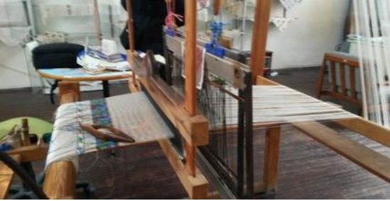
Fotoğraf 10. Dokuma Tezgahından örnek çalışma

Sinop Halk Eğitim Merkezi dokuma atölyesinde peşkir çalışması ile ilgili örnekler uygulamalı olarak tezgahlarda görülmektedir (Fotoğraf 10- 11-12).