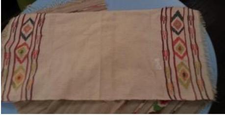
Fotoğraf 16. Peşkir örneği (Sinop Halk Eğitim Merkezi ve Aso Müdürlüğü Arşivi (Tüm Cebeci 2016)