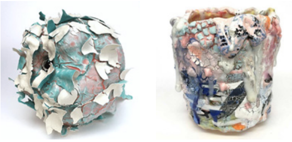
Resim 4: Brian Rocheford, Kupa Serisi (Sol)

Brian Rochefort'un çalışmaları incelendiğinde, seramiğin tekniksel alt yapısını ve sınırlarını zorlayan üslubu ile sıra dışı oluşu dikkat çekmektedir. Seramik sanatının gelişimine kronolojik olarak bakıldığında tekniksel yetkinliğin ön planda tutulduğu ve çok önemli olduğu gözlemlenmektedir. Sırların ve sır altı ile sır üstü olarak kullanılan pigmentlerin pişirim derecelerinin önemi, seramik kimyasının olmazsa olmaz kuralları, seramik sanatının tasarımdan sonra ikinci sırada yer alan önemli konularıdır. Üretilen eserler de fırın derecesinin yüksek gelmesi sebebi ile sırnın akması ya da derecenin düşük gelmesinden dolayı parlamaması gibi karşılaşılan seramik hataları hep çözüm bulunması gereken sorunlar arasında yer almaktadır. Ancak, son zamanlarda bu sorunlar seramik sanatında yerini hatanın estetik olarak anlatım diline yaptığı katkıya bırakılmaktadır. Rastgele üst üste uygulanmış sırlar, uygun olmayan çamur bünyelerinin ve pişirim sıcaklıkların, bilhassa seçilmesi, sırların kimi zaman akarak kimi zamansa toplanarak meydana getirdikleri kimyasal değişimler rastlantısal hata ve oluşumlara sebep vermektedir (Resim 4-5).