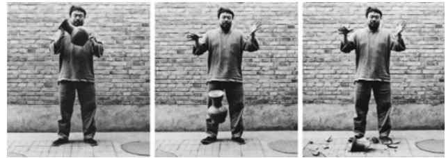
Resim 2: Han Hanedanlığının Vazosunu Düşürmek (Dropping A Han Dynasty Urn), 1995

noktaya ulaşır. Üç parçadan oluşan fotoğraf serisinde, siyah beyaz anlatımla dikkati harekettiren uzaklaştıracak renkler dışlanmıştır. Bu izleyiciyi yıkıcı hareketle baş başa bırakır. Ai Weiwei'nin ilk fotoğrafta elinde tuttuğu seramik formu, ikinci fotoğrafta yere düşerken havada, üçüncüde ise yerde parçalanmış halde görürüz. Anlatım için seramik formun kültürel ve estetik değeri sonuna kadar sömürülmüş ve geriye kalan sonuç yok oluş olduğundan geleneksel anlamda seramik başka bir yapıya dönüşmüştür. (Özkan 2017:1823) (Resim 2)