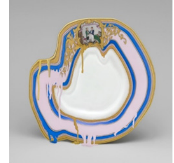
Resim 7: Chad Wys, Porselen, Dijital Baskı (Sağ)

Sanatçı eserlerinde, izleyiciyi, toplumun gözüne güzel, hoş ve mükemmel gelen günlük kullanım eşyalarının anlamlarını yeniden sorgulamaya çağırılmaktadır. Alışlagelmiş porselen formların ve dekorlarının renkleri farklı tonlarla manipüle edilerek farklı bir gerçekliğe dönüştürülmektedir. Porselen objelerin yüzeylerindeki dijital baskılarda müdahalesiz ya da az müdahale edilerek bırakılan küçük detaylar bize eşyaların özünü hatırlatsa da artık yepyeni ve bambaşka bir anlatı hâline geldiği gerçeği saklanamamıştır. Bu orijinal yapıttan geriye kalan geleneksel dekor ve kulp detayları izleyiciye Gerçek güzelliğin ne olduğuna dair bir sorgulatma yaşatmaktadır.