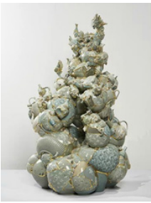
Resim 21: Yee Sookyung, Dönüşen Vazo, 2012 (Sol)

Lee işlerini yarattığım nesnelere çeşitli kültürlerden form, dekor, renk ve malzeme unsurlarını bir araya getirmektedir. Seramik tarihine olan tutkumu ve geçmişe dair olan hayranlığımı yansıtan eserlerim Çin, Kore, Fransız, Hollanda, İngiliz, gibi çeşitli kökenlerden gelen birikimleri taşıyan çalışmalardır. Seramik üretimi geçmişten günümüze endüstriyel bağlamda bir mükemmellik standartlarında yapılmıştır. Yapmış olduğum formların yapılarını bozarak, farklı gerçekliklere bürünmelerini sağlamaktayım. Böylece izleyiciler gerçek güzelin ne olduğunu? güzelin tanımını ve değer algısını yeniden sorgulamaktadırlar şeklinde anlatmaktadır (Lee, 2018).