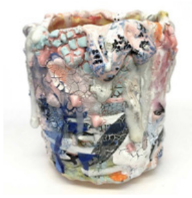
Resim 5: Brian Rocheford, Kupa Serisi (Sağ)

Sanatçı eserleri için sırları araştırmıyorum ya da birçok insanın yaptığı seramik kimyası üzerine çok fazla çalışmıyorum. On veya on beş farklı malzemeyi özgürce birbirlerine karıştırıyorum ve seramiğin sınırlarını zorluyorum. Başta kupa serisi olarak başladığım seri, birçok farklı biçime dönüşen bir başlangıç noktasıydı. Hala "Kupa" serilerini yapıyorum ama çoğunlukla bu işler fonksiyonelliği dışlanmış büyük heykellere dönüşmektedir" şeklinde özetlemektedir (Rocheford, 2019).