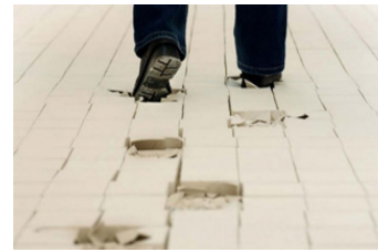
Resim 8: Clare Twomey Bilinç/Vicdan Performansı (Sol)

Sanatçı eserlerinde, izleyiciyi, toplumun gözüne güzel, hoş ve mükemmel gelen günlük kullanım eşyalarının anlamlarını yeniden sorgulamaya çağırılmaktadır. Alışlagelmiş porselen formların ve dekorlarının renkleri farklı tonlarla manipüle edilerek farklı bir gerçekliğe dönüştürülmektedir. Porselen objelerin yüzeylerindeki dijital baskılarda müdahalesiz ya da az müdahale edilerek bırakılan küçük detaylar bize eşyaların özünü hatırlatsa da artık yepyeni ve bambaşka bir anlatı hâline geldiği gerçeği saklanamamıştır. Bu orijinal yapıttan geriye kalan geleneksel dekor ve kulp detayları izleyiciye Gerçek güzelliğin ne olduğuna dair bir sorgulatma yaşatmaktadır.