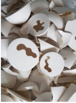
Resim 15: Lemana Kalay, Yeterince İyi mi? Serisi, Detay, 2018 (Sol)