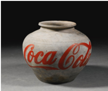
Resim 1: Ai Weiwei, Han Hanedanlığı Dönemine Ait Coca-Cola Logolu Vazo

Bu örnekler bütünü, yok etme hakkı konusunu sorgulamamıza yol açar. Bu incelemeyi oluşturan örnekler; ilk olarak Ai Weiwei'in yaptığı eser, ikinci olarak koleksiyoner tarafından satın alınan eserine yapılan müdahale ve son olarak da eserin sergilendiği sırada protesto amacı ile yapılan tahribatdır. (Özkan 2017:1822)