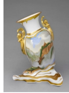
Resim 6: Chad Wys, Porselen, Dijital Baskı (Sol)

"Sanatçı fonksiyonel seramik objeleri bir yıkım yaratmak sureti ile şekillendirme aşamasında deforme etmektedir. Alışlagelmiş görüntüsünden ve işlevinden uzaklaştıran eser, yeni kavramsal içerikle yorumlamaktadır" (Mcintyre 2014: 226).