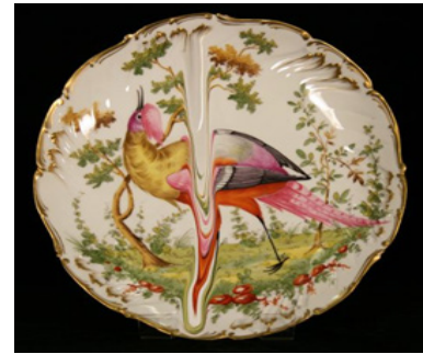
Resim 3: Andrew Livingstone, Erime, Hazır Porselen Malzeme, Dijital Baskı, 2010

Tahribat sırasındaki performansın belgelenmesi varlık-yokluk arasındaki ikilemi gözler önüne sermektedir. Ayrıca sanat eserin kalıcılığına yapılan bu müdahale, eserin yok edilmesi sureti ile başka bir anlam kazanmasını sağlarken, performansın fotoğraflarının sergilenmesi de, eserin farklı bir anlatım dili ile ölümsüz bir hal almasını sağlamaktadır. Sonuç olarak sanatçının yok ediş eylemi, yeni bir eserin başlangıç noktasını oluşturmuştur.