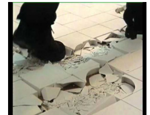
Resim 9: Clare Twomey Bilinç/Vicdan Performansı (Sağ)

"İngiliz sanatçı Claire Twomey seramik malzemeyi kullanarak yapmış olduğu performanslarında kilin, fiziksel ve kimyasal değişiminden yararlanmaktadır. Ayrıca yapmış olduğu düzenlemelerde izleyiciyi de interaktif bir şekilde performansına dahil etmektedir" Phaidon. (2017).