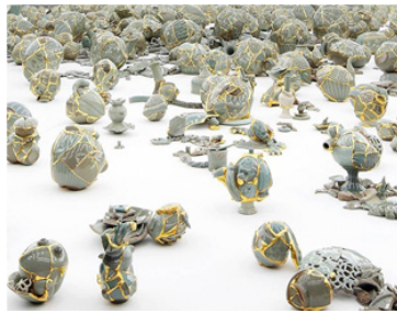
Resim 22: Yee Sookyung, Dönüşen Vazo, (Translated Vase) Detay, 2012 (Sağ)

Yee Sookyung'nin sıra dışı seramik çalışmaları Kore Kültürünün geleneksel porselen mirasını odak noktası yapmaktadır. Sanatçının seçtiği malzeme ve yöntem "sanat ile zanaat" "Doğu ile Batı" ve "geçmiş ile şimdiki" arasında bir bağ yaratmaktadır. Özellikle Japon ve Çin seramik kültürünün