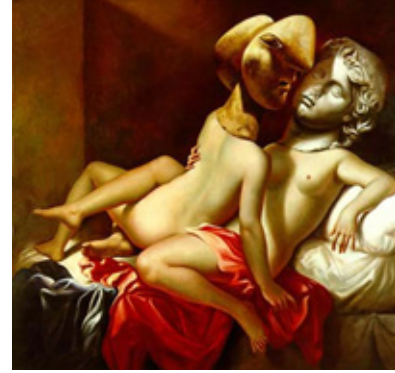
Resim 4. Carlo Maria Mariani, Büyük Yaratıcı Süreç, 1997, Tuval Üzerine Yağlıboya.

algının önceliğine işaret etmektedir. Eserde, gerçeklik imgesinden yola çıkılarak yapıbozuma uğratıldığı gözlemlenmektedir. Dolayısıyla yapıbozum ve alımlama estetiği bağlamında değerlendirildiğinde sanatçı portrelerinde anlam, ifade ve temsil sorunlarını ele aldığı ortaya çıkmaktadır.