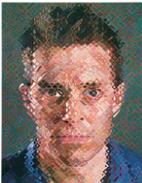
Resim 3. Chuck Close, James, 2002, Tuval Üzerine Yağlıboya, 276.23 cm x 213.36 cm.

Chuck Close geleneksel ya da tipik portreler yaratmaz. Daha ziyade, çoğu zaman gerçek boyutta ve uzaktan bile izleyiciyle yüzleşen, fotoğraflardan yakınlştırılmış kocaman suratlar yaratır. Yakından daha da etkileyicidirler. Sanatçı "Sanat büyük oldukça, görmezden gelmesi zorlaşır" şeklinde bunu açıklar (Johnson, 1998: 33).