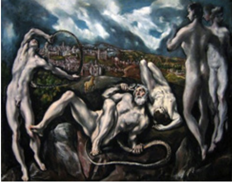
Resim 1. El Greco, Laocoön, 1610-14, Tuval Üzerine Yağlıboya, 84 cm x 113 cm.

Örneğin sanatçının Laocoön isimli eseri (Resim 1.) incelendiğinde görüntü ve anlam bağlamında bir ilişkiden söz edilebilir. Bedenlerin görüntüsü estetik bir kaygı içermez. Bedenlerin kurgulanışındaki ifade, görüntünün önüne geçmiştir. Kahin Laocoön ve oğullarının cezalandırılması anlatıldığı öyküde iç çöküş hakimdir. El Greco, eserinde çağdaşlarından farklı olarak yerleşik kalıp ve üslupları kırmıştır. Biçimler tek düze ve sınırlı bir düzenlemelerden uzaktır. Resimde görüntünün anlam ve ifadesine bağlı olarak bir karmaşa vardır. El Greco, yaşanan trajediyi güçlü kılmak için bedenlerin yapısını bilinçli olarak bozmuştur. Resimdeki göstergelerin çözümlemesi yapılarak bedenler yapıbozuma uğratılmıştır. Eserde anlam, kimlik ve yapı irdelenmiştir. Dolayısıyla Laocoön isimli eser Maniyerist bir dönemde yapılmış olsa dahi Modernist göstergeler ve sorgulamalar içermektedir.