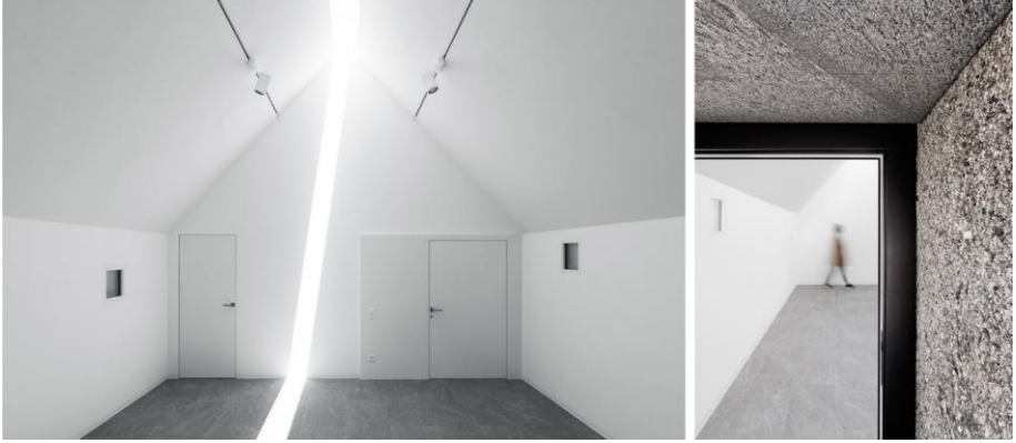
Görsel 10. 11. MeCri, 2014 (Studio Inches Architettura, 2017).

Studio Inches Mimarlık tarafından projesi 2012’de hazırlanan, yapımı 2014-16 yıllarında tamamlanan yapı MeCri müzesine ek olarak tasarlanmıştır. Bir “köşk” sergisi olarak adlandırılan galeri, çekirdeğin biçimsel özelliklerine ve hacmine benzer, orijinal sınırları bozulmadan bir sergi alanı olarak düşünülmüştür. Granit duvarları ve 9 metrelik bir tavan penceresi bulunmaktadır (SIA, 2017). Dik açılı çatısının ortasında yer alan bu pencere güneşin hareketiyle birlikte iç mekanda bir hareket algısı yaratarak kendi performans sanatını sergilemektedir. Formu ve bembeyaz duvarları ferah bir mekan oluşturmaktadır. A+ Awards 2017’de galeriler kategorisinde ödül almıştır.