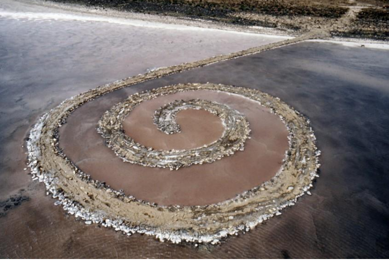
Görsel 1. Robert Smithson, Spiral Jetty, 1970 (Robert Smithson, 2017).

Arazi Sanatı (Land Art) , mekanla iç içe bir yapıdadır fakat daha çok kapalı mekanlar değil, adından da anlaşılacağı gibi açık alan ve arazilerde gerçekleştirilmektedir. Doğada bulunan malzemeler içeren ürünler olabildiği gibi, araziyi biçimlendirerek de olabilmektedir. Krauss (1979: 41), sanatçının, sanayileşme ile değil, doğanın sahip olduklarıyla farkındalık yarattığını belirtmektedir.