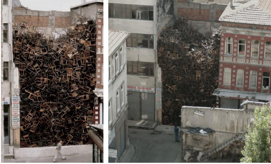
Görsel 2. Doris Salcedo, Untitled , 2003 (Gwarlingo, 2017).

Performans Sanatı (Performance Art) , çoğunlukla sanatçının kendi bedenini kullanarak gerçekleştirdiği eserlerden oluşmaktadır. Germaner (1997: 59), ise özel beceri, işlev ve ifade gerektirmeden yapıtın seyirci tarafından tamamlanması olarak tanımlamaktadır. Performans sanatı, aynı performansın farklı mekanlarda gerçekleştirilebilmesi için tek bir mekana özgü olmayıp, diğer çağdaş sanat biçimlerine göre mekan ilişkisi daha az görülmektedir.