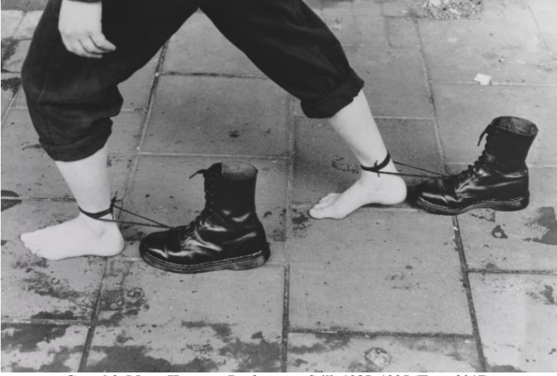
Görsel 3. Mona Hatoum, Performans Still, 1985, 1995 (Tate, 2017).

Video Sanatı (Video Art) , adından da anlaşıldığı gibi birçok ifade biçimini bir araya toplayabilsen, hareketli görüntülerden oluşan bir sanat biçimidir. Köksal (2008: 129), video sanatını sinemadan ayıran oyuncu, diyalog, konu ve senaryo gibi öğeleri kullanmak zorunda olmadığını, sınırlarını keşfetmek ya da izleyicinin sinemadan beklentilerine saldırıda bulunmak gibi amaçlar güdebildiğini belirtmektedir.