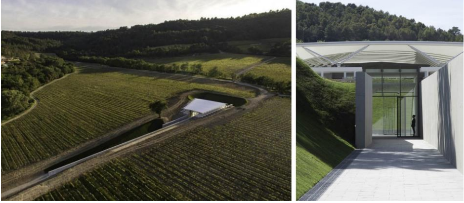
Görsel 5. 6. Chateau Chateau La Coste Art Gallery, 2017 (Dezeen, 2017).