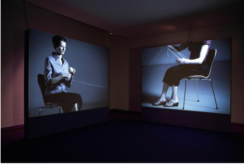
Görsel 4. Heli Rekulai, Skein, 2000 (Kati Kivinen, 2015).

Altıntaş ve Eliri (2012: 65), modern sanatın bir kent sanatı olduğunu ve kentte yaşayan ve kentten etkilenerek sanat yapanların kenti güzelleştirdiklerini belirtmektedir. Kamusal alanda yapılan sanat, her kesimden bireylerin bulunduğu bir alanda gerçekleştiğinden izleyici ile daha etkin bir etkileşim göstermektedir. Miles (1997:2), sanatın popüler kültürdeki görünümüne rağmen mimarlık, kentsel tasarım ve kentsel planlama ile yakından ilgili olduğunu belirtmektedir. Sanatta mekanın kullanımının yoğun olarak görüldüğü çağdaş sanat akımlarında mekana farklı bir bakış ve bambaşka bir anlam yüklenmeye başlanmaktadır. Sanat mekanla bütünleşerek, tüm mekan bir esere dönüşmektedir. Sanatın kurgulandığı yer zaten bir mekandır ve mekanla birlikte kurgulanmış bir sanat eseri, çalışmanın bütünlüğü, bağlam, kapsam ve ilgi açısından son dönemlerde oldukça sık görülmektedir.