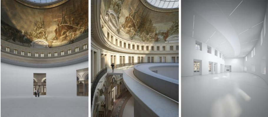
Görsel 7. 8. 9. Paris Bourse de Commerce, 2017 (Designboom, 2017).

Paris'te ünlü Japon mimar Tadao Ando tarafından tasarlanan bir yapı ile tarihi bina olan Paris Borsa ve Ticaret binası bir sanat galerisine dönüştürülmektedir. Projenin 2018'de biteceği, 2019'da sergilenmeye başlayacağı belirtilmektedir. Yapının ortasına 30m. çapında, 9 m. yüksekliğinde beton bir silindir olarak tasarlanan galeri, mimarın tarihi bir bina içine yerleştirdiği bir küttedir. Bu yapı da tasarımcısı tarafından yapılan, yerleştime sanatına örnek olarak gösterilebilmektedir.