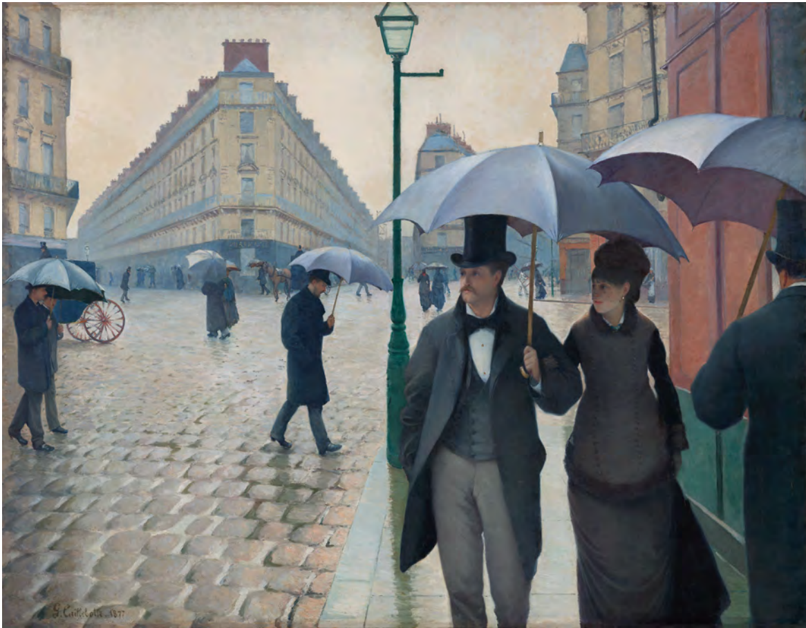
Gustave Caillebotte, "Paris Street; Rainy Day", oil on canvas, 212.2 × 276.2 cm, 1877 Charles H. and Mary F. S. Worcester Collection

Yıl 10 - Sayı 77 - 2021 - Volume 10 - Issue 77