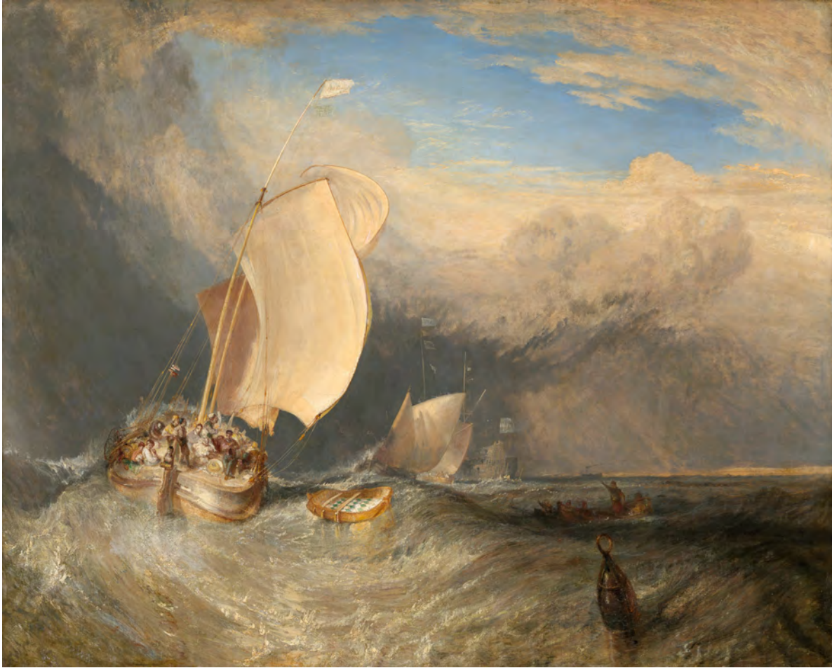
Joseph Mallord William Turner, "Fishing Boats with Hucksters Bargaining for Fish", t y b, 174.5 × 224.9 cm, 1832-1842

Yıl 10 - Sayı 85 - 2021 - Volume 10 - Issue 85