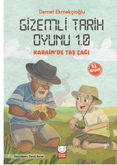
Görsel 1. Yazar Demet Ekmekçioğlu ve Gizemli Tarih oyunu serisinden Karain'de Taş Çağı adlı kitabı, Kırmızı Kedi Yayınevi, 2019.