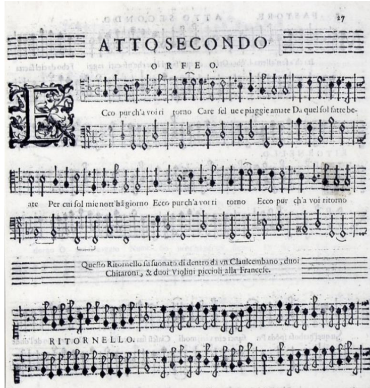
Görsel 3: Orfeo Operası, İkinci perde "Orfeo". (Petrucci Music Library, 2023)

2. Perde'nin "Yeraltı Sahnesi"nde Orfeo yeraltında, Ölüler Ülkesi'nde görülür. Monteverdi trombonları mekanın soğuk, karanlık ve korkutucu atmosferini yansıtmak için kullanır. Trombonların derin ve uğultulu sesi, bu duyguları pekiştirerek müzikle seyirciye aktarır. Sahneyi tanıtan ritornelloda da trombonlar duyulur. Monteverdi'nin eser başındaki talimatları, sahne "Yeraltı Dünyası"na geçerken kemanların, orgun ve klavsenin susması ve müziğin trombonlar, kornetler ve regal tarafından ele alınması yönündedir. Monteverdi, Pluto'nun gücünü ve otoritesini vurgulamak için de yine trombonları sahneye çıkarmıştır. Orfeo ve Eurydice'nin bir araya gelmesi sırasında trombonların parlak ve zafer dolu sesi, müzikal duyguyu değiştirir. Monteverdi L'Orfeo'da trombonlar ile orkestraya çoğunlukla dokular ve derinlik ekler. Özel efektler yaratma çabasının yanı sıra, armonik yapıyı desteklemek için de kullanır.