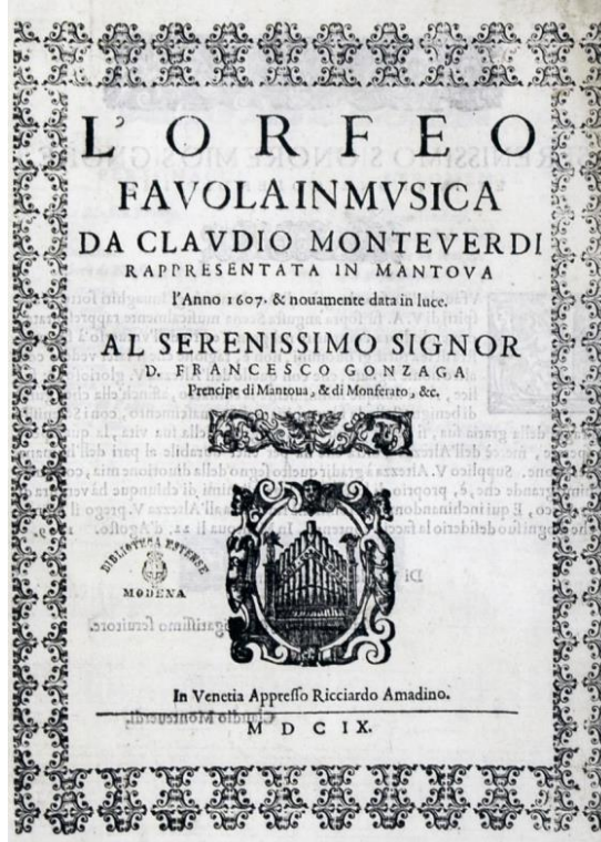
Görsel 1: Orfeo operasının kapak sayfası. İlk baskı.

Orfeo Operası, ilk sahneleme performansından sonra Mantova'da ve muhtemelen sonraki birkaç yıl içinde diğer İtalyan sanat kentlerinde tekrar sahnelenmiştir. Bestecinin 1643'teki ölümünden sonra opera, 19. Yüzyıl sonlarına kadar büyük ölçüde unutulmuş, 1911'de Paris'te ilk modern dramatize edilmiş performansın ardından giderek daha fazla tiyatrodaki görülmeye başlanmıştır. 2007'de opera prömiyerinin dört yüzüncü yıldönümü, dünya çapında sergilenen performanslar ile kutlanmıştır.