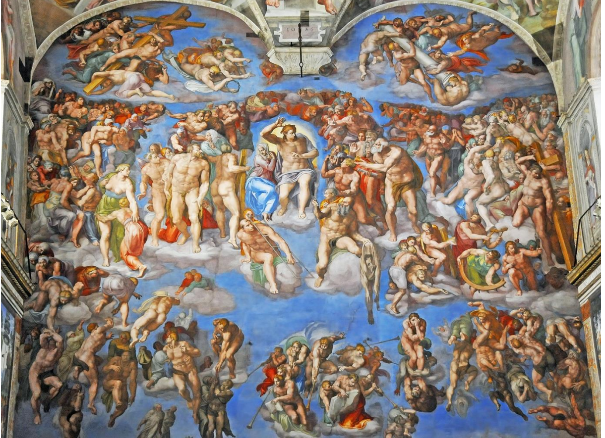
Görsel 4: Michelangelo Buonarroti, "Sistin Şapeli Duvar Freski; Son Yargı", 1537-41, Vatikan

Michelangelo'nun şiirlerindeki mistik yakarılar, hayatının son evresinde çalıştığı, "Son Yargı" freskinde de görülebilir (Görsel 4). Ana kurgu Dante'nin cennet, cehennem tasviri üzerine yapılmıştır. Geleneksel olandan farklı olarak, güçlü bir İsa figürü tam merkezde yer almaktadır. İnsan bedeninin faniliğini temsilen, Aziz Bartolomeo'nun elinden Michelangelo'nun kendi bedeninin yüzülmüş derisi sarmaktadır (Tansey vd, 1996: 754). Hem şiirlerinde hem de resimlerinde Michelangelo'nun kendini Tanrı'nın iradesine bırakmak ve Tanrısal bir yaratıcılığı sanata dönüştürmek gibi kavramlar okunabilmektedir. Yolda mistik bir dilenci olmak, nihayetinde ise tanrısal vasıflara ulaşmak tarif edilmektedir.