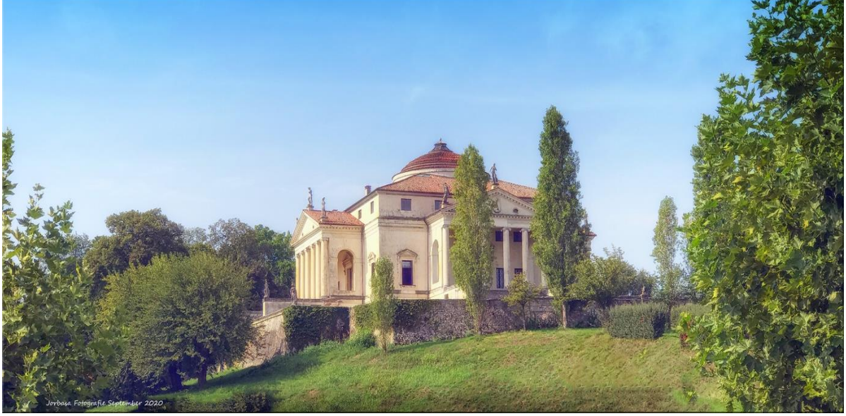
Görsel 1: Andrea Palladio, "Villa Rotonda (Villa Capra)", 1567-1571, Vicenza