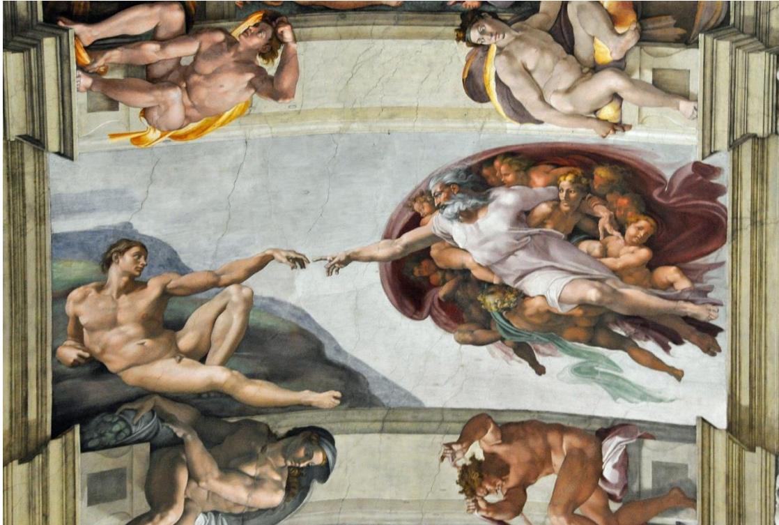
Görsel 3: Michelangelo Buonarroti, "Sistine Şapeli Tavan Freskleri", 1508-12, Vatikan

Michelangelo'nun şiirlerinde de ilham yoluyla tanrısal aklın sanata dönüşmesi ve ilahi aşk teması görülmektedir. Bu şiirlerde süfli dünyadan yükselerek Tanrı'ya yaklaşmak arzusu işlenmektedir ve Hıristiyan Yeni-Platoncu bir yapı gözlemlenmektedir. Tanrı'ya ve İsa'ya kavuşma arzusu yakarışlar halinde ifade