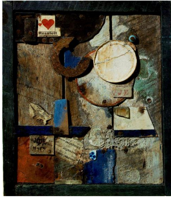
Resim 7. Kurt Schwitters, Merzbild Rossfett, 1919, Montaj, Kolaj.

Merzbild Rossfett, Schwitters'ın sanatta ęnlük nesnelerin kullanımına olan ilgisinin mükemmel bir rneđidir. Atık malzemelerin modernist sanat pratiđine dahil edilmesine iliřkin kavramlarını zetlemektedir. Bu nedenle kolajları arasında en nlülerinden biri haline gelir.