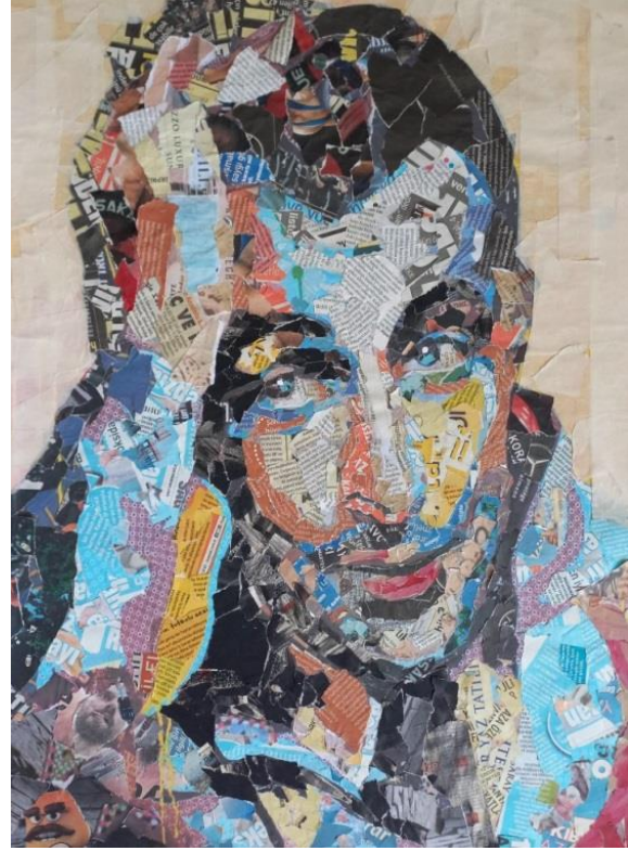
Kolaj Tekniđinde Yapılmıř rnek đrenci alıřmaları.

Bugnn sanatında malzeme sınırı kalkmıř, bařka amalarla bařka sorunsala dođru yol alınmaktadır. Sanatın ifade biiminde belli gerelerin dıřına ıkılarak atık malzemenin, tketilen her trl nesnenin sanat nesnesi olarak kullanılması yaratıcı dřnme biimini kkten etkilemiřtir