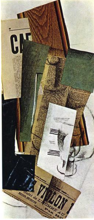
Resim 3. Braque, Cam Sürahi ve Gazeteler, 1914, Kolaj.