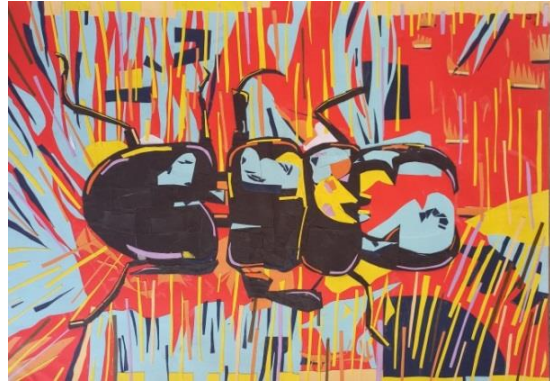
Kolaj Tekniđinde Yapılmıř rnek đrenci alıřmaları.