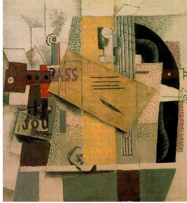
Resim 2. Picasso, Klarnet, Levrek, Gazete, Sinek Ası , 2013. Kolaj.

Pablo Picasso 1912 tarihinden itibaren gerekleřtirdiđi resimlerine baskılı kumařlar ve kađıtlar yapıřtırır ve ayrıca atık malzemeler kullanarak kolaj tekniđini nc boyuta da tařır ve bylece assemblaj tekniđinin ilk rneklerini vermiř olur. Georges Braque da aynı tarihten itibaren 'papier coll' olarak adlandırılan ve kesik kađıt paralarının resim yzeyine yapıřtırılmasıyla elde edilen kendine zg bir kolaj tekniđi geliřtirir. Kolajın 20. Yzyılın bařlarından itibaren en nemli sanat tekniklerinden biri haline gelmesi, fotođraf, gazete, dergi, afiř, kartpostal gibi kitle kltrne zg basılı malzemenin bu ađda yaygınlık kazanmasıyla ilgilidir. Yine Picasso ve Braque bu dnem yapıtlarında yařadıkları zamanların siyasi ve kltrel geliřmelerine iliřkin ipuları veren gazete kuprleri ve reklam imgeleri kullanmıřlar, ilgilerinin sadece biimsel kaygılarla sınırlı olmadıđının ipularını vermiřlerdir (Antmen, 2010: 48). Bu dnemde boya malzemesiyle birlikte farklı atık malzemelerin zellikle resimde kađıt, kumař, duvar kađıdı gibi malzemelerin sanatsal anlatımda yer alması, yine sayı ve harfler gibi resim dıřı soyut gelerin kompozisyonun iinde bulunması sıra dıřı olarak deđerlendirilebilir. Kısaca bu srecin en nemli yeniliđi, resme kolajın girmiř olmasıdır diyebiliriz.