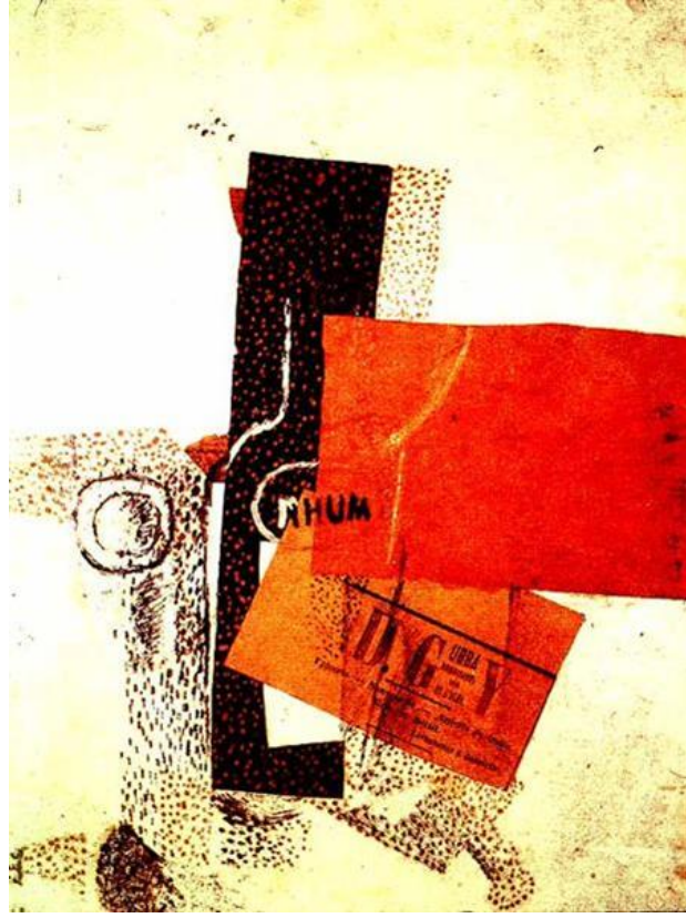
Resim 4. Braque, Rom Şişesi, 1914, Kolaj.

Kübistler, resme elle dokunurluk, maddesel bir nitelik kazandırabilmek için yağlıboya kum karıştırarak resimlerini tamamlarlar. Georges Braque, resimlere bakarken, bunlara eliyle de dokunmayı gereksindiğini söylemiştir (İpşiroğlu, ve İpşiroğlu, 1978: 99). Kübizm Akımı'nın önemli temsilcilerinden Georges Braque'ın resimde farklı malzemelerin ilk olarak kullanımını şöyle anlatılır: