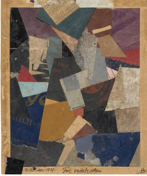
Resim 5. Kurt Schwitters, Merz 460, 1921, Kolaj