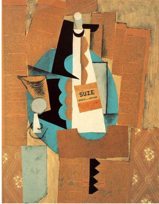
Resim 1. Picasso, Bardak ve Su řiřesi , 1912. Kolaj.

Gerek nesnenin resimde yer alması ilk olarak Kbizm dneminde grlmektedir. zellikle Kbizmin "Sentetik" olarak adlandırılan dneminde 1912 ve sonrasında boya ile birlikte gazete kađıtları, tel, cam, kumař, kum, ip gibi pek ok eřitli somut malzemelerin resme yapıřtırılarak kullanılmaya bařladıđı grlr. Bylelikle sanatta nemli bir yenilik olarak kolaj tekniđi iki boyutlu,  boyutlu gerek nesnelerin kullanılması ile gndeme gelir.