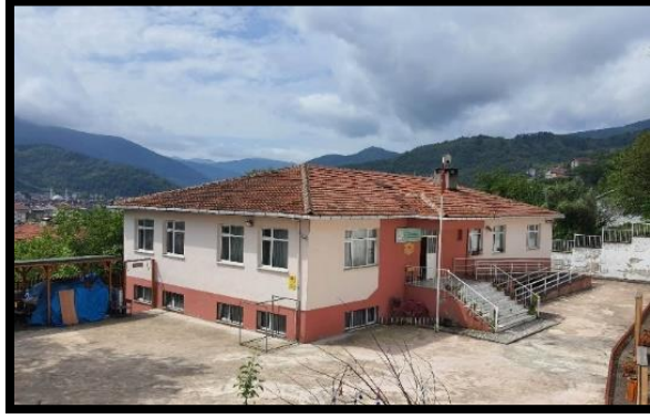
Resim 1. Ayancık keten evi (Turan, 2022)

liflere göre üretimi artmış ve fiyatının daha uygun olması ve ulaşılabilirliğin daha kolay olması sebebi ile 1990'lı yıllardan sonra üretim ciddi bir şekilde azalmıştır. 2000'li yılların başında ise üretim bitmiştir. Ayancık'ta belli dönemlerde keten bitkisi ekimi için devlet desteği ile çalışmalar yapılmış fakat önemli bir sonuç elde edilmemiştir. Aynı zamanda keten fabrikaları kurulmuş fakat buda istenilen sonucu vermemiş ve sürdürülebilirliğini sağlayamamıştır. Bu bağlamda büyük bir öneme sahip Ayancık keteni ve göynekler, paça, nezegp gibi günlük hayatta kullanılan keten ürünleri eski önemini kaybetmeye başlamıştır (KK.1). Bu kültürel mirasa sahip çıkmak ve unutulmaya yüz tutmuş keten dokumalarının tekrar yaşatılmasını sağlamak amacıyla, 2011 yılında Millî Eğitim Bakanlığı Ayancık Halk Eğitim Merkezi ve Akşam Sanat Okulu (A.S.O.) bünyesinde birçok projeler yapılmıştır. Bu projeler sonucunda bölgede Keten Evi kurulmuştur (Resim 1). Keten evinde kurulan atölyede 18 tezgâh olup; profesyonel anlamda dokuma yapan 10 kursiyer bulunmaktadır (Resim 2). Yörede keten lifi elde edilmesinden geleneksel dokuma ürünlerin elde edilmesine kadar üretim sürecini günümüzde de sürdürmektedirler. Bu kurslarda yetişen kursiyerler aldıkları eğitim ve becerileriyle evlerinde dışardan özel sipariş alarak ürün hazırlamakta ve satışını yapmaktadırlar.