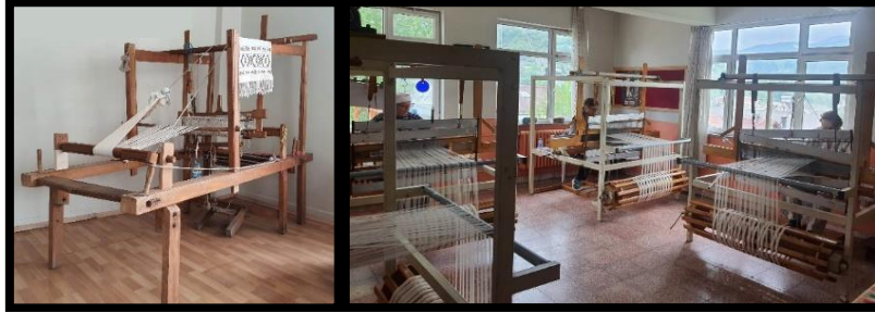
Resim 2. Düzen Tezgâhının Genel Görünümü (Ayancık keten evi) (Turan, 2022)