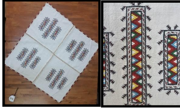
Resim 20. Masa örtüsü (Turan, 2023)

Resim 20'deki keten dokuma 80x80 cm. ölçülerinde masa örtüsüdür. Kare forma sahip dokumanın çözgüsü pamuk, atkısı keten ipliktir. Bu ürünün her bir parçası ayrı dokunmuş olup tığ işi örgüsü ile birleştirilmiştir. Dokumanın merkezi göyneğin yaka kısmına işlenen sökme yaka tekniği uygulanmıştır. Dokumanın etrafı yine tığ işi örgüsü ile tamamlanmıştır.