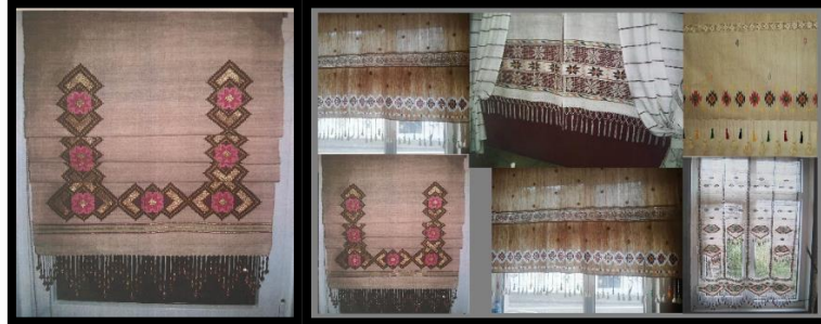
Resim 21. Mekanizmalı Perde (Yılmaz, 2023)

Yörede bazı perdelerin kompozisyon özellikleri ve motifler yöreye özgü kullanılarak, bazıları ise dokuyucuların yöreye özgü motifleri kendi tasarımlarıyla farklı kompozisyon içinde kullandıkları görülmektedir. Dokumanın zemini krem renk olup, motifler alternatif sıralarla yerleştirilmiştir. Bazı örneklerde ise, dokumanın eni yönünde yerleştirilmiş dar ve geniş şeritlerin belli bir düzenle sıralanmasıyla oluşturulmuştur. Bu şeritlerin arasında motifler hâkimdir. Bazı örneklerde ise motifler zemine diyagonal şekilde yerleştirilmiştir. Dokumaların tek kısa kenarı saçaklarla veya boncuklarla süslenmiştir.