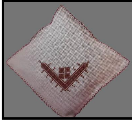
Resim 23. Keten paça işi kırilent (Ayancık Halk Eğitim Merkezi Akşam Sanat Okulu arşivi) (Öztürk ve Akın, 2017)

Resim 23'deki kırilent kılıfı, 35x35 cm. ölçülerinde kare forma sahip olup dokumanın çözgüsü pamuk, atkısı keten ipliklidir. Dokumanın rengi krem olup köşe kısmı paça işi tekniği ile işlenmiştir. Kırilent kılıfının çevresi, zürafa tekniği ile temizlenmiştir.