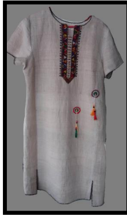
Resim 33. Keten tunik (Asuman Yılmaz arşivi) (Yılmaz, 2022)

Resim 32'deki keten tuniğin, çözgüsü kıvrak, atkısı keten ipliktir. Tunüğün yaka kısmı sökme yaka tekniği ile işlenmiş olup kenarları zürefa tekniği ile temizlenmiştir. Bu ürün etek ucu ve kol ucu yırtmacı ise: yüzlü yaka tekniği ile işlenmiş olup kenarları farklı renklerde tığ oyası ile süslenmiştir.