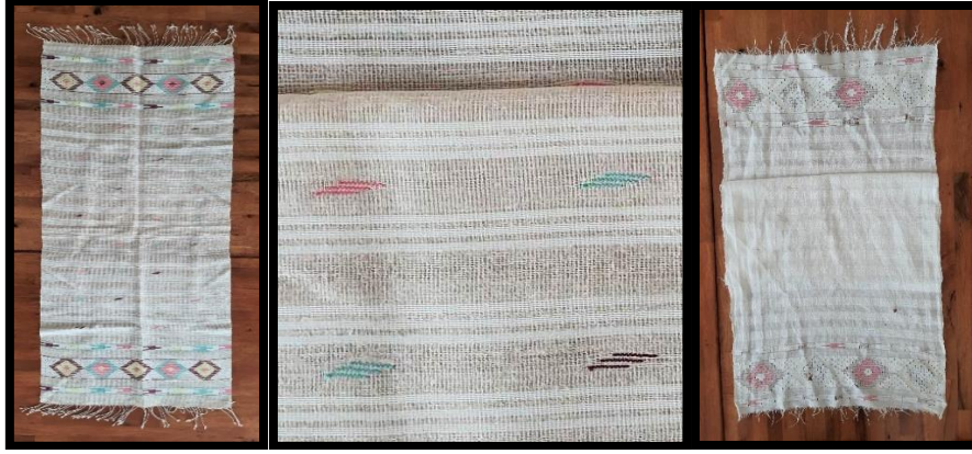
Resim 15. Masa örtüsü (Asuman Yılmaz arşivi) (Turan, 2023)