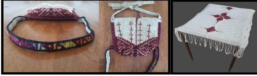
Resim 12. Nezgep ve Yengil

Resim 12'deki keten dokuma 53x109 cm ölçülerinde dikdörtgen ebatlı masa örtüsüdür. Çözüğü pamuk, atkısı keten ipliktir. Dokumanın rengi krem olup iki kısa kenarı simetrik şekilde paça işi, iki uzun kenarı ise paça suyu tekniği ile işlenmiştir. Dokumanın iki kısa kenarı bükmeli saçaklarla tamamlanmıştır. Ayrıca yörede bir başka işleme türü olan nezgep işi ve yengil işi olarak bilinen işleme (nakış) örnekleri tespit edilmiştir. Süslenme unsuru olarak başa takılan ve saçları tutmaya yarayan nezgep ve nezgepin çene altından uzanan ve onu tutmaya yarayan parçası yengil üzerinde kullanılan işlemler günümüz masa örtülerinin zemininde ve iki kısa kenarda simetrik bir şekilde tasarlandığı tespit edilmiştir. Nezgep üzerinde bulunan işleme tersinden sayılarak susma tekniği ile yapılmış olup, desende tamamen bordo renk kullanılmaktadır (KK 2). Yörede buna nezgep işi ve yengil işi denmektedir. Yörede nezgep ve yengil işi, günümüz keten örtülerde farklı kompozisyonlarda da kullanıldığı gözlemlenmiştir (Resim 12).