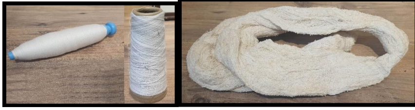
Resim 3. Dokumada kullanılan Pamuk ve bükümlü (kıvrak) İplik (Turan, 2022)