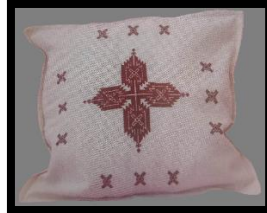
Resim 24. Keten nezgep işi kırilent (Ayancık Halk Eğitim Merkezi Akşam Sanat Okulu arşivi) (Öztürk ve Akın, 2017)

Resim 23'deki kırilent kılıfı, 35x35 cm. ölçülerinde kare forma sahip olup dokumanın çözgüsü pamuk, atkısı keten ipliklidir. Dokumanın rengi krem olup köşe kısmı paça işi tekniği ile işlenmiştir. Kırilent kılıfının çevresi, zürafa tekniği ile temizlenmiştir.