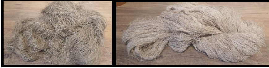
Resim 4. Ham keten iplik (Turan, 2022)