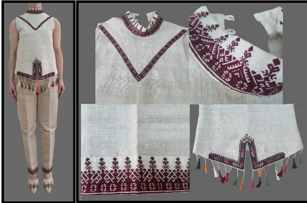
Resim 26. Pantolon-bluz takımı (Asuman Yılmaz koleksiyonu) (Turan, 2023)