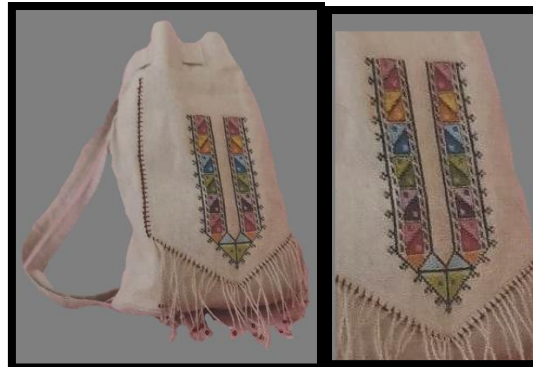
Resim 39. Keten sırt çantası (Öztürk ve Akın, 2017)

Resim 38'deki günlük kullanım için tasarlanmış çanta, çözgüsü pamuk, atkısı ketendir. Yöreye özgü geleneksel nezgep işi tekniği ile işlenmiştir.