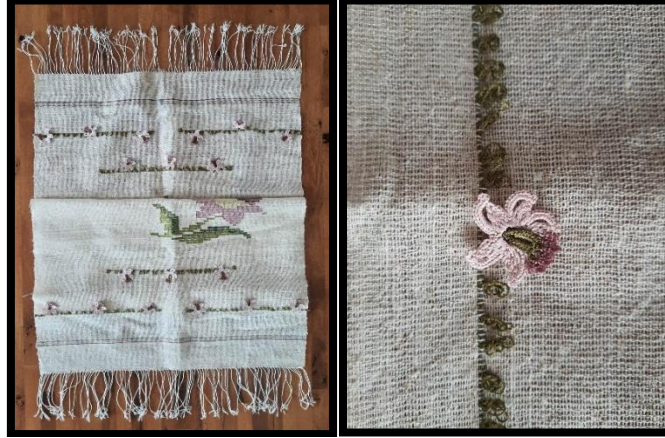
Resim 18. Masa örtüsü (Tığ oyalı keten dokuma, Asuman Yılmaz arşivi) (Turan, 2023)

yavrularını besleyen bir kuşun hikâyesini anlatmaktadır. Dokumanın iki kısa kenarı bükmeli saçaklarla ve saçak uçları ise farklı renkte boncuklarla süslenmiştir.