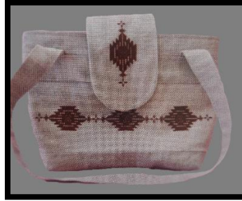
Resim 38. Keten Nezgep işi çanta (Ayancık Halk Eğitim Merkezi Akşam Sanat Okulu arşivi) (Öztürk ve Akın, 2017)

Çantalar, yöresel nakışlardan örnek alınıp modernize edilerek uygulanan kanava, ajurlu, yaka işi iğne oyalı, paça işi, nezgep işi, paça suyu işi ve sarma işi teknikleri uygulanmıştır. Çantalarda, tığ oyası, iğne oyası, saçaklar, boncuklar, dantellerle süslenerek mükemmel bir uyum sağlanmıştır.