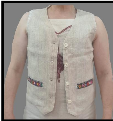
Resim 36. Keten Yelek (Asuman Yılmaz koleksiyonu) (Turan, 2023)

Resim 35'deki keten yelek, çözgüsü pamuk, atkısı keten ipliktir. Yöreğe özgü keten bezi üzerine zincir işi, rokoko işleme teknikleri ile işlenmiştir. Yeleğin sağ tarafında bulunan köşe kısmına paşa işi ve sökme yaka applike edilmiştir. Yaka kısmı, ince su üzerine yengil işi tekniği işlenmiştir. Ürünün sol tarafı ise nezgep işi işleme tekniği, eski üçetek kumaş parçası ve sökme yaka parçaları kullanılmıştır. Arka kısmında sökme yaka ve yüzlü yaka olmak üzere iki çeşit işleme tekniği kullanılmıştır (KK.6). Bu yelek çok eski, atıl durumdaki dokuma ürünlerinin birleşiminden oluşturulmuştur.