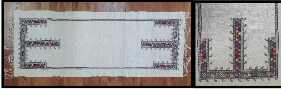
Resim 14. Masa örtüsü (Sökme yaka tekniği ve yengil işi, Asuman Yılmaz arşivi) (Turan, 2023)

Resim 13'deki keten dokuma 53x109 cm. ölçülerinde dikdörtgen ebatlı sehpa örtüsüdür. Çözüğü pamuk, atkısı keten ipliktir. Dokumanın rengi krem olup merkezine bordo renkli pamuklu nakış ipliği ile nezgep işi tekniği işlenmiştir. Dokumanın iki kısa kenarı bükmeli saçaklarla tamamlanmıştır.