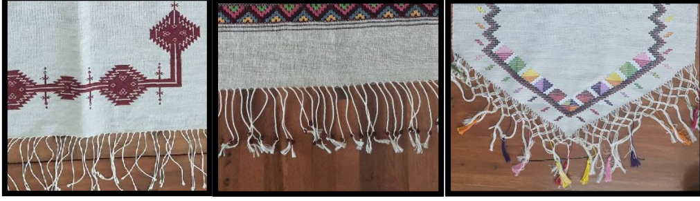
Resim 7. Basit saçak, bükmeli saçak, makrame (Ayancık Halk Eğitim Merkezi Akşam Sanat Okulu arşivi) (Turan, 2023)

Yörede keten dokuma üzerine işlenen nakışı oluşturmak için kullanılan desen iplikleri farklı renklerde pamuklu nakış iplikleri olduğu görülmektedir. Günümüz tasarımlarında eski örneklerde görülen işleme teknikleri farklı kompozisyonlarda, bazen de birebir aynı kompozisyon özelliğinde kullanıldığı tespit edilmiştir. İşleme özellikleri açısından incelendiğinde; çapraz iğne (kanava), verev, iğne oyası (zürefa), tığ oyası, hesap iğnesi, ajur (sökme), sarma, kanaviçe ve susma teknikleri kullanılmıştır. Yörede keten dokumalarda kullanılan motifler ise; kilim örneği ve mekik içi motifli şeklindedir. Ayancık keten evinde keten dokumaları ve üzerindeki işlemler kursiyerler tarafından sırayla yapılmaktadır. Yörede günümüz modasına uygun ürünler için tasarlanmış tığ oyalı keten dokumalarda mevcuttur. Oyalar dokuma esnasında çözgü iplikleri arasına titizlikle yerleştirilerek ürün çeşidine göre yerleşim planları geliştirilmektedir. Yörede ürün özelliğine göre saçaklarla süslenir. Basit saçak bağlama, bükerek ve makrame düğümleri ile zenginleştirilmiştir (Resim 7). Bazı örneklerde ise pul-boncuk ve renkli pamuk iplikler ile süslenmiş olduğu gözlemlenmiştir.