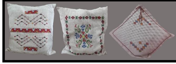
Resim 22. Keten kırilentler (Turan, 2023)

üzere üç farklı şekilde işlenmiş örnekleri tespit edilmiştir. Bu örneklerin dışında motiflerin dokuma esnasında oluşturularak yapılan örnekleri de mevcuttur. Keten kırilent kılıfları kompozisyon özelliği bakımından incelenecek olursa, zemin etrafını çevreleyen ince bordürler ve merkezine yerleştirilmiş motifler, yalnızca dokumanın orta sahasına yerleştirilen motifler ve sadece zemin etrafını çevreleyen ince bordürler şeklinde tasarlanan ürünler mevcuttur.