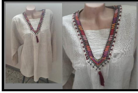
Resim 34. Keten tunik (Ayancık Halk Eğitim Merkezi Akşam Sanat Okulu arşivi) (Turan, 2023)

Resim 34'deki keten tuniğin, çözgüsü kıvrak, atkısı keten ipliktir. Tunüğün yaka kısmı yüzlü yaka tekniği ile işlenmiş olup püskül ile tamamlanmıştır.