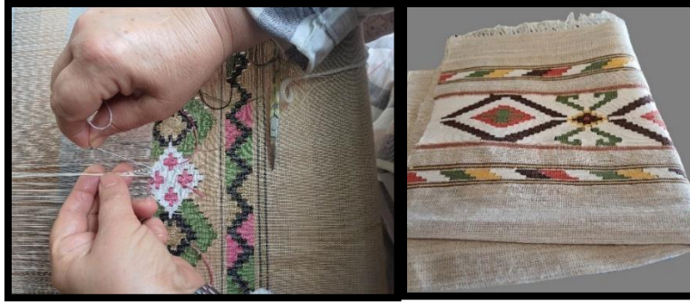
Resim 6. Ayancık Keten Dokuma (Turan, 2023)

Ayancık keten dokumalar, düzen adı verilen dört gücülü ve iki adet ayak ile ahşap dokuma tezgâhlarında bezayağı tekniğiyle dokunmaktadır (Resim 6). Çözgü ipleri her tarak aralığından çift geçirilir. Dokunan kumaşların enleri genellikle 48, 50, 52 cm aralığında değişir. Kullanım amaçlarına göre farklı ebatlarda dokunmaktadır. Yörede bazı dokumaların çözgüsü pamuk olup kalınlığı 20/1, 16/1 aralığındadır. Atkısı ve çözgüsü keten iplik 8, 10, 12, 14 numara arasında değişmektedir (KK1).