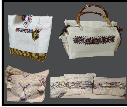
Resim 37. Keten çantalar (Yılmaz, 2023)

Günümüzde Ayancık yöresinde çantalık kumaşlarda atkı ipi keten, çözgü ipi pamuk olup bezayağı tekniği ile dokunmaktadır. Yörede bu ürünler farklı tasarımlarda, ahşap çanta sapı, kurdele, sutaşı, dantel, püskül, renkli pul-boncuklar gibi farklı süsleme malzemeleri ile bir arada kullanılmaktadır (Resim 37). Diğer ürünlerde olduğu gibi yöreye özgü motifler ve işleme teknikleri uygulanarak günümüz kıyafetlerine uygun şekilde tasarlanmıştır örnekleri mevcuttur.