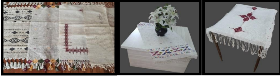
Resim 9. Sehpa ve masa Örtüleri (Ayancık Halk Eğitim Merkezi akşam Sanat Okulu arşivi) (Turan, 2023)

Dekoratif örtüler evlerimizin en önemli parçalarından olup, evlerimizi güzelleştirip özellik kazandırmak için kullandığımız mekânlara estetik bir görünüm kazandırmaktadır. Geleneksel keten dokumalardan meydana gelen bu örtülerin çözgüsü pamuk ve atkısı keten dokumalar olup, geleneksel dokumaların çağdaş yorumlanmasıyla estetik güzelliği ortaya çıkarmaktadır. Yörede yapılan incelemelerde örtüler genellikle 42x140 ve 53x112 cm ölçü aralığında dikdörtgen ve kare ebatlı dokumalara rastlamaktayız. Bölgede aksesuar unsuru olarak kullanılan masa ve sehpa örtüleri, yöreye özgü tasarımların dışında farklı tasarım uyguladıkları örnekleri de mevcuttur. Dokumanın zemin rengi krem olup, motifler alternatif sıralarla yerleştirilmiştir. Bazı örneklerde ise, dokumanın eni yönünde yerleştirilmiş dar ve geniş şeritlerin belli bir düzenle sıralanmasıyla oluşturulmuştur. Bu şeritlerin arasında motifler hâkimdir. Örtülerin iki kısa kenarında bulunan ve yörede Dökme olarak isimlendirilen geometrik motif, dokuma esnasında renkli pamuk iplikleri ile oluşturulmuştur. Bazı örneklerde ise yalnızca dokumanın zemini veya hem zemin hem de kenar suyu ile süslenmiş örnekler tespit edilmiştir. Dokumaların iki kısa kenarı saçaklarla tamamlanmıştır (Resim 9).