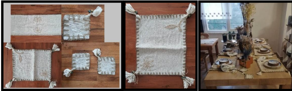
Resim 19. Keten sofra takımı (Zeynep Tosun koleksiyonu) (Yılmaz, 2022)

Bu ürünü diğer ürünlerden ayıran özellik, geleneksel el sanatlarımızdan olan tığ oyasını keten dokuma ile birleştirerek, günümüz Ayancık keten dokumasına farklı bir estetik kazandıran Asuman Yılmaz, yörede tığ oyarlarını ve keten dokumaların farklı kişiler tarafından yapıldığını ifade etmiştir (KK 1). Tığ oyalı keten dokumada, oylar dokuma esnasında çözgü iplikleri arasından farklı yerleşim planları geliştirilerek bir arada kullanılmaktadır.