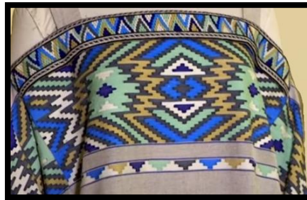
Resim 29. Kilim örneği motifi (Yığma tekniği) (NTV Program, 2023)