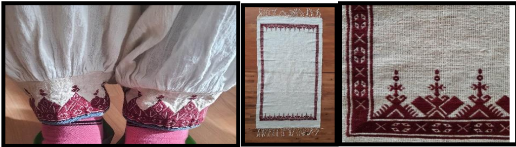
Resim 10. Paça işi ve Paça suyu Resim 11. Masa örtüsü (Paça işi) (Turan, 2023)

Geçmiş dönemlerde el yüz havlusu olarak kullanılan, atkı ve çözgüsü keten olan peşkirler, günümüzde 30, 40, 50 cm eninde dokunmaktadır. Peşkirlerde işleme tekniği olarak, verev sarma, düz sarma, balıksırtı, düz pesent, verev pesent ve civan kaşı gibi yöresel isimler kullanılmaktadır (Tüm, 2019:1192). Günümüzde peşkirler, farklı işlevlerde sehpa ve masa örtüsü olarak kullanılmakta olup, üzerine eski örneklerdeki işleme teknikleri uygulandığı tespit edilmiştir. Aynı zamanda geçmiş ürünler incelendiğinde günlük hayatta kullanılan yöresel isimleri ile paça, nezgep, göynek gibi ürünlerde kullanılan ve nezgep işi, paça işi, sökme işi, nezgep işi, yengil işi gibi kullanılan işleme teknikleri, günümüz keten dokumalarının ev aksesuarları ve giyim aksesuarlarında farklı kompozisyonlarda kullanıldığı gözlemlenmiştir. Bölgede yapılan araştırmalar sonucunda yöresel ismi Paça olarak bilinen göynek altına giyilen şalvar ve bu şalvarın paça kısmına uygulanan el nakışı, paça işi olarak bilinen işleme (nakış) örnekleri tespit edilmiştir. Paça kısmına susma tekniği ile yapılan işlemeye paça işi , kenar kısmına yapılan işlemeye ise paça suyu (Resim 10) denilmektedir (Akın, 2005: 6-7). Bu işlemler sadece bordo renk olup pamuklu nakış ipliği ile işlenmektedir. Yörede bu işleme tekniği dokumalarda çok sık kullanılmaktadır.