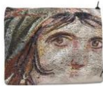
Resim 8 Çanta