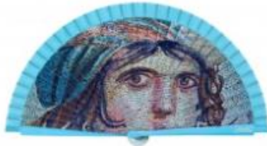
Resim 12 Yalpaze