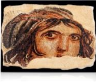
Resim 6 Mozaik Fresk