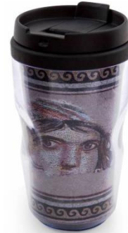
Resim 3 Metal termos kupa