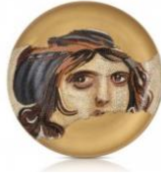
Resim 11 Tabak