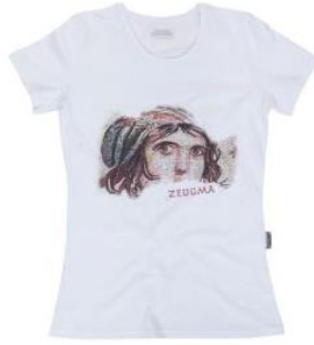
Resim 7 T- shirt