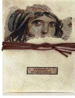
Resim 4 Defter