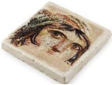
Resim 1 Bardak altlığı

Geçmişi çok eskilere dayanan Zeugma antik kentinin tarihi, bilimsel kaynaklardan araştırılmış, kültürlerle, ekonomiyle ve coğrafi yapıyla olan bağı incelenmiştir. Yapılan araştırmalar doğrultusunda, müze de yer alan mozaiklerin büyük bir kültür mirası olmasına karşın, müzenin hazırlamış olduğu hediyeelik eşyalar dışında tasarım alanında fazla kullanılmamış olduğu gözlemlenmiştir. Gaziantep' in yüzü haline gelmiş olan Çingene Kızı figürünün yaygın olarak bilinmesine rağmen bakir bir alan olarak kalması, bu figürün günlük hayatta neden kullanılmadığı sorusunu akla getirmiştir. Bu çalışmayla beraber, Çingene Kızı figürü günlük hayata taşınacak, bu figürden yola çıkılarak insanların beğenisini toplamayı hedefleyen ve figürün daha fark edilebilir olmasını amaçlayan çeşitli ürünler oluşturulacaktır. Ürünler farklı yaş grupları göz önünde bulundurularak ve değişik mekânlarda da kullanılabilir olmasına dikkat edilerek tasarlanacaktır. Ayrıca tasarlanan bu çizimlerden ikisi ürün haline dönüştürülecek ve çalışmanın görsel olarak da desteklenmesi sağlanacaktır. Çingene Kızı mozaigi temalı hediyeelik eşyalar: