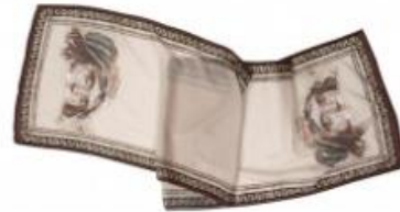
Resim 13 İpek Fular

http://www.muzedenhediye.com/ , Erişim Tarihi: 09.01.2016.