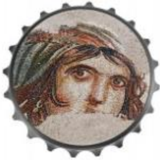
Resim 9 Şişe Açacağı