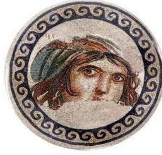
Resim 5 Ayna