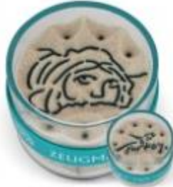
Resim 10 Kum Oyunağı