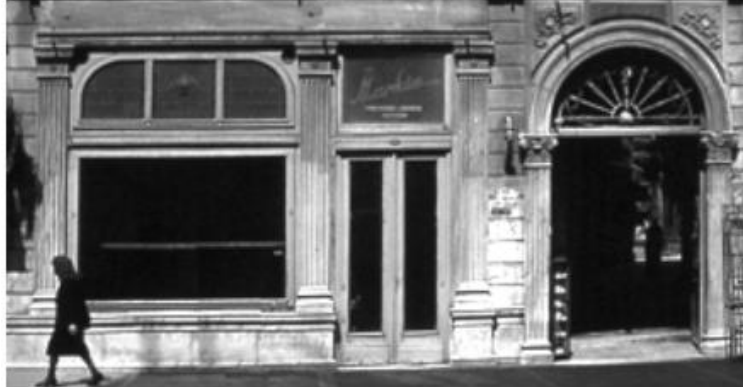
Görsel 8. İstiklal Caddesi Markiz Pastanesi (Beyoğlu, İstanbul, 1940 sonrası).

bakıldığında camı üzerine yerleştirilen HD ekranda dijital menü sunumu; hem pastanenin tarihi görsel kimliği ile uyuşmadığı (Görsel 9.) hem de görüntü kirliliğine neden olarak, tarihi dokunun zedelenmesine yol açtığı gözlemlenmiştir. Pastane yakın zamanda kapanmış olsa da belgelenen durumu ile tarihi dokuya karşıtlığı çerçevesinde uygun bir örnektir. Tespit edilen grafik tasarım örnekleri tipografisi, rengi, boşluk değerleri yeniden tasarlanması gereken bir tasarım ile baskı teknolojisi, ışık şartları ve baskı yüzeyi tekrar değerlendirilmesi gereken bir tasarımdır. Özetle, özellikle belli bir döneme ait ve tarihi değerleri korunmuş, malzemeleri değiştirilmemiş, dükkan cepheleri ve tabelaları titizlikle korunmalı, doku ile taban tabana zıt, karşıt tasarım malzemesi kullanımlarından uzak durulmalıdır.