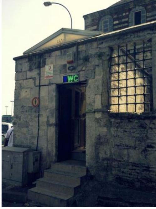
Görsel 12. Tarihi yapının duvarında yer alan dijital led tabela, yapının tarihi dokusunu zedelemektedir. (Fotoğraf: Rüstem Paşa Camii, Eminönü, İstanbul, 2013)