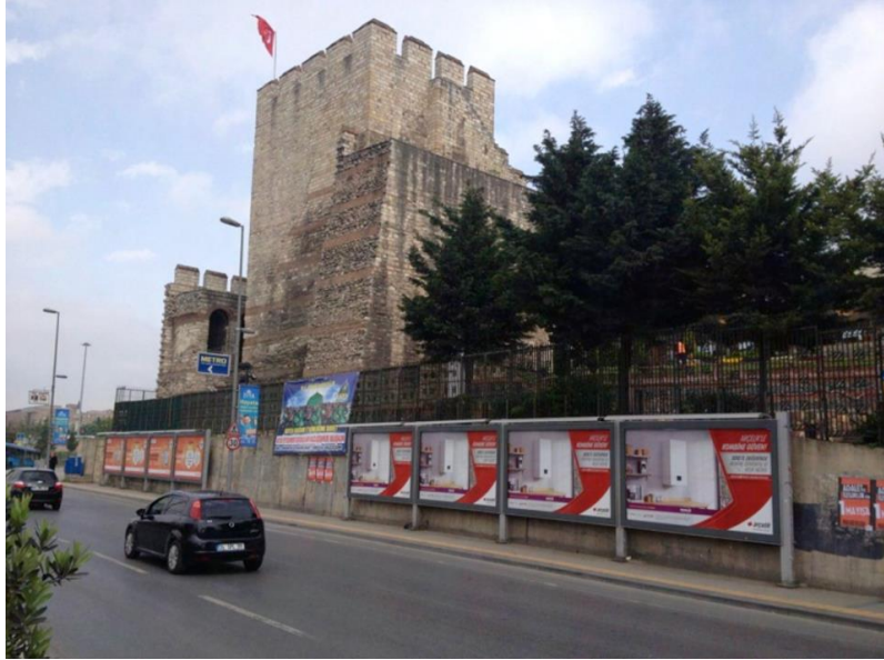
Görsel 5. Topkapı Kalesi önüne gelecek bir biçimde yerleştirilen billboard uygulamaları örneği. (Fotoğraf: Topkapı Kalesi, İstanbul, 2014).

Reklam, ilan ve tanıtım yönetmeliğinde belirtilen kurallara göre sabit reklam asma elemanları "Tarihi eser ve tescilli yapıların, ibadethanelerin, heykel ve sanat eserlerinin ve kültür-sanat işlevli yapıların vb önüne gelmeyecek ve bunları kapatmayacak biçimde yerleştirilmelidir." Ancak belirlenen tarihi Topkapı Kalesi'nin önüne gelecek bir biçimde yerleştirilen billboard uygulamaları örneğinde kuralın uygulanmadığı, grafik tasarım öğelerinden biri olan billboard gruplarının tarihi eserin önüne gelecek bir biçimde yerleştirildiği görülmektedir.