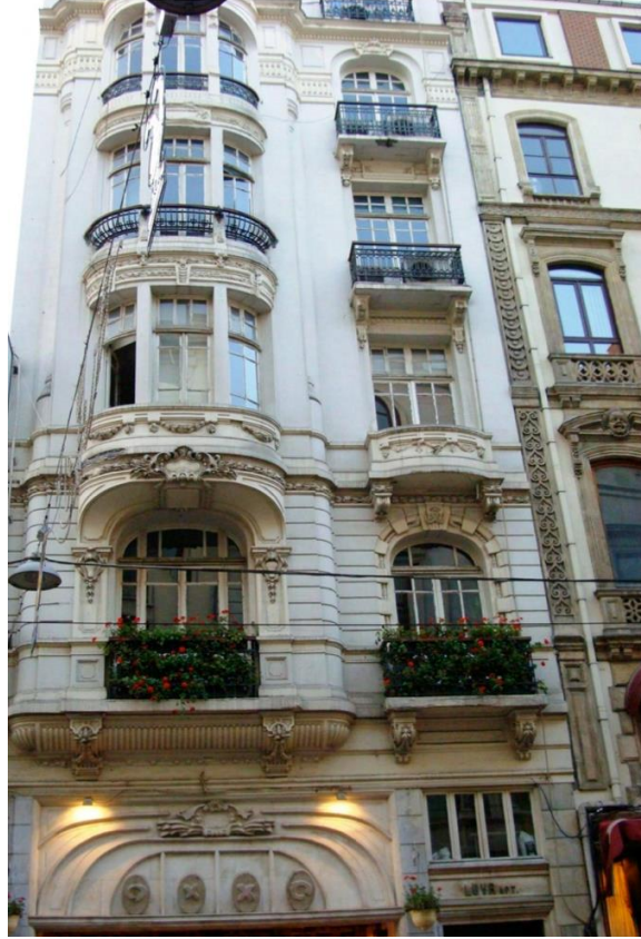
Görsel 7. İstiklâl Caddesi Oxxo mağazası, bina genel görünümü (Fotoğraf: İstanbul, Beyoğlu, 2012).