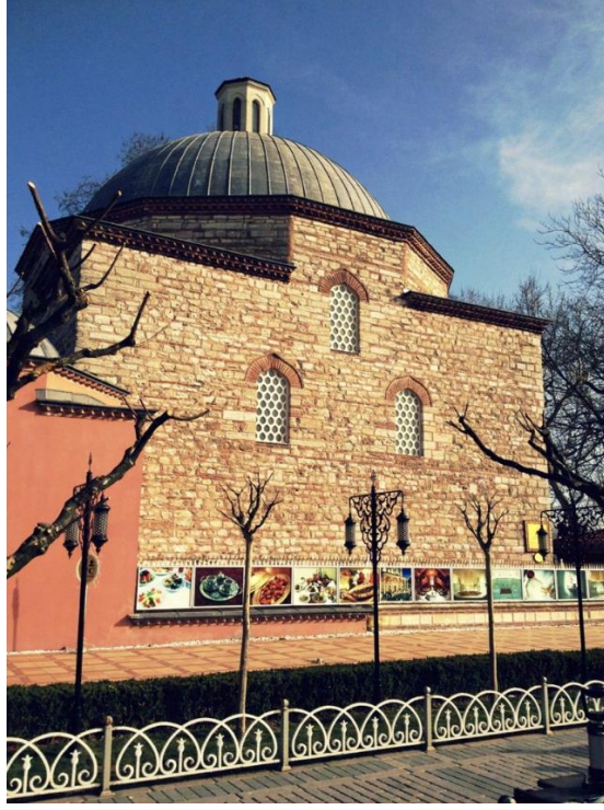
Görsel 4. Tarihi hamam üzerine dijital pano yerleştirilerek zedelenen tarihi doku örneği. (Fotoğraf Çekimi: Sultanahmet Hamamı, Sultanahmet, İstanbul, 2013).

Reklam, ilan ve tanıtım yönetmeliğinde belirtilen kurallara göre sabit reklam asma elemanları "Tarihi eser ve tescilli yapıların, ibadethanelerin, heykel ve sanat eserlerinin ve kültür-sanat işlevli yapıların vb önüne gelmeyecek ve bunları kapatmayacak biçimde yerleştirilmelidir." Ancak belirlenen tarihi Topkapı Kalesi'nin önüne gelecek bir biçimde yerleştirilen billboard uygulamaları örneğinde kuralın uygulanmadığı, grafik tasarım öğelerinden biri olan billboard gruplarının tarihi eserin önüne gelecek bir biçimde yerleştirildiği görülmektedir.