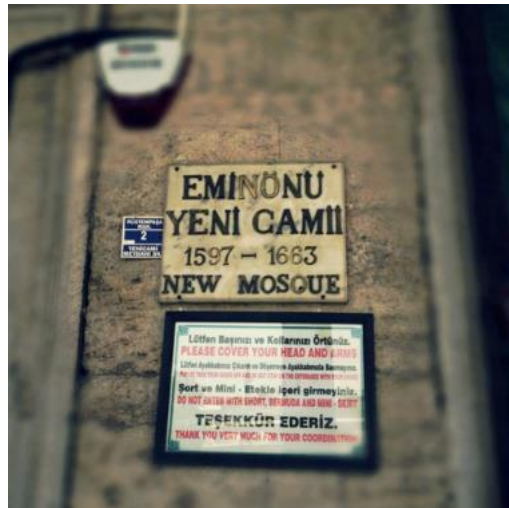
Görsel 11. Eminönü Yeni Cami kapı girişinde yer alan mermer tabela, caminin tarihi taş dokusuyla uyumlu bir görünüm sağlamasına rağmen, çerçeve içine yerleştirilen uyarı içerikli renkli dijital baskı örneği karşıt ve uyumsuz bir görünüm sergilemektedir. (Fotoğraf: Eminönü Yeni Cami, İstanbul, 2013)