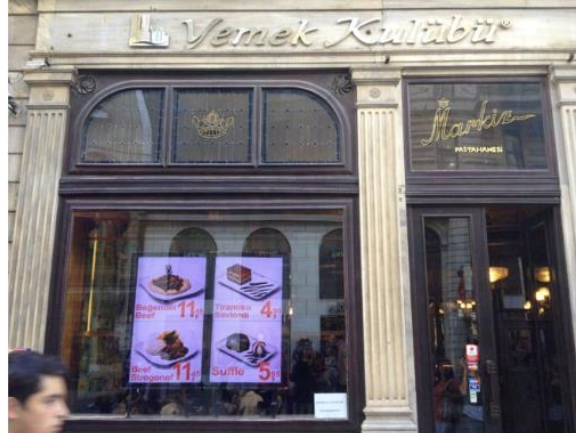
Görsel 9. İstiklal Caddesi Markiz Pastanesi. (Fotoğraf: Beyoğlu, İstanbul, 2012)

Grafik Tasarım öğeleri ve kentte uygulama esasları, reklam, ilan ve tanıtım kuralları çerçevesinde, il bütününde yer alan tabelaların, şehrin estetik ve mimari dokusunu bozmayacak, kentin doğal ve tarihi silüeti ile çelişmeyecek şekilde tasarlanması konum, renk, şekil ve boyutları gibi unsurların, grafik tasarım ekibinin de içinde bulunduğu yetkili birimlerce belirlenmesi gerekmektedir. Ticari tanıtım tabelaları, reklam panoları yine belli bir standart gözetilmeksizin çeşitli şekillerde kullanılabilir. Bu çeşitlilik kentte görsel kirliliğe neden olmaktadır. Çeşitli şekil ve boyutta görsel kirliliğe neden olan ticari tabelalar ile bina yüzeylerinin oluşturduğu görsel kirlilik engellenmelidir. Tarihi yapılar üzerinde kullanılan malzeme seçimlerinin karşıtlık yaratmamasına, doku ile uyumlu olmasına dikkat edilmelidir.