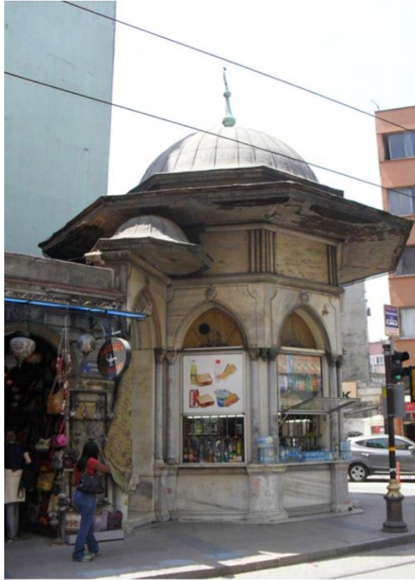
Görsel 1. Muradiye Sebili, Sultanahmet (Fotoğraf Çekimi: İstanbul, 2013).

Tespit edilen ilk uygulama örneğinde "Kent silüetini bozacak doğal ya da tarihi çevrenin algılanmasını engelleyecek şekilde tanıtım ve reklam uygulamaları konulamaz" kuralının tarihi sebili engelleyecek şekilde yerleştirilmiş reklam ve tanıtım uygulamaları ile bozulduğu belirlenmiştir. Örnekte tarihi çevrenin algılanmasını engelleyecek şekilde yerleştirilmiş, büfede satılan ürün içeriklerine dair hazırlanan tasarımların, tarihi dokuya zarar verecek şekilde sunulduğu gözlemlenmektedir.