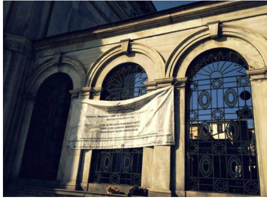
Görsel 3. Sultan II. Mahmut Türbesi, Sultanahmet, (Fotoğraf: İstanbul, 2013).

Örnekte "Tarihi eser ve tescilli yapılara ve bunları etkileyecek alanlara, binalara reklam uygulaması konulamaz" kuralının uygulanmadığını ayrıca Sultanahmet Hamamı dış cephesi üzerine yerleştirilen (içeride sunulan hizmetleri gösteren) dijital baskılı - ışıklı panoların tarihi doku ile uyumsuz, karışık bir görünüm (Görsel 4.) sergilediği görülmektedir.