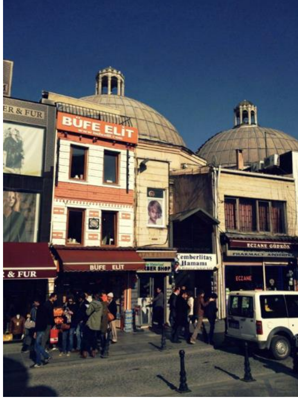
Görsel 2. Tarihi Çevre Çemberlitaş Hamamı, (Fotoğraf Çekimi: İstanbul, 2013)

Yine kent silüetini bozacak şekilde uygulaması tespit edilen, tarihi çevrenin algılanmasını engelleyici şekilde yerleştirilmiş büfe, berber dükkanlarına ve eczaneye ait tanıtım ve reklam uygulamaları örnekleri (Görsel 2.) görülmektedir. Bir diğer örnek ise türbe üzerine yeterince özenli bir biçimde yerleştirilmeyen bez afiş ile tarihi dokunun estetik bütünlüğünün zedelendiği (Görsel 3.) görülmektedir.