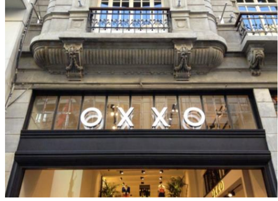
Görsel 6. İstiklâl Caddesi Oxxo mağazası tabelası mermer doku kullanımı - İstiklâl Caddesi Oxxo mağazası tabelası kutu harf kullanımı (Fotoğraf: Beyoğlu, İstanbul, 2012).