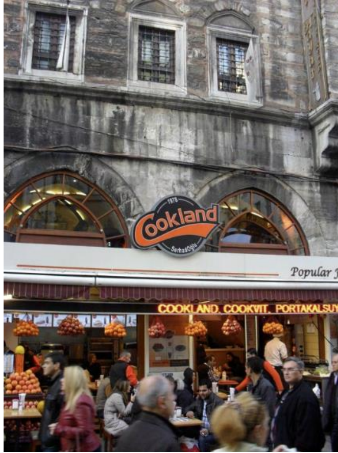
Görsel 10. Tarihi taş doku ile karşıtlık oluşturan reklam tabela örnekleri. (Fotoğraf: Sirkeci, İstanbul, 2013)