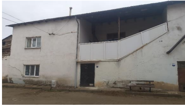
Resim 1.