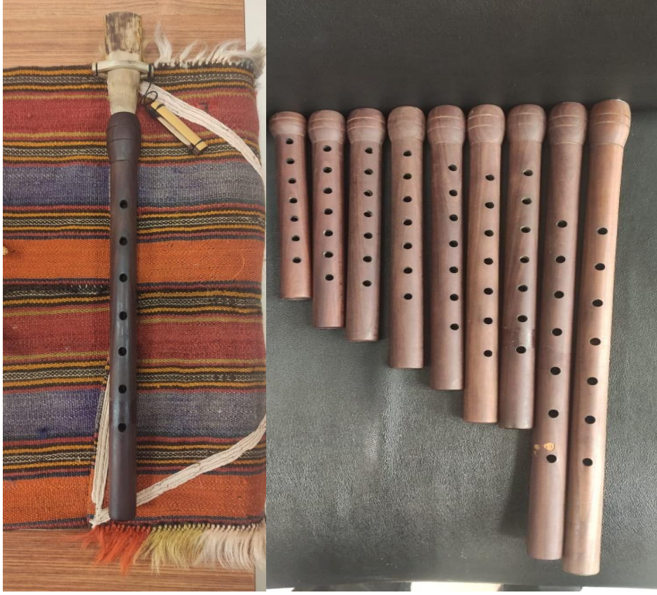
Resim 8.

Binali Selman, daha öncelerde kullanılan meylerin karar seslerindeki çeşitliliğini artırarak mey çalgısına derin bir nefes aldırılmıştır. Her sesi ayrı içeren mey gövdeleri Binali Selman sayesinde günümüze kadar gelmiştir. Bu sayede günümüzde kullanılan tam ve yarım seslere sahip mey çalgıları bulunmaktadır. Ayrıca mey klavyesinde kullandığı ek boğazlarla (boğum) akort sorununu büyük ölçüde çözmüştür.