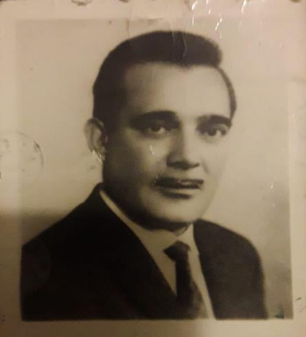
Resim 10. Binali Selman'ın bir zamanlar İstanbul Teknik Üniversitesi Türk Müziği Devlet Konservatuarında mey çalgısında eğitimlik yaptığı yıllar.