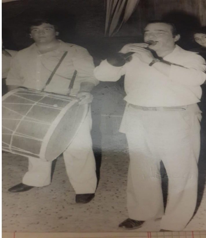
Resim 2. Zurnada Binali Selman ve Davulda Deniz Selman (Baba, Ođul Bir Dğnde)