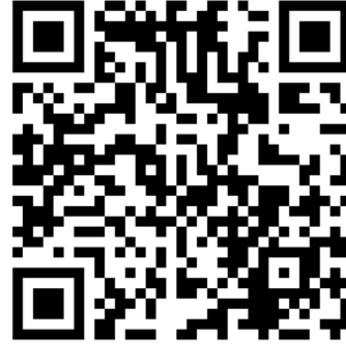
Kare kod 2. Muntazır teşrifine hazır kayık

Çalışmanın konusunu teşkil eden Kantemiroğlu’nun edvârında yer alan, Şekil 4’te rast perdesi üzerinden gösterimi yapılan Sünbüle makamındaki eserin, Kürdilihicazkâr makam yapısındaki seyri barındıran bölümlerinin tarafımdan İstanbul kemençesiyle icra edilen kaydına aşağıda verilen kare kodlardan erişilebilir.